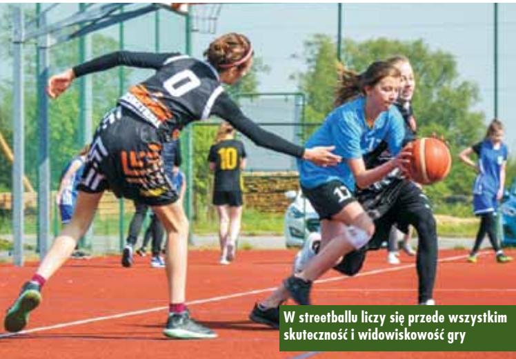
W streetballu liczy się przede wszystkim skuteczność i widowiskowość gry

drybling, szybkość i polot. Streetball staje się coraz bardziej popularny i lubiany w Polsce. Na najbliższych igrzyskach w Tokio wejdzie on do rodziny sportów olimpijskich. Zasady streetballu: gra toczy się na asfalcie, bruku, kostce, na połowie boiska do