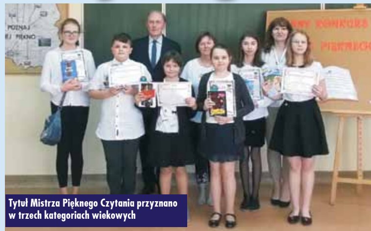
Tytuł Mistrza Pięknego Czytania przyznano w trzech kategoriach wiekowych

Uczniowie klasy IV czytali fragment z książki pt. „Magiczne