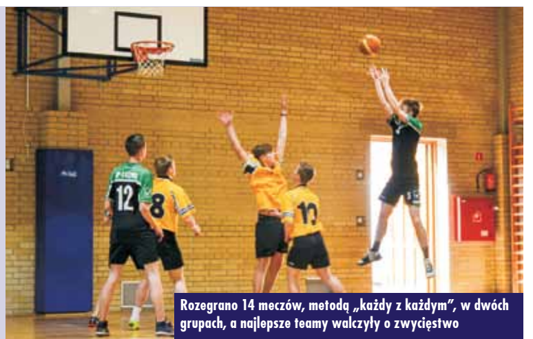
Rozegrano 14 meczów, metodą „każdy z każdym”, w dwóch grupach, a najlepsze teamy walczyły o zwycięstwo

czym najlepsze teamy stoczyły bój o puchary i awans.