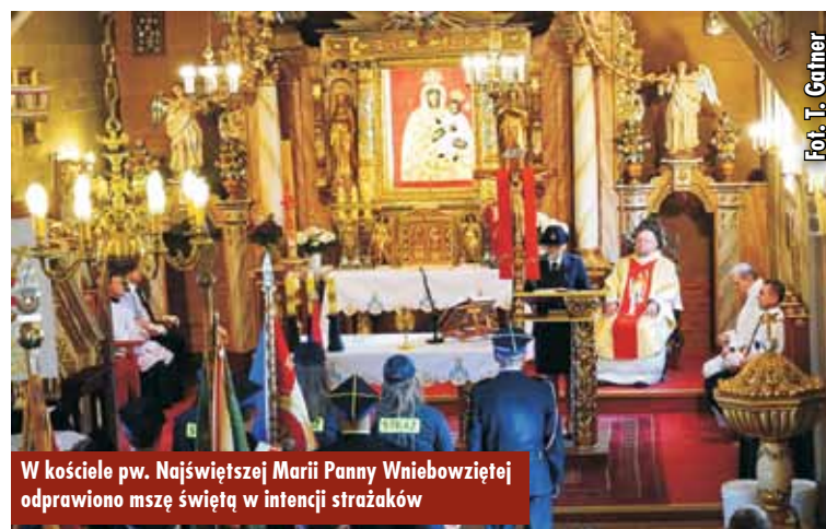
W kościele pw. Najświętszej Marii Panny Wniebowziętej odprawiono mszę świętą w intencji strażaków