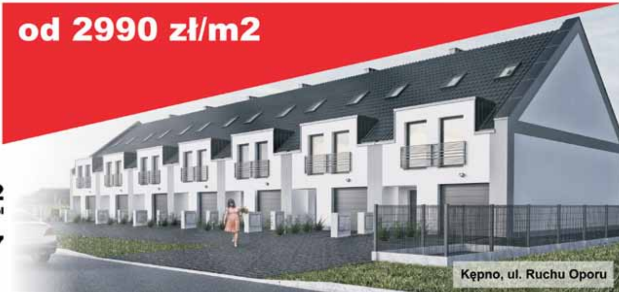
Kępno, ul. Ruchu Oporu