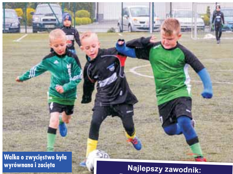
Walka o zwycięstwo była wyrównana i zacięta