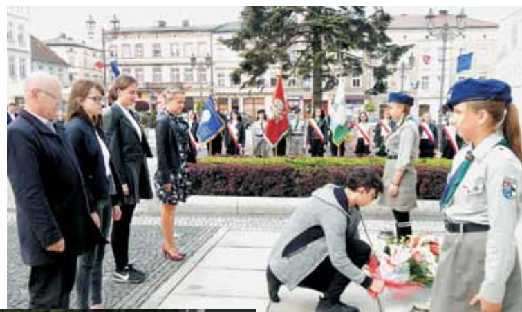
O godz. 12:00 zawyła syrena i rozpoczęły się uroczystości na kępińskim Rynku

Jednocześnie ustawa o ustanowieniu Narodowego Dnia Zwycięstwa zniósła przewidziane dotych-