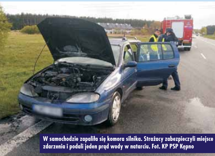
W samochodzie zapaliła się komora silnika. Strażacy zabezpieczyli miejsce zdarzenia i podali jeden prąd wody w natarciu.