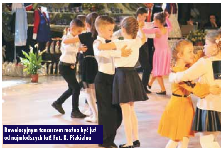
Rewelacyjnym tancerzem można być już od najmłodszych lat!

Biorąc udział w konkursie, wyrażają Państwo zgodę na publikację nazwiska w „Tygodniku Kępińskim” oraz na Facebooku.