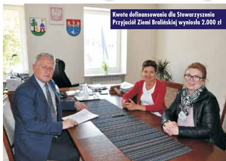
Kwota dofinansowania dla Stowarzyszenia Przyjaciół Ziemi Bralińskiej wyniosła 2.000 zł

Stowarzyszenie Przyjaciół Ziemi Bralińskiej złożyło ofertę w trybie, o którym mowa w art. 19a ustawy z 24 kwietnia 2003 r. o działalności pożytku publicznego i wolontariacie, zgodnie z którym Gmina Bralin może