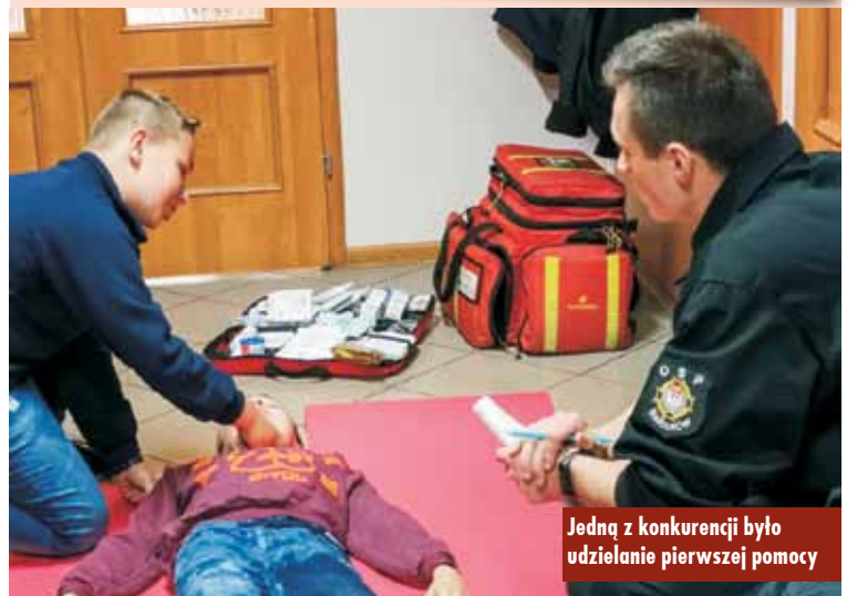
Jedną z konkurencji było udzielanie pierwszej pomocy