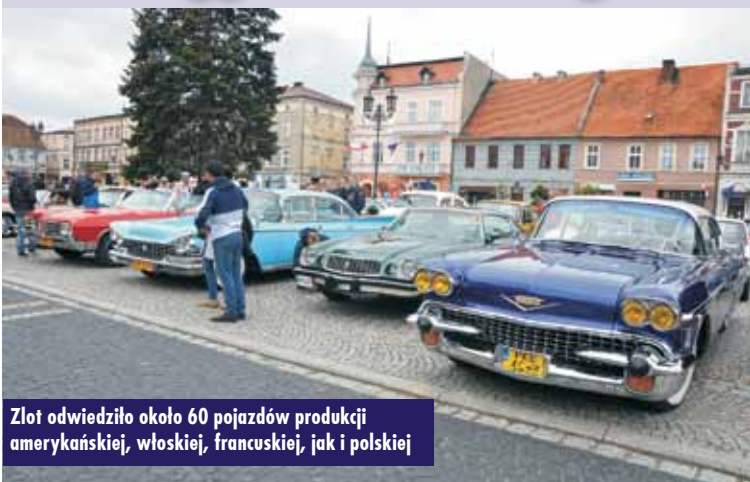
Zlot odwiedziło około 60 pojazdów produkcji amerykańskiej, włoskiej, francuskiej, jak i polskiej

3 maja br. kępiński Rynek stał się miejscem rozpoczęcia sezonu Kępińskich Spotkań Klasyków. Właściciele – głównie z naszego regionu – i miłośnicy oldtimerów zgromadzili się, aby podziwiać zabytkowe samochody i motocykle. - Mimo niesprzyjającej pogody zlot odwiedziło około 60 pojazdów. Na Rynek zjechały się pojazdy produkcji amerykańskiej, włoskiej, francuskiej, jak i polskiej. Najstarszy pojazd był z 1948 roku –