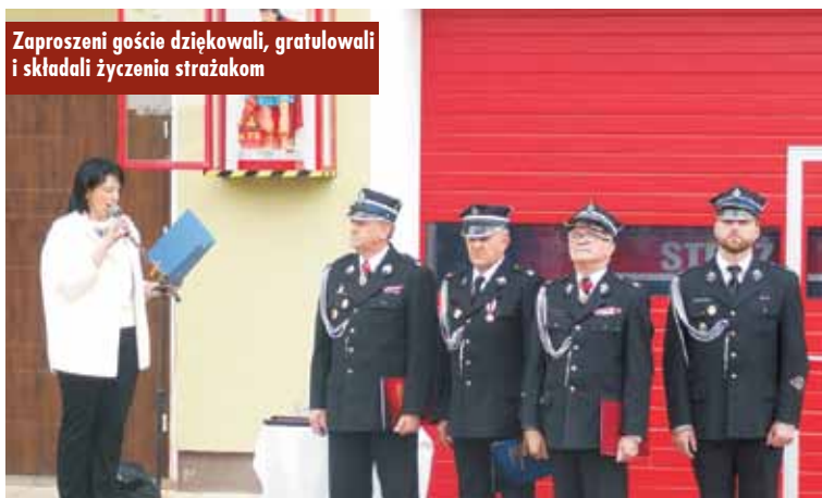
Zaproszeni goście dziękowali, gratulowali i składali życzenia strażakom