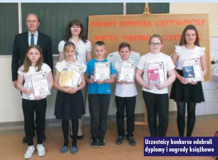
Uczestnicy konkursu odebrali dyplomy i nagrody książkowe