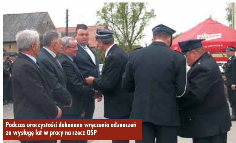
Podczas uroczystości dokonano wręczenia odznaczeń za wysługę lat w pracy na rzecz OSP

Rozpoczęcie sezonu motocyklowego odbyło się w Rychtalu po raz ósmy