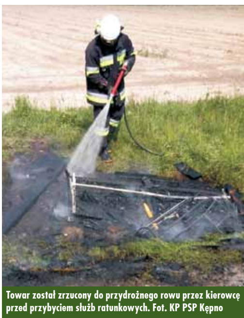
Towar został zrzucony do przydrożnego rowu przez kierowcę przed przybyciem służb ratunkowych.

8 maja br., około godziny 14.18, do Stankowiska Kierowania Komendanta Powiatowego Państwowej Straży Pożarnej w Kępnie zgłoszono zdarzenie na drodze krajowej nr 11 w miejscowości Piaski – pożar towaru przewożonego przez samochód dostawczy. Do zdarzenia zadysponowano zastępy z Jednostki Ratowniczo-Gaśniczej w Kępnie oraz OSP Łęka Opatowska. - Towar został zrzucony do przydrożnego rowu przez kierowcę przed przybyciem służb ratunkowych. Działania strażaków polegały na zabezpieczeniu miejsca zdarzenia oraz podaniu dwóch prądów wody w natarciu na pożar i w celu schłodzenia nagrzanej naczepy samochodu dostawczego. Po ugaszeniu pożaru