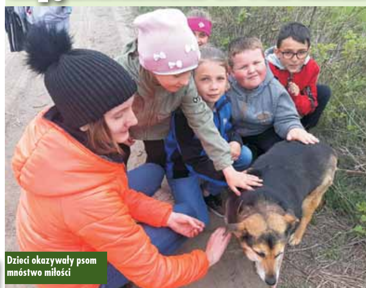
Dzieci okazywały psom mnóstwo miłości

Uczniowie Szkoły Podstawowej w Świbie wraz z opiekunami udali się do Międzygminnego Schroniska dla Zwierząt w Wysocku Wielkim. Dzieci przez dwa miesiące zbierały suchą i mokrą karmę dla psików.