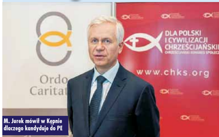
M. Jurek mówił w Kępnie dlaczego kandyduje do PE

Podczas spotkania były omawiane główne kierunki działania partii, Marek Jurek poinformował zebranych, z jakimi hasłami ubiega się o mandat, co dla niego jest najważniejsze i jakim ideałem jest wierność. również informacje na temat swoich dotychczasowych działań w Parlamencie Europejskim.