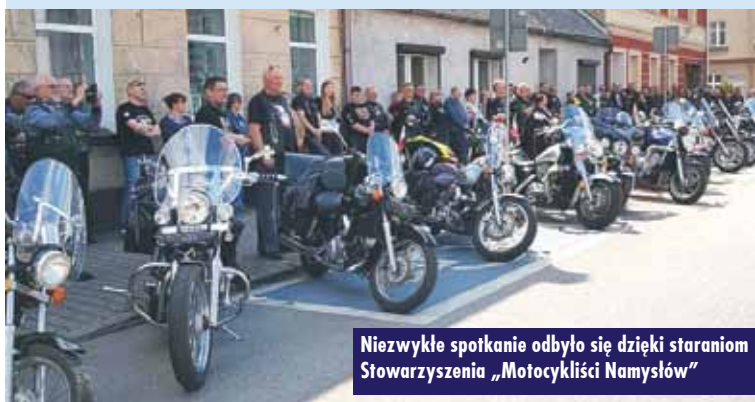
Niezwykłe spotkanie odbyło się dzięki staraniom Stowarzyszenia „Motocykliści Namysłów”