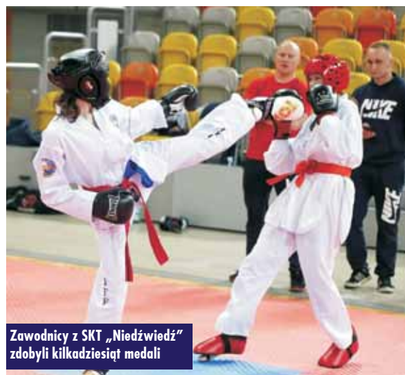
Zawodnicy z SKT „Niedźwiedź” zdobyli kilkadziesiąt medali

zawody do Strzegomia. Mimo że wcześniej nie braliśmy udziału w tych zawodach, poszło nam znakomicie. 15 Niedźwiedzi zdobyło 38 medali: 11 złotych, 18 srebrnych i 9 brązowych w konkurencjach, takich jak: