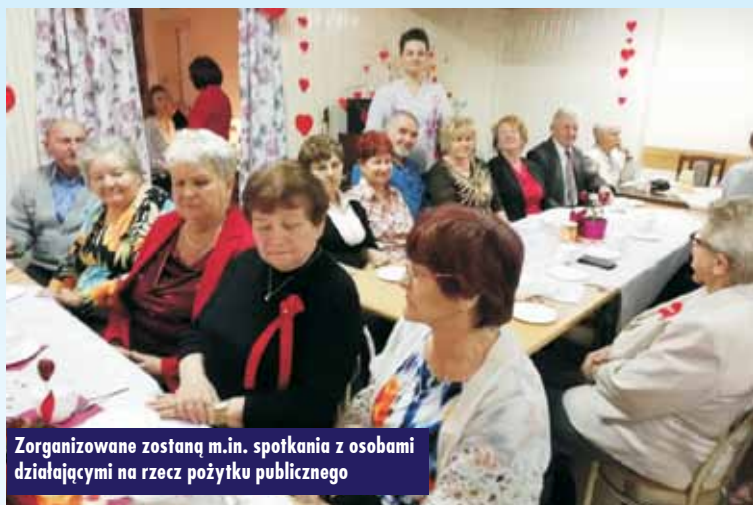
Zorganizowane zostaną m.in. spotkania z osobami działającymi na rzecz pożytku publicznego

Projekt zakłada przeprowadzenie dwóch zadań. Pierwszym z nich jest nagranie wywiadów z seniorami oraz ich emisja na antenie w radia „Sud”. W ten sposób zaprezentowani zostaną uczestnicy projektu, a przy tym