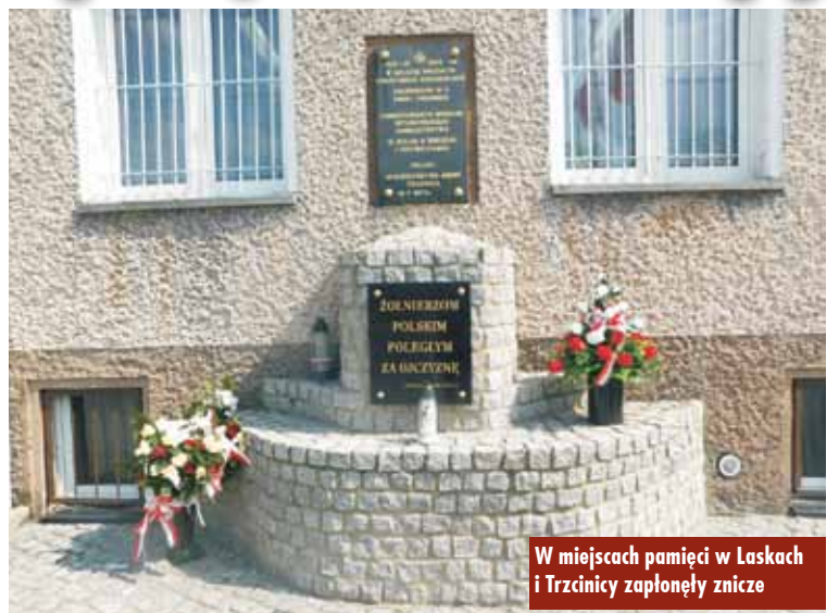
W miejscach pamięci w Laskach i Trzcínicy zapłonęły znicze

74. rocznicę zwycięstwa nad hitlerowskimi Niemcami upamiętniono poprzez zapalenie zniczy przy kościele parafialnym pw. Wniebowzięcia Matki Boskiej w Laskach, pod tablicą pamiątkową, znajdującą się przy Komisariacie Policji w Laskach oraz pod tablicą pamiątkową przy Urzędzie Gminy w Trzcínicy poświęconą Żołnierzom Polski Poległym za Ojczyznę.