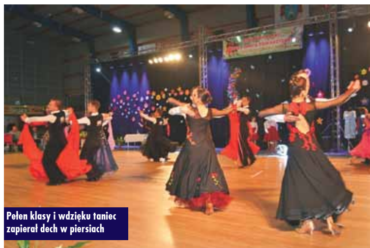
Pełen klasy i wdzięku taniec zapierał dech w piersiach

Zwieńczeniem wydarzenia była uroczysta Gala Taneczna, pełna energii, harmonii, pięknych, kolorowych