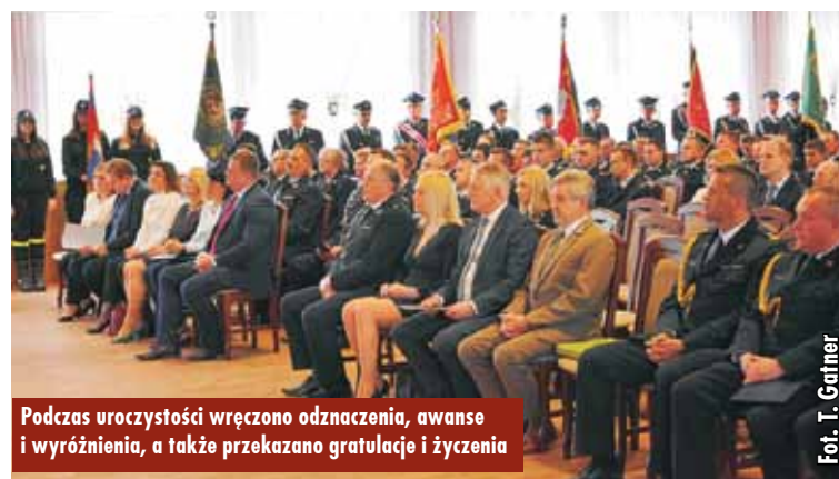
Podczas uroczystości wręczono odznaczenia, awanse i wyróżnienia, a także przekazano gratulacje i życzenia

Podczas Wielkopolskich Obchodów Dnia Strażaka w Poznaniu mł.