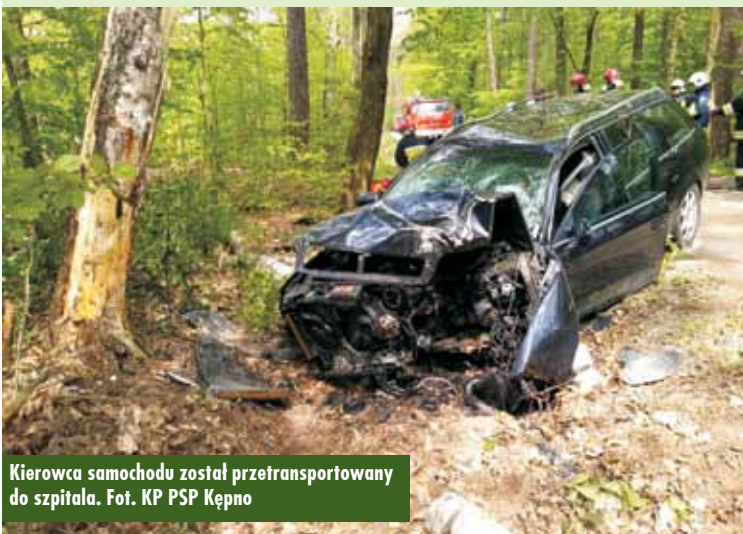
Kierowca samochodu został przetransportowany do szpitala.

Pożar trawy na nieużytkach przy ul. Granitowej w Olszowie