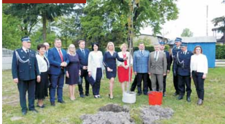
Obok Domu Ludowego w Laskach posadzono „Dąb Pamięci”