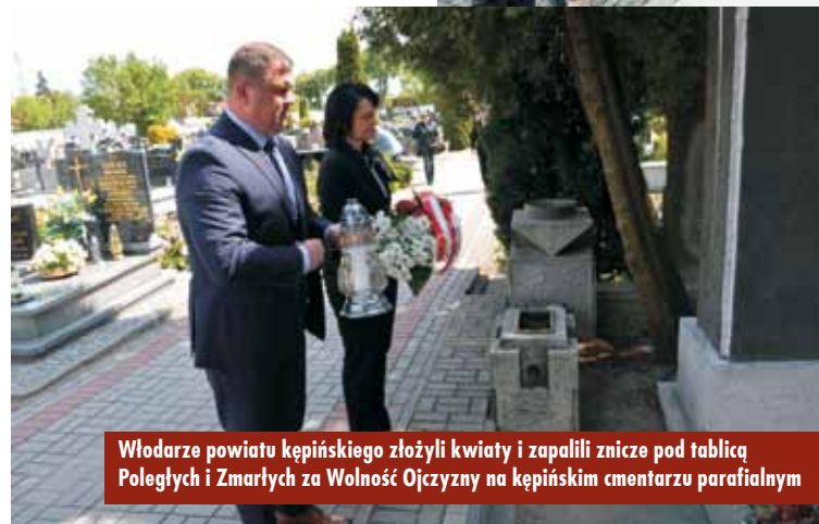
Włodarze powiatu kępińskiego złożyli kwiaty i zapalili znicze pod tablicą Poległych i Zmarłych za Wolność Ojczyzny na kępińskim cmentarzu parafialnym

czas na 9 maja Narodowe Święto Zwycięstwa i Wolności oraz spowodowała utratę mocy dekretu z 8 maja 1945 r., który je wprowadził.