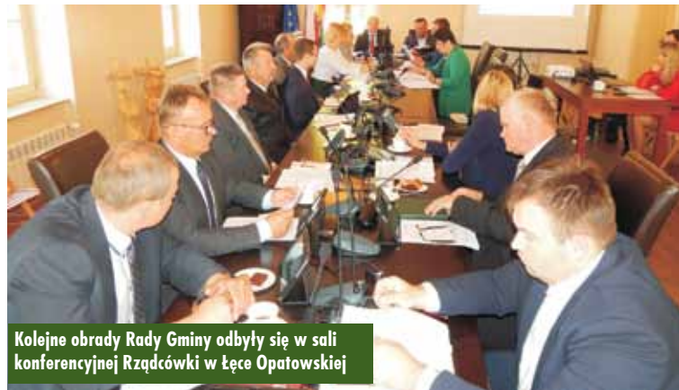
Kolejne obrady Rady Gminy odbyły się w sali konferencyjnej Rządówki w Łęce Opatowskiej

nnych oraz o samorządzie gminnym wskazuje, że jedynym organem, który może utworzyć nową jednostkę gminną, jest Rada Gminy – wyjaśniała sekretarz gminy.