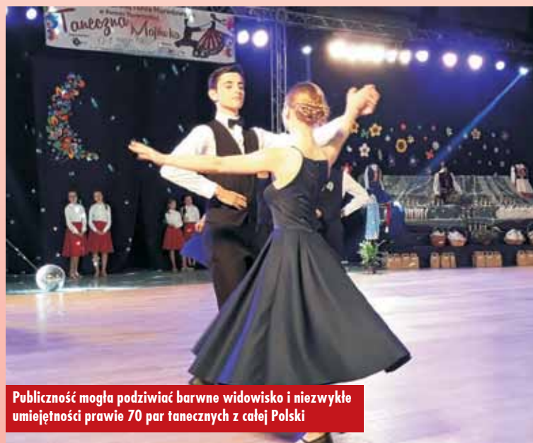
Publiczność mogła podziwiać barwne widowisko i niezwykle umiejętności prawie 70 par tanecznych z całej Polski