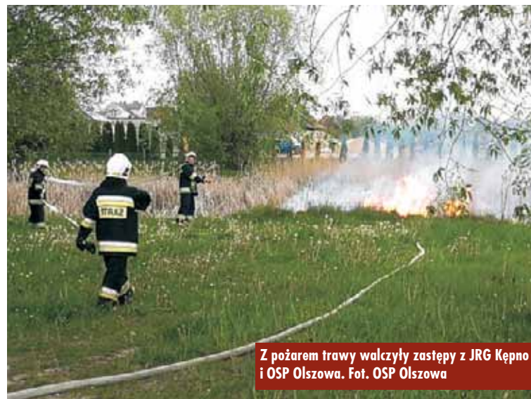
Z pożarem trawy walczyły zastępy z JRG Kępno i OSP Olszowa.

Pożar samochodu osobowego na drodze wojewódzkiej nr 482