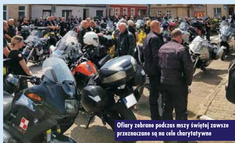
Ofiary zebrane podczas mszy świętej zawsze przeznaczone są na cele charytatywne