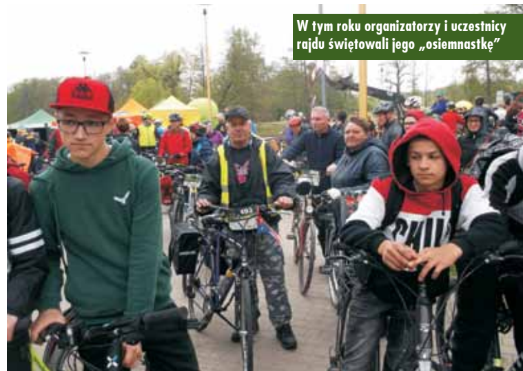
W tym roku organizatorzy i uczestnicy rajdu świętowali jego „osiemnastkę”

Rajd, zgodnie z tradycją, jest jednym z głównych punktów programu obchodów inauguracji sezonu Krośnickiej Kolei Wąskotorowej i dlatego start odgwiżdżała lokomotywa wąskotorowa.