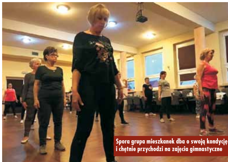
Spora grupa mieszkanki dba o swoją kondycję i chętnie przychodzi na zajęcia gimnastyczne