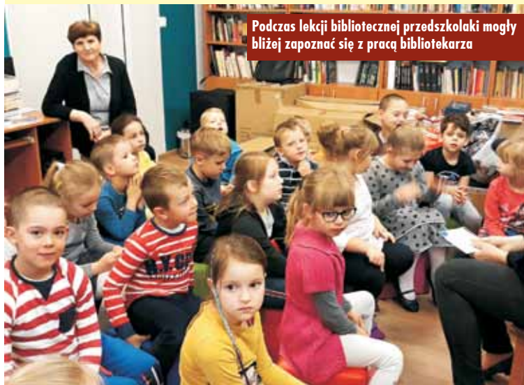
Podczas lekcji bibliotecznej przedszkolaki mogły bliżej zapoznać się z pracą bibliotekarza

Edycja Tygodnia Bibliotek 2019 odbywała się pod hasłem: „#biblioteka”. Jak uzasadniają wybór tego właśnie hasła jego pomysłodawcy ze Stowarzyszenia Bibliotekarzy Polskich: „Współczesna biblioteka jest mocno zakorzeniona w historii, a jednocześnie śmiało spogląda w przyszłość. Marka biblioteka jest utrwalona w świadomości społecznej, ale nieustannie poszukuje nowych użytkow-