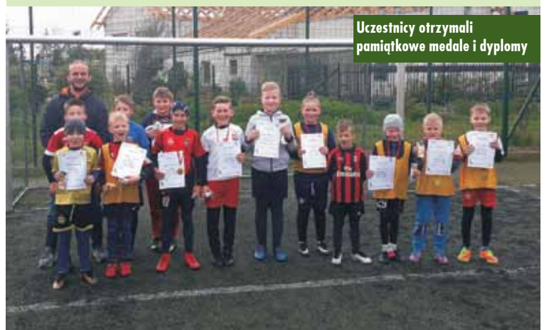
Uczestnicy otrzymali pamiątkowe medale i dyplomy

Narodowy Dzień Zwycięstwa obchodzony w Polsce 8 maja został uczczony również w gminie Trzcínica