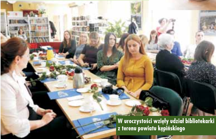
W uroczystości wzięły udział bibliotekarki z terenu powiatu kępińskiego