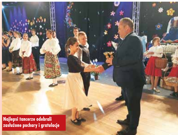
Najlepsi tancerze odebrali zasłużone puchary i gratulacje