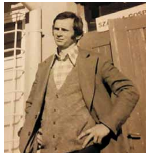
Przed szatnią w drużynie Lechii Gdańsk.