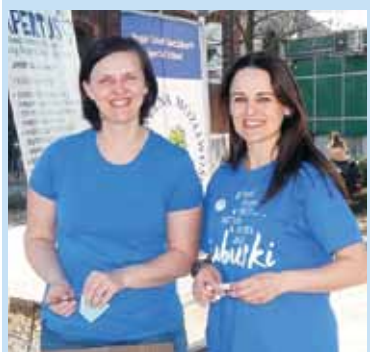
Na Skwerze Pocztownym działał punkt konsultacyjno-informacyjny dla osób i rodzin dotkniętych autyzmem

obchodów Światowego Dnia Świadomości Wiedzy o Autyzmie. Na znak solidarności z osobami dotkniętymi autyzmem zarówno budynek Starostwa, jak i całe otoczenie przybrały niebieskie barwy.