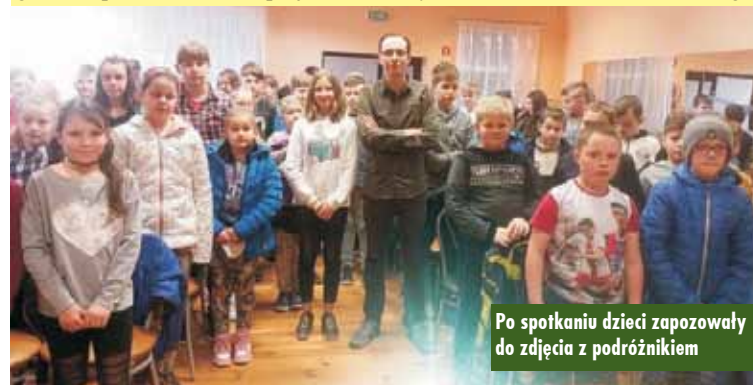
Po spotkaniu dzieci zapozowały do zdjęcia z podróżnikiem

Upalne dni i noce pełne drapieżnych zwierząt pozostały takie same, jak w opisach z książki. Uczniowie dowiedzieli się m.in. że Henryk Sienkiewicz nigdy nie był w tej części Afryki, która została opisana w powieści. Odwiedził jedynie Egipt, Zanzibar i Tanzanię. Podróżnik uświadomił też czytelnikom, że Staś i Nel nie mogli