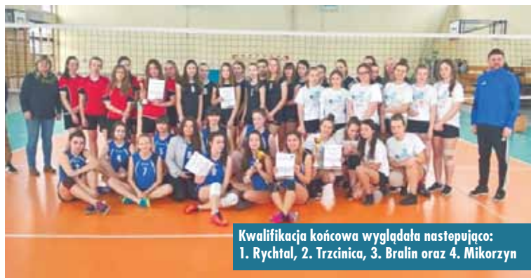
Kwalifikacja końcowa wyglądała następująco: 1. Rychtal, 2. Trzcinica, 3. Bralin oraz 4. Mikorzyn