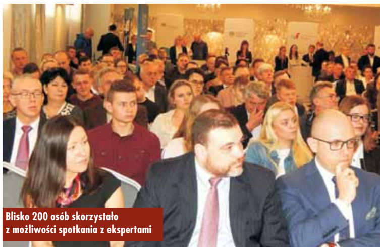
Blisko 200 osób skorzystało z możliwości spotkania z ekspertami