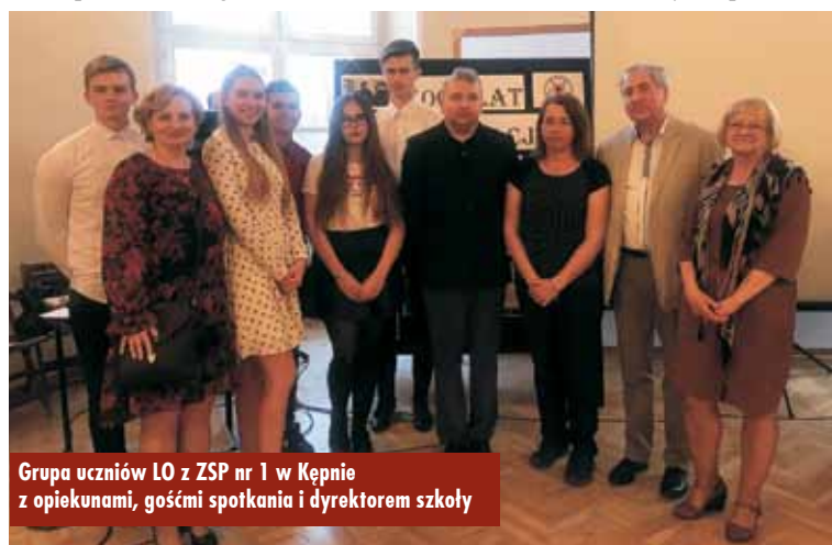
Grupa uczniów LO z ZSP nr 1 w Kępnie z opiekunami, gośćmi spotkania i dyrektorem szkoły