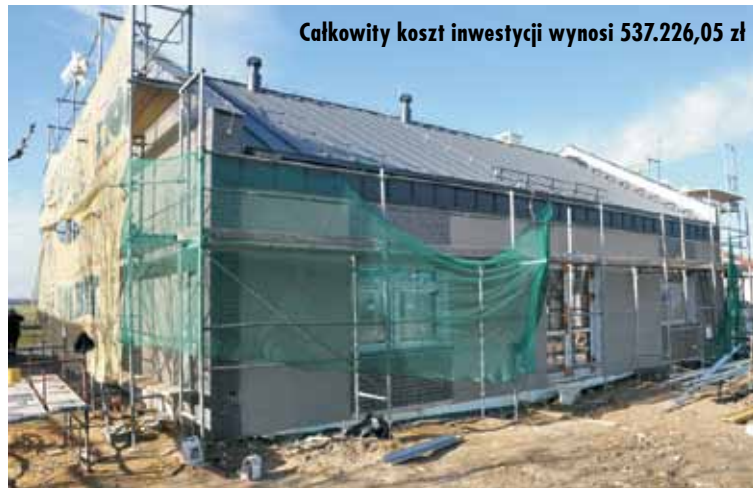
Całkowity koszt inwestycji wynosi 537.226,05 zł