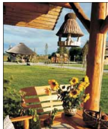
Osada nad Gopłem - laureat konkursu

W Wielkopolsce nie brakuje atrakcyjnych zakątków, cieszących się zasłużoną sławą. Gdzie znaleźć się bowiem takie dorodne grzyby, jak w Puszczy Noteckiej, czy wyjątkowe ryby, w tak czystym jeziorze, jak Powidzkie. Gdzie można namierzyć takie „europejskie symbole”, jak Szwajcaria Żerkowska, czy wędrowną tropem armii Napoleona. Albo niezwykle miejsca stworzone przez naturę, choćby wyspę konwaliową, czy inne kwietne jary. Legendarne głązy z zaklętymi w nich postaciami, rozsiane po polach i łąkach. „Szalone” sploty kajakowe bajecznymi rzekami, by wymienić Pilawę czy Rurzycę. Bądź trasy rowerowe, opasujące całe połacie regionu, szlak bursztynowy, czy szlak