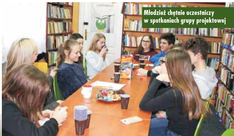
Młodzież chętnie uczestniczy w spotkaniach grupy projektowej

Podczas projektowania młodzież wykazała się kreatywnością i pomysłowością. Każdy miał swoją wizję koszulki, ale udało się wytypować najlepszy wzór. Jednak nie zakończyło się tylko na ubraniu – posta-