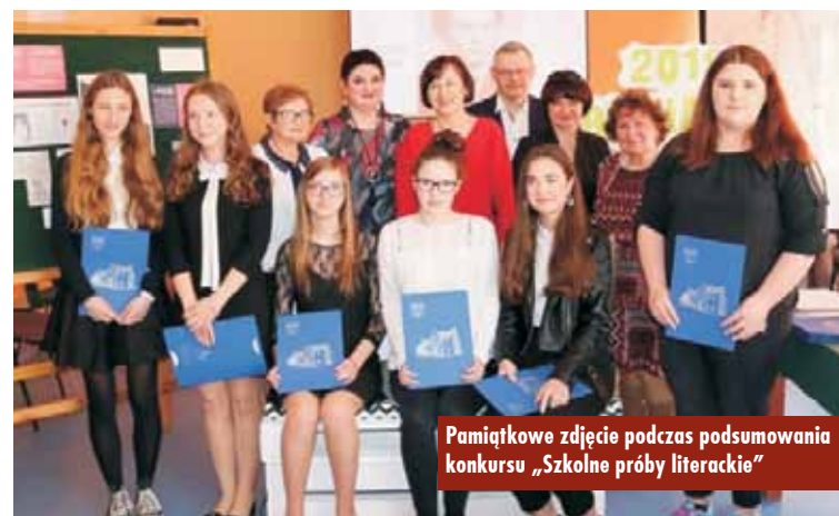
Pamiątkowe zdjęcie podczas podsumowania konkursu „Szkolne próby literackie”

Na XVIII edycję konkursu swoje prace nadesłało 15 uczestników. Na literacki apel odpowiedziała młodzież z Liceum Ogólnokształcącego nr 1 im. mjr Henryka Sucharskiego w Kępnie, Zespołu Szkół Ponadgimnazjalnych nr 2 oraz Zespołu Szkół Ponadgimnazjalnych nr 1 w Kępnie. Każdy z młodych twórców występował pod pseudonimem. Powołane przez organizatorów jury czytało więc zakodowane utwory. Nad uczestnikami - od pierwszej edycji konkursu - czuwa opiekunka poezji