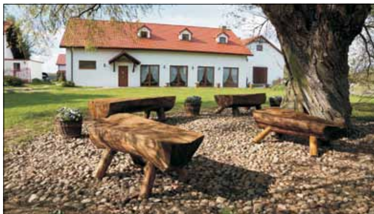
Osada Babia Góra - laureat konkursu

i bogata tradycja, będąca mieszkanką wielu oryginalnych kultur. Przedsiębiorczość zaś jest wpisana w naturę mieszkańców naszego regionu. Ciekawym nowym zjawiskiem w agroturystyce jest to, iż nie tylko specjaliści w niej naturalni spadkobiercy dawnych wiejskich gospodarstw, czy zawodów świadczących usługi dla wsi np. młynarzy lub karczmarzy. Wiele przybyszów „z zewnątrz” widzi na wsi dla siebie niepowtarzalną szansę. Często to ważny wybór życiowy, porzucenie żywiołu miejskiego, na rzecz wiejskiej sielskości i zacisza. Wnoszą oni do lokalnej społeczności dużą dozę aktywności. Ta dynamika musi zagrać z przeświadczeniem, iż warto się pokazywać światu ze swoją kulturą i obyczajowością, by ten świat do konkretnego zakątka przyjechał i w nim „nadmierzają się zakochać”.