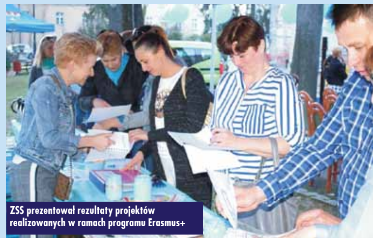
ZSS prezentował rezultaty projektów realizowanych w ramach programu Erasmus+

Wśród gości nie zabrakło, oczywiście, uczniów placówki wraz z rodzicami oraz mieszkańców Kępna.