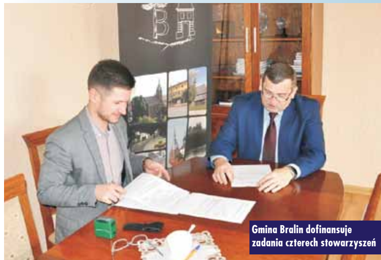
Gmina Bralin dofinansuje zadania czterech stowarzyszeń

Parafia rzymskokatolicka św. Anny w Bralinie otrzyma 4.260 zł na realizację zadania publicznego pt. „W mieście, gdzie nie tylko pierniki są słynne”. W jego ramach przewidziano wyjazd około 40-osobowej