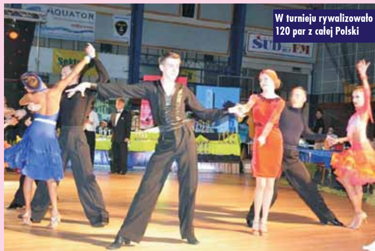
W turnieju rywalizowało 120 par z całej Polski