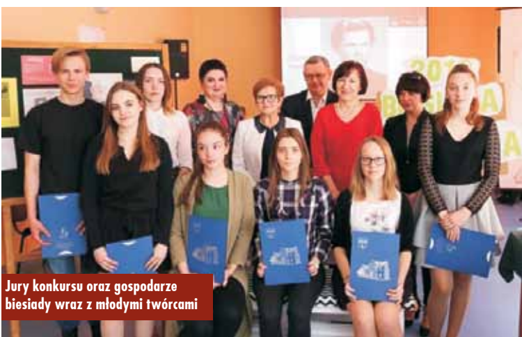
Jury konkursu oraz gospodarze biesiady wraz z młodymi twórcami

Zespół Szkół Specjalnych w Słupi pod Kępem wspólnie ze Starostwem Powiatowym zorganizował obchody Światowego Dnia Świadomości Wiedzy o Autyzmie