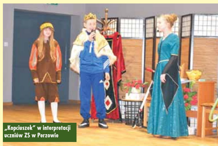
„Kopciuszek” w interpretacji uczniów ZS w Perzowie

Brawom nie było końca, obydwie grupy stanęły na wysokości zadania. Ciekawe scenariusze, scenografia i warsztat aktorski młodych adeptów sztuki teatralnej zdecydowały o bardzo wysokim poziomie przedstawień. Aktorzy okazali się być świetnie przygotowani do swoich ról, więc nie wybrano najlepszego aktora, ponieważ każdy z występujących na scenie zasługiwał na nagrodę. Grupy teatralne zostały nagrodzone pamiątkowymi statuetkami, dyplomami oraz słodyczami.