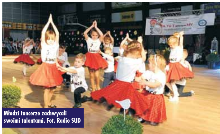
Młodzi tancerze zachwycali swoimi talentami.

nizatorem był Uczniowski Klub Sportowy „ATUT” oraz Kępiński Ośrodek Kultury.