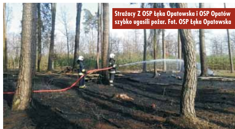
Strażacy z OSP Łęka Opatowska i OSP Opatów szybko ugasili pożar.

ła ugaszona przez właściciela. Skutkiem tego doznał poparzenia prawej ręki – informują druhowie. Strażacy przystąpili do udzielenia poszkodowanemu kwalifikowanej pomocy