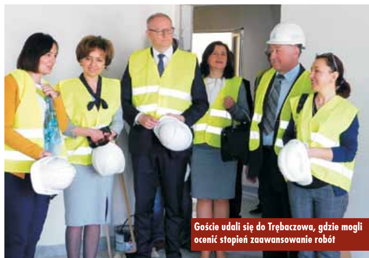
Goście udali się do Trębaczowa, gdzie mogli ocenić stopień zaawansowania robót