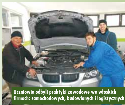
Uczniowie odbyli praktyki zawodowe we włoskich firmach: samochodowych, budowlanych i logistycznych