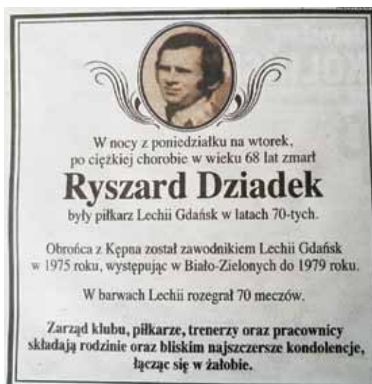
Nekrolog w „Przeglądzie Sportowym” z dnia 16 kwietnia 2018