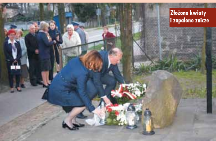
Złożono kwiaty i zapalono znicze

Wszystkich poległych uczczono dźwiękiem strażackich syren oraz minutą ciszy. ap