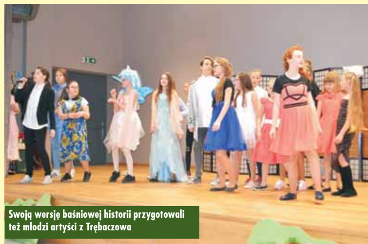
Swoją wersję baśniowej historii przygotowali też młodzi artyści z Trębaczowa