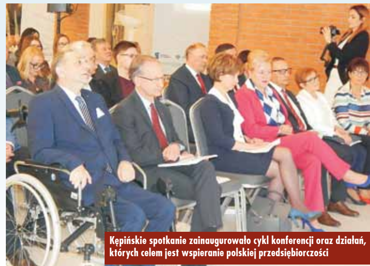
Kępińskie spotkanie zainaugurowało cykl konferencji oraz działań, których celem jest wspieranie polskiej przedsiębiorczości

formy wymiany informacji o wsparciu, na jakie mogą liczyć firmy i samorząd, planując dalszą ekspansję. Założeniem była prezentacja dostępnych form pomocy dla nowo powstających podmiotów oraz możliwości pozyskania środków na realizację innowacyjnych projektów, a także zwiększenie efektywności wykorzystania środków Unii Europejskiej przez polskich przedsiębiorców. – Jako pełnomocnikowi rządu do spraw małych i średnich przedsiębiorstw szczególnie bliska jest mi tematyka związana z możliwościami rozwoju działalności gospodarczej firm, w tym dotycząca możliwości zwiększenia skali działalności – powiedziała minister A. Możdżanowska. – Mam świadomość trudności, jakie związane są z bieżącą działalnością przedsiębiorstw i uważam,