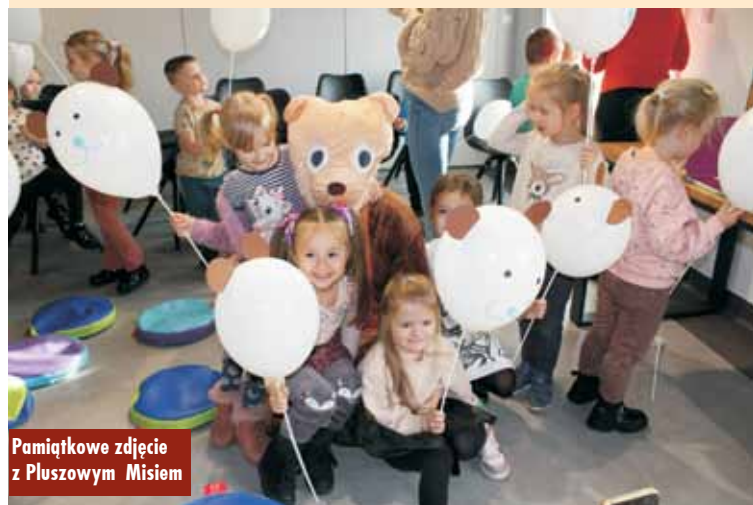
Pamiątkowe zdjęcie z Pluszowym Miśsiem