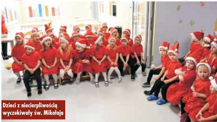
Dzieci z niecierpliwością wyczekiwały św. Mikołaja

6 grudnia 2023 r. w Publicznym Przedszkolu Samorządowym w Laskach, Publicznym Przedszkolu Samorządowym w Trzcinicy oraz Gminnym Żłobku w Trzcinicy od-