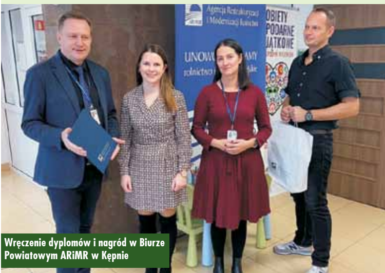
Wręczenie dyplomów i nagród w Biurze Powiatowym ARiMR w Kępnie

cą etapu powiatowego było Koło Gospodyń Wiejskich w Sadogórze z potrawą pn. „Paprykarz”, które uczestniczyło w finale konkursu w Marszewie na III Pikniku Wielkopolskich Kobiet Gospodarnych i Wyjątkowych.