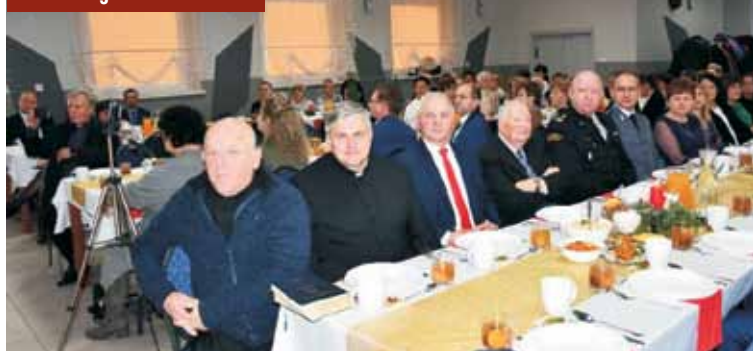
Podczas wigilii w Biadaszkach