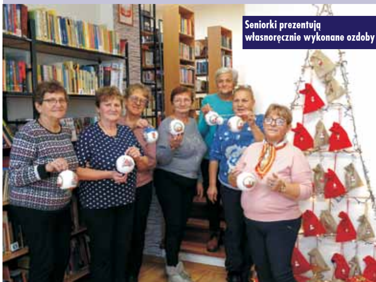
Seniorki prezentują własnoręcznie wykonane ozdoby

Seniorzy przygotowywali ozdoby choinkowe