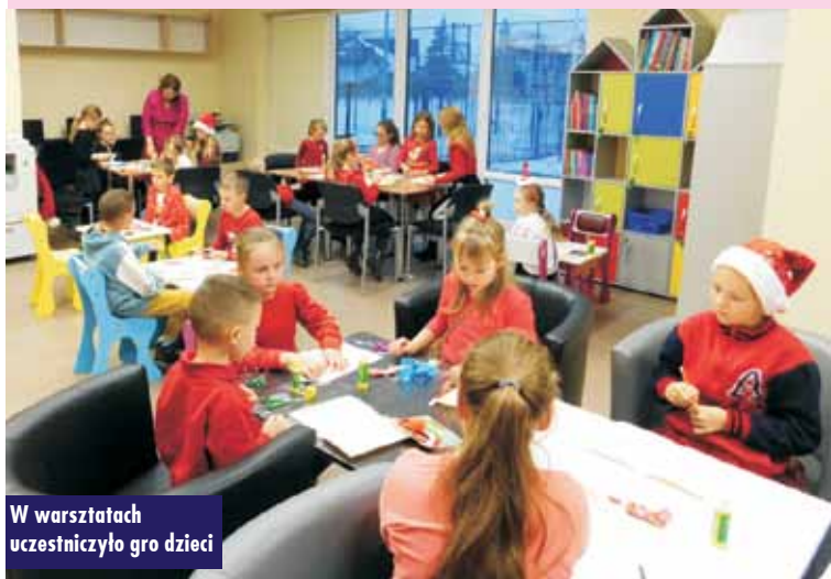
W warsztatach uczestniczyło gro dzieci

utworu literackiego odbyły się zajęcia warsztatowe, podczas których dzieci tworzyły uśmiechniętych Mikołajów z papierowych talerzyków. Dodatkowo każde dziecko otrzymało zastaw materiałów i ozdób do stworzenia kartki świątecznej, którą zabrały ze sobą do domu. Oprac. m