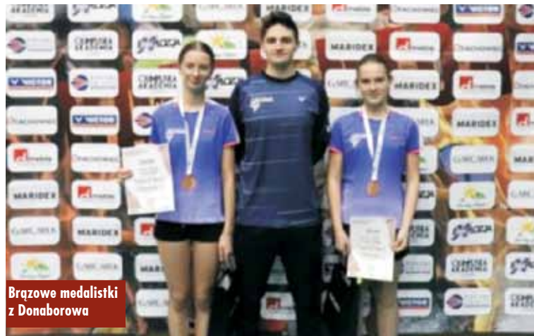
Brązowe medalistki z Donaborowa

3 grudnia 2023 r. w sali gimnastycznej Zespołu Szkół w Trzcinicy odbył się Turniej Tenisa Stołowego o Puchar Wójta Gminy Trzcinica