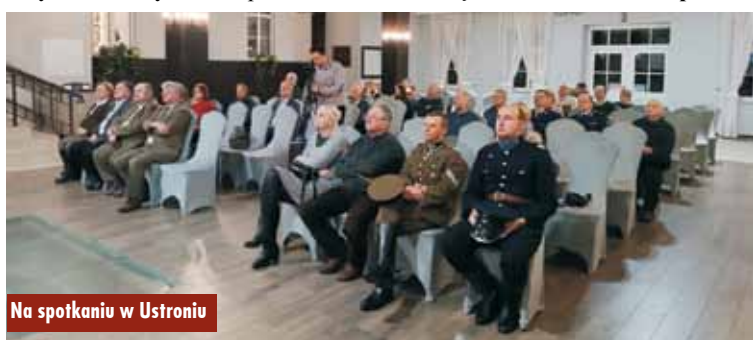
Na spotkaniu w Ustroniu