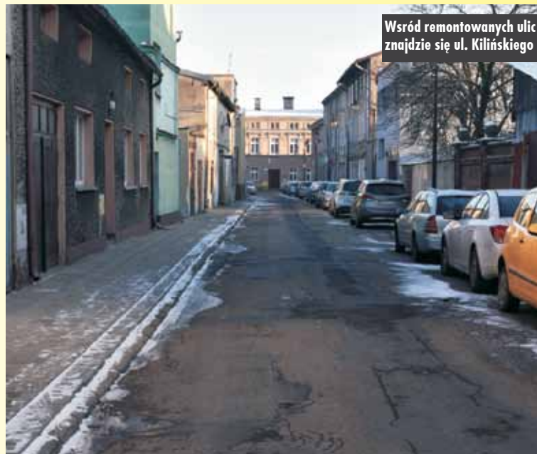
Wśród remontowanych ulic znajduje się ul. Kilińskiego

- Rewitalizacja tego obszaru pozwoli na likwidację barier architektonicznych. Dostosowanie przestrzeni do potrzeb osób ze specjalnymi potrzebami ułatwi dostępność do tego obszaru i instytucji. Ponadto realizacja inwestycji zwiększy walory estetyczne centrum miasta, przywróci dawną, historyczną świetność, umożliwi pełniejsze wykorzystanie potencjału tego miejsca i pozytywnie