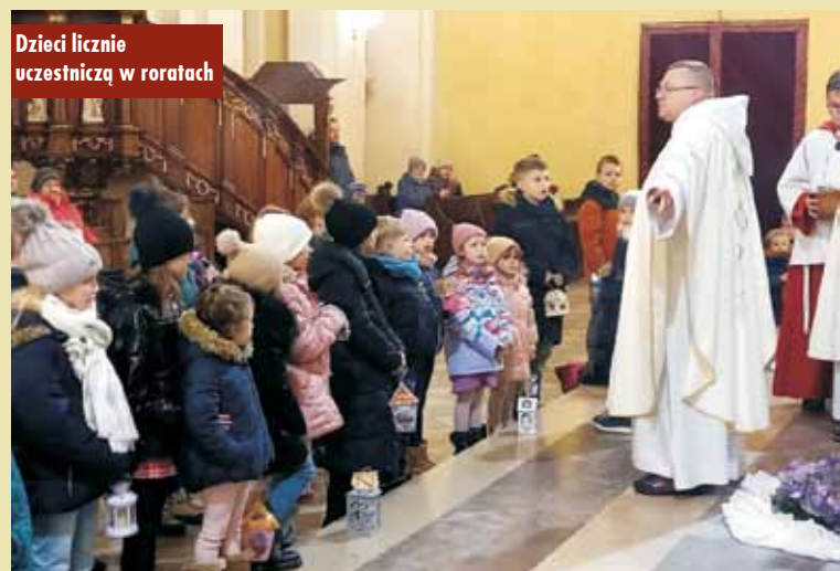
Dzieci licznie uczestniczą w roratach