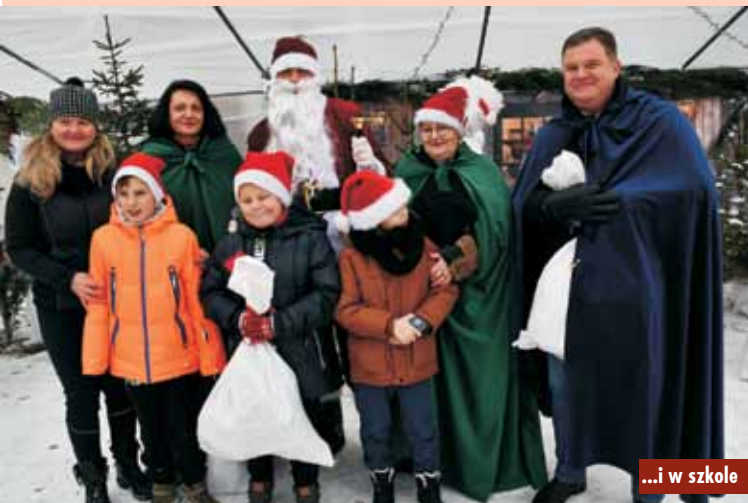
...i w szkole

1 grudnia br. podpisana została umowa na wykonanie ul. Małcużyńskiego w Kępnie