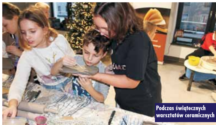
Podczas świątecznych warsztatów ceramicznych

Światowy Dzień Pluszowego Misia w Gminnej Bibliotece Publicznej w Baranowie