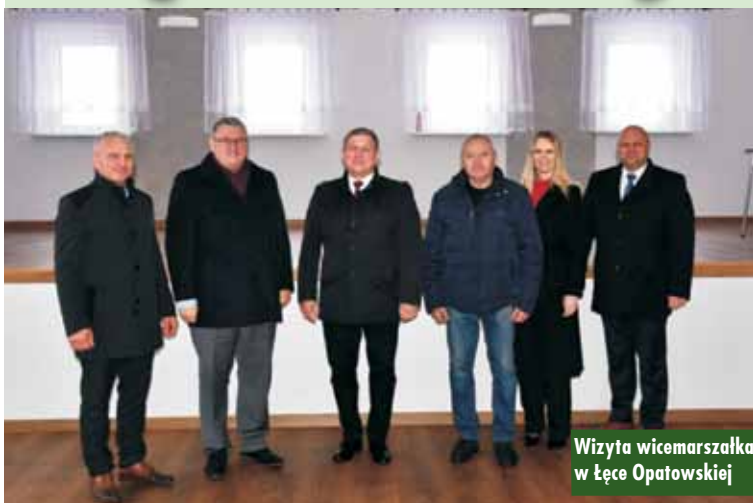
Wizyta wicemarszałka w Łęce Opatowskiej

Wizyta wicemarszałka Krzysztofa Grabowskiego związana była z zakończonymi inwestycjami, współfinansowanymi przez Samorząd Województwa Wielkopolskiego. W trakcie wizyty podsumowano inwestycje realizowane w gminie: „Przebudowa drogi gminnej ul. Parkowa w Łęce Opatowskiej”, „Rozwój i wspieranie aktywności mieszkańców poprzez poprawę bazy lokalowej – remont zaplecza sanitarnego w budynku sali wiejskiej OSP w Łęce Opatowskiej”,