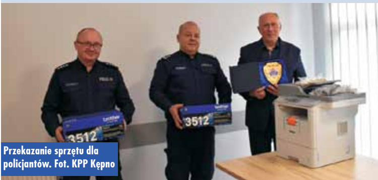
Przekazanie sprzętu dla policjantów.

Wędkarze z tutejszego koła wędkarskiego zarybili jeden ze stawów Morka