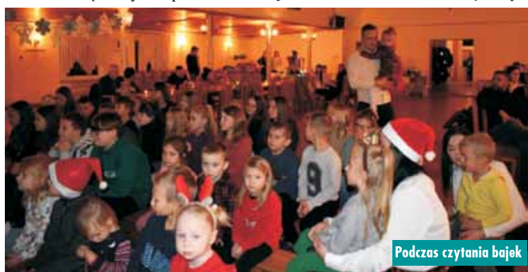
Podczas czytania bajek

Dzieci z przejęciem słuchały kolejnych opowieści, wyobrażając sobie opisywane w nich magiczne postacie i wydarzenia. Nie zabrakło też wyjątkowego gościa – świętego Mikołaja, który zmęczony długą podróżą zasiadł wygodnie w fotelu, by na chwilę odpocząć przed wręczeniem prezentów. Nim to nastąpiło, dzieci spróbowały jeszcze swoich sił, uczestnicząc w qu-