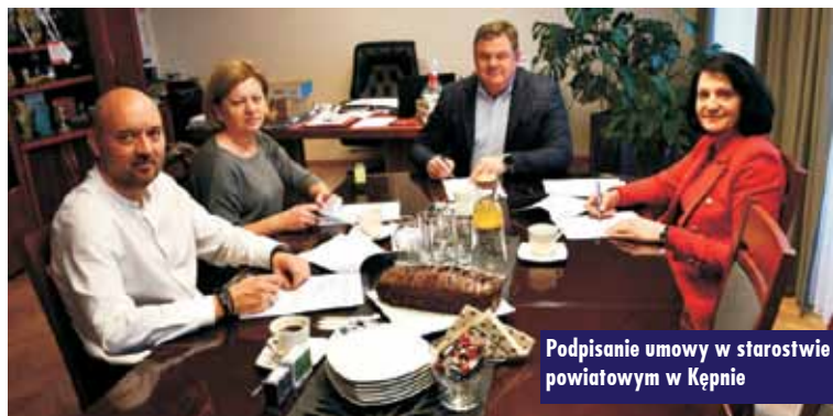
Podpisanie umowy w starostwie powiatowym w Kępnie

Realizacja przedsięwzięcia pn. „Wyposażenie sal dydaktycznych w szkoły w sprzęty i pomoce dydaktyczne oraz zakup mobilnego sprzętu do prowadzenia edukacji ekologicznej w gminie Kępno”