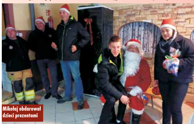
Mikołaj obdarował dzieci prezentami

towa. Dzięki jego inicjatywie grupa członków Koła Gospodyń Wiejskich i Ochotniczej Straży Pożarnej w Chojęcinie zebrała kilka najpotrzebniejszych rzeczy, trochę środków czystości, słodczy, zabawek i zawiozła je do podopiecznych Domu Dziecka. Każdego roku koordynatorka