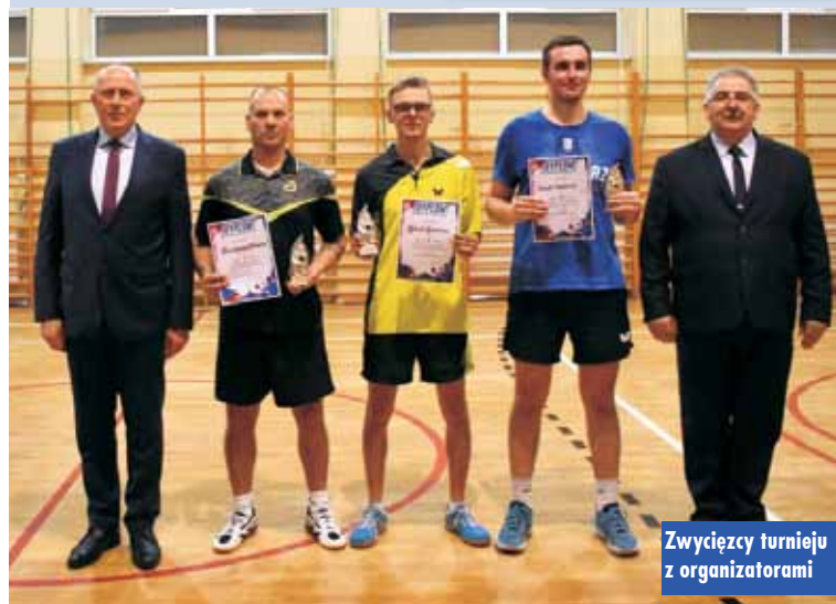
Zwycięzcy turnieju z organizatorami