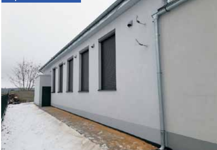
Docieplona remiza OSP Trzebień

Drodzy Czytelnicy, „Tygodnik Kępiński” można znaleźć także w internecie. Serdecznie zapraszamy na stronę www.tygodnikkepinski.pl oraz na Facebook pod adres www.facebook.com/tygodnikkepinski