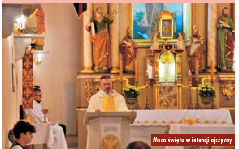
Msza święta w intencji ojczyzny