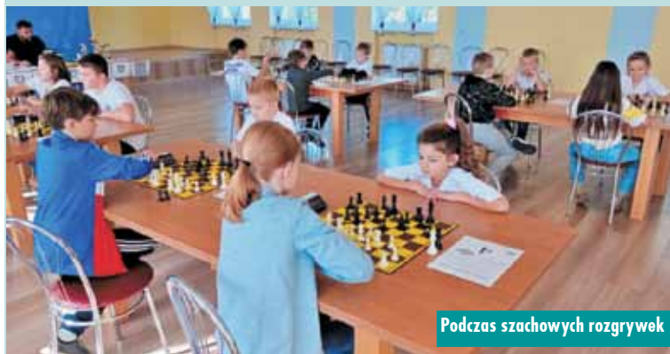
Podczas szachowych rozgrywek