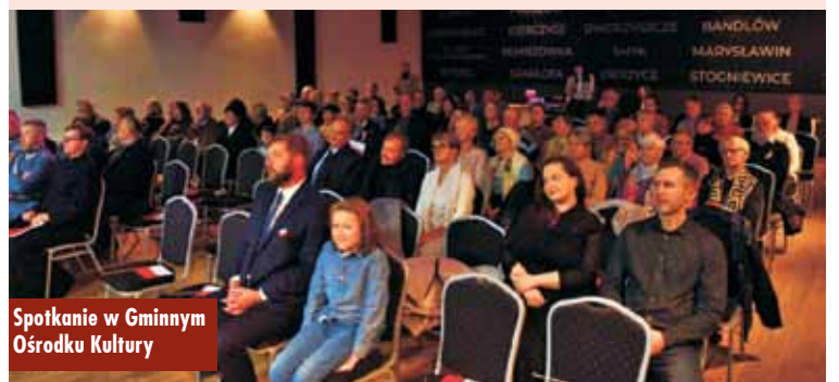
Spotkanie w Gminnym Ośrodku Kultury

Przed koncertem kwartetu smyczkowego odśpiewano hymn