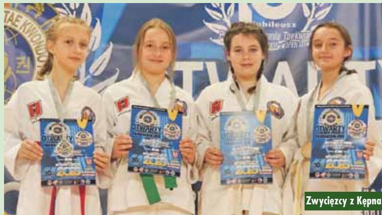
Zwycięzcy z Kępna