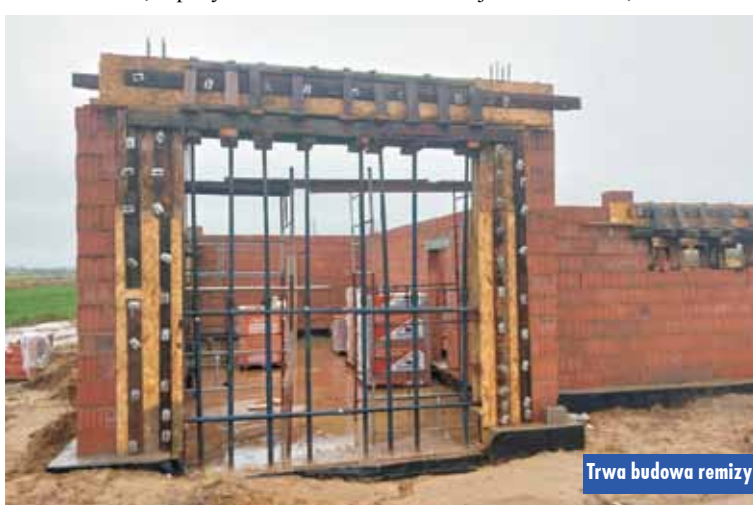
Trwa budowa remizy

Wśród licznych projektów samorządowcy realizują modernizację stacji uzdatniania wody w Trębaczowie, w ramach której powstaje budynek garażowo-magazynowy, zbiornik wody czystej o poj. 150 m 3 , a budynek stacji zostanie wyposażony w nowe urządzenia do uzdatniania i dystrybucji wody. Całkowita wartość inwestycji to 3.725.055 zł, a pozyskane dofinansowanie to kwota 2.450.000 zł. Wykonawcą jest firma Proinvest z Rawicza. Planowany termin zakończenia prac to październik 2024 r.