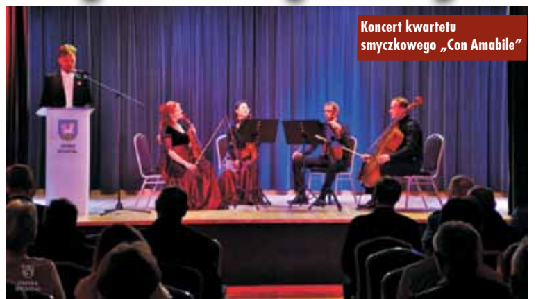
Koncert kwartetu smyczkowego „Con Amabile”

11 listopada br. w gminie Rychtal był dniem pełnym patriotyzmu i szacunku dla historii Polski. Bogaty program obchodów Święta Niepodległości zgromadził mieszkańców, a każde wydarzenie było okazją do wyrażenia miłości do ojczyzny.