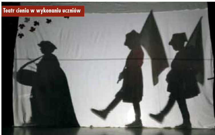
Teatr cienia w wykonaniu uczniów