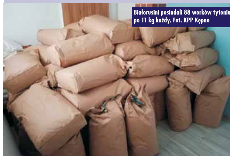
Białorusini posiadali 88 worków tytoniu po 11 kg każdy.

Niepodległościowy Apel Pamięci w Szkole Podstawowej im. Jana Pawła II w Mikorzynie