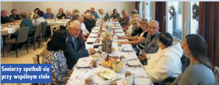
Seniorzy spotkali się przy wspólnym stole