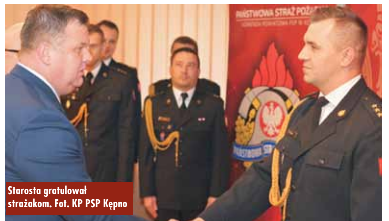
Starosta gratulował strażakom.