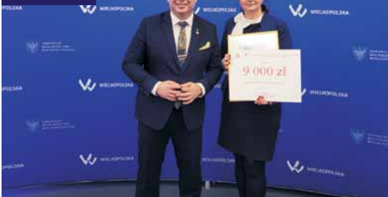
Pamiątkowe zdjęcie po wręczeniu nagrody

Dla laureatów tegorocznego konkursu przewidziane zostały nagrody finansowe, w zależności od oceny danego projektu, ufundowane przez Samorząd Województwa Wielkopolskiego. Projekt biblioteki w Trzcinicy pt. „Kulturowe warsztaty ekologiczne” został nagrodzony w kategorii działań proekologicznych i uzyskał nagrodę w wysokości 9000 zł. Warsztaty ekologiczne w ramach nagrodzonego