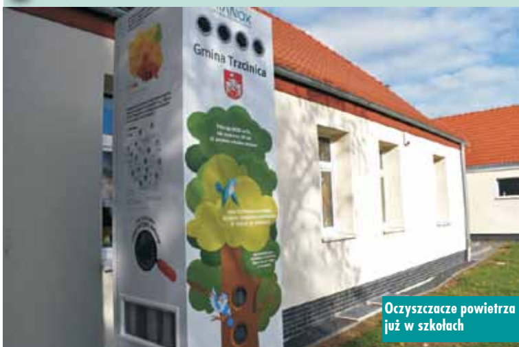
Oczyszczacze powietrza już w szkołach

W Zespole Szkół w Laskach oraz Zespole Szkół w Trzcinicy zamontowane zostały stacje uzdatniania powietrza atmosferycznego w ramach przedsięwzięcia „Program Gminy Trzcinica – jak walczyć ze smogiem”. Realizatorem zadania była Agencja Wspierania Ochrony Środowiska Sp. z o.o w Poznaniu. Wartość całkowita zadania to 86 100 zł brutto.