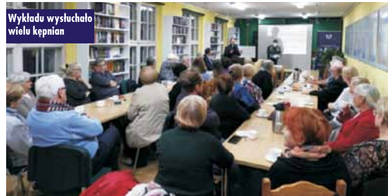
Wykładu wysłuchało wielu kępnian

Wydarzenia były częścią projektu realizowanego przez Powiatową Bibliotekę Publiczną w Kępnie pn. „Z