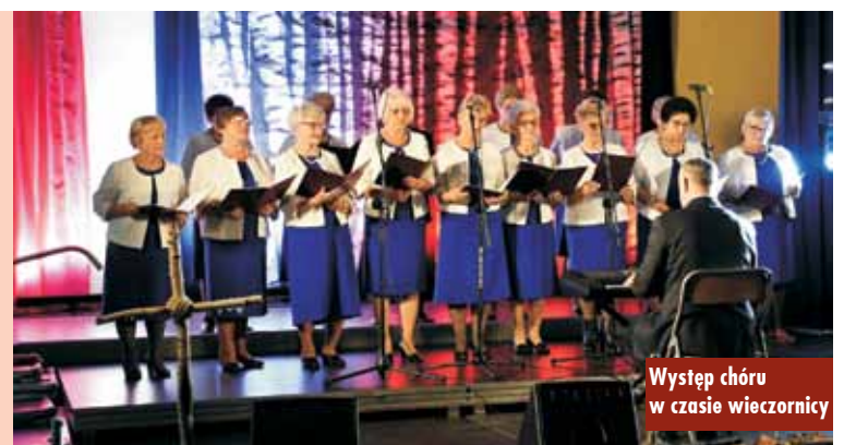
Występ chóru w czasie wieczornicy

W przeddzień święta niepodległości w hali sportowej Zespołu Szkół Ponadpodstawowych nr 1 w Kępnie