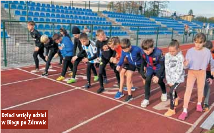
Dzieci wzięły udział w Biegu po Zdrowie