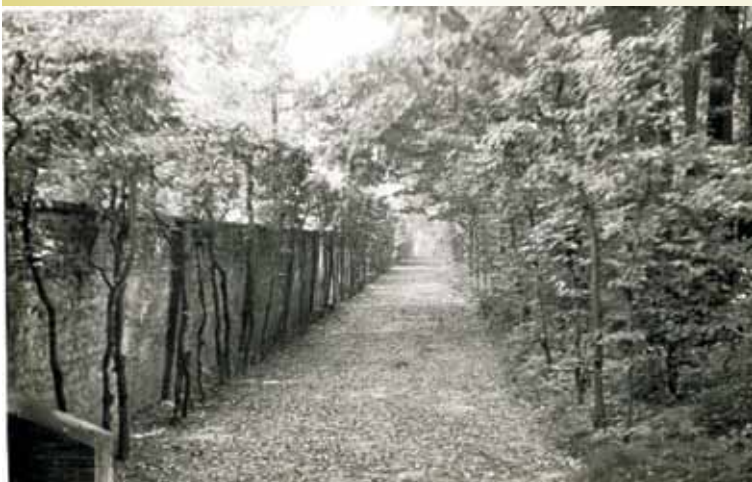
Aleja strzyżonego graba; 1983 r.