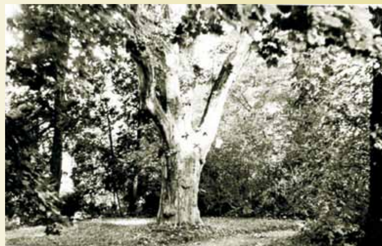
Okazały platan o cechach pomnika; 1983 r.