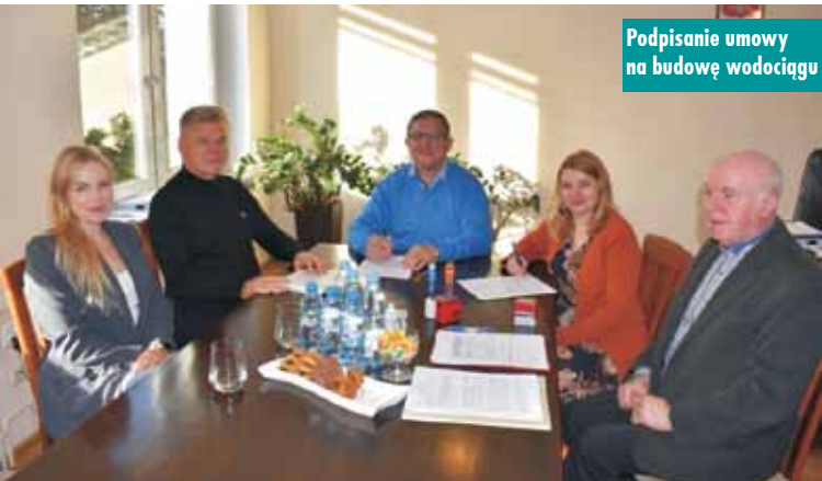
Podpisanie umowy na budowę wodociągu

Zakres prac obejmuje wykonanie sieci wodociągowej o długości 464 m wraz z uzbrojeniem sieci i przyłączami wodociągowymi. Oprac. m