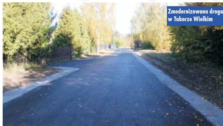
Zmodernizowana droga w Taborze Wielkim

Zakończona została przebudowa drogi gminnej w miejscowości Tabor Wielki. W ramach tego przedsięwzięcia został zmodernizowany odcinek drogi o długości 181 m. Wykonawcą przebudowy drogi było Przedsiębiorstwo Handlowo-Usługowe „LARIK”, które zrealizowało zadanie za kwotę 315.490,00 zł. Inwestycję zrealizowano przy udziale środków w wysokości 173.750,00 zł, pochodzących z Urzędu Marszałkowskiego w ramach programu „Budowa (przebudowa) dróg dojazdowych do gruntów rolnych”. Oprac. KR