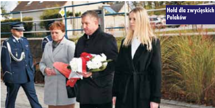
Hołd dla zwyciężkich Polaków

cach odprawiono mszę świętą w intencji ojczyzny. Po nabożeństwie, w miejscach pamięci narodowej, zostały złożone wiązanki kwiatów oraz zapalono znicze. Po oddaniu hołdu i złożeniu kwiatów uczestnicy obchodów udali się do sali gimnastycznej Szkoły Podstawowej im. Kardynała Stefana Wyszyńskiego w Opatowie na spektakl pod tytułem „Kto Ty jesteś?...”.