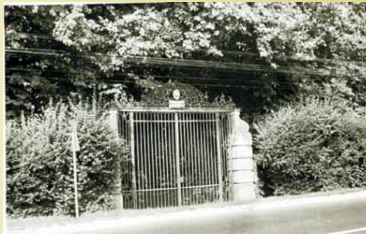
Dawna, główna brama wjazdowa; 1983 r.