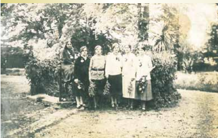
Park; 1939 r.