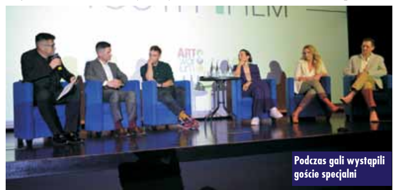
Podczas gali wystąpili goście specjalni