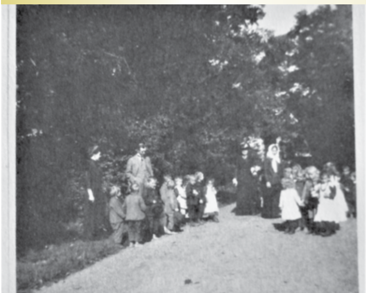
Ochronka dzieci w parku; ok. 1930 r.

Powierzchnia parku w Siemianicach wynosi 4,49 ha, a jego drzewostan jest bardzo bogaty i urozmaicony. Początki istnienia parku datowane są na pierwszą połowę XVIII w., zaś powstanie w nim pierwszych dróg dojazdowych do pałacu szacowane jest na drugą połowę XIX w. Najstarsze obecnie drzewa parku liczą sobie około 250 lat. Według danych z końca lat 70. ubiegłego stulecia, roślinność parku to 181 gatunków oraz odmian drzew i krzewów, a z tego niemal 50 drzew o cechach pomnikowych.