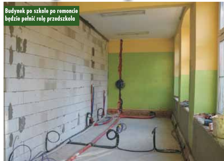
Budynek po szkole po remoncie będzie pełnić rolę przedszkola

Generalnym wykonawcą robót jest Korporacja BUDONIS Sp. z o.o z Kępna. Wartość inwestycji wynosi 1.225.000 zł. Oprac. KR