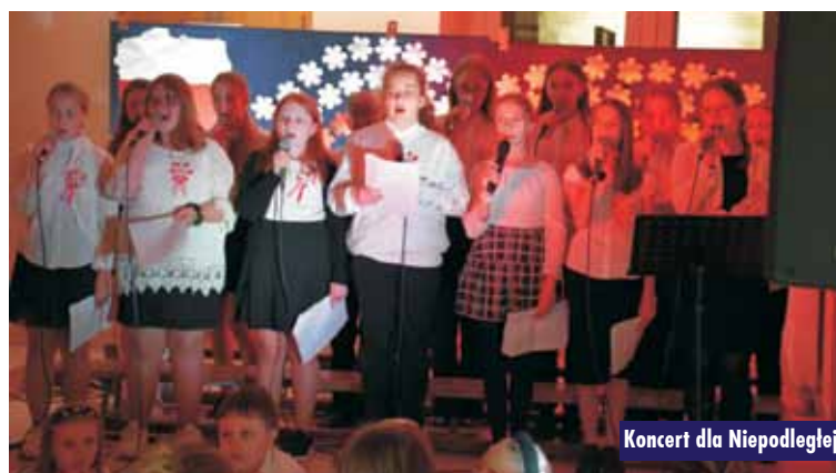
Koncert dla Niepodległej

Gminne uroczystości Narodowego Święta Niepodległości kontynuowano 10 listopada br. W tym dniu w kościele parafialnym w Siemiani-