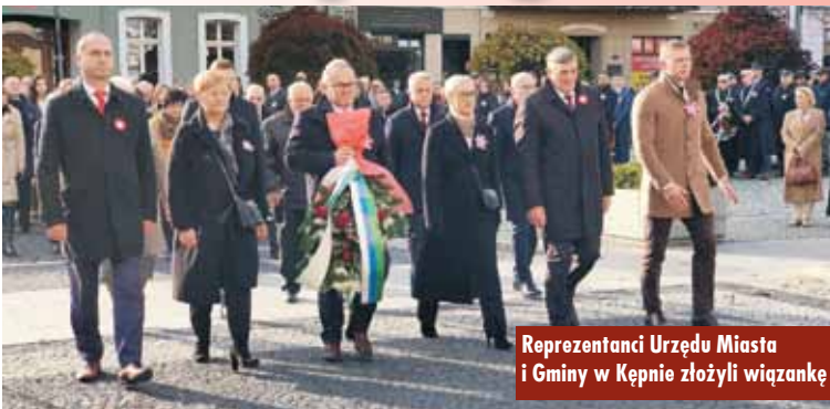
Reprezentanci Urzędu Miasta i Gminy w Kępnie złożyli wiązkę

11 listopada br., dla uczczenia Narodowego Święta Niepodległości, upamiętniającego odrodzenie wolnej Polski po 123 latach przebywania pod zaborami, delegacje władz samorządowych, instytucji i organizacji oddały hołd oraz złożyły symboliczne wiązkę kwiatów pod Pomnikiem „Bohaterów Walk o Wolność i