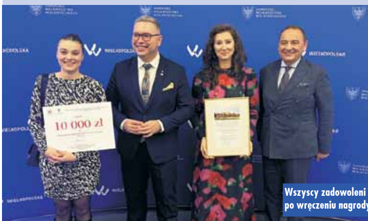
Wszyscy zadowoleni po wręczeniu nagrody

„Działania proekologiczne i prokulturowe w ramach strategii rozwoju województwa wielkopolskiego”. W trakcie wydarzenia dyrektor kępiń-