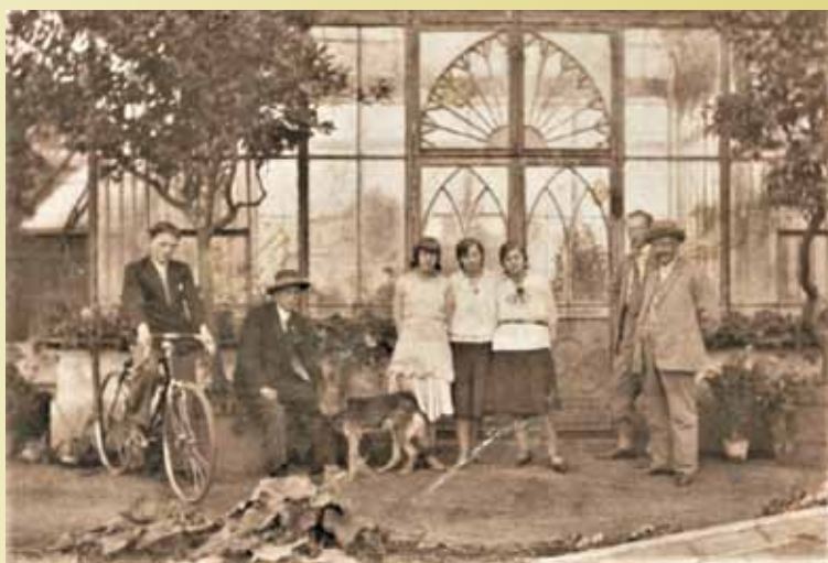
Oranżeria; 1931 r.