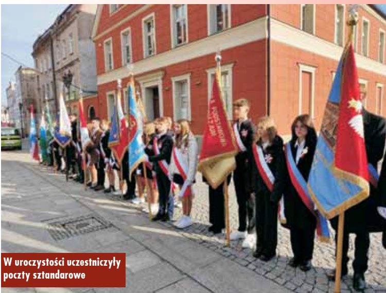
W uroczystości uczestniczyły poczty sztandarowe

Drodzy Czytelnicy, „Tygodnik Kępiński” można znaleźć także w internecie. Serdecznie zapraszamy na stronę www.tygodnikkepinski.pl oraz na Facebook pod adres www.facebook.com/tygodnikkepinski