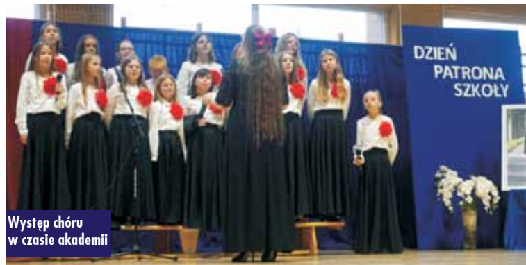
Występ chóru w czasie akademii