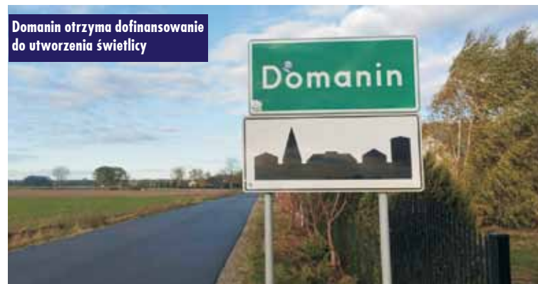
Domanin otrzyma dofinansowanie do utworzenia świetlicy

W ramach tegorocznej edycji konkursu złożono 186 projektów, które zostały ocenione pod względem formalnym i merytorycznym. Zgodnie z regulaminem konkursu