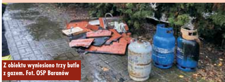
Z obiektu wyniesiono trzy butle z gazem.

znajdowała się płonąca butla z gazem propan-butan. Następnie z budynku wyniesiono trzy butle z gazem – relacjonuje kpt. Jakub Sobczak z KP PSP Kępno.