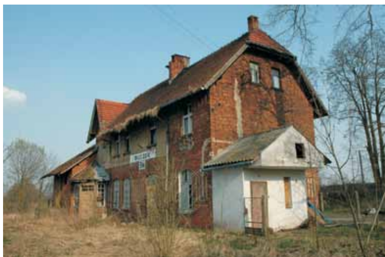
Wielki Buczek – budynek dworca