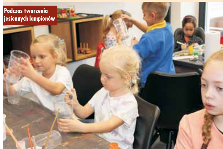
Podczas tworzenia jesiennych lampionów