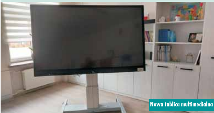
Nowa tablica multimedialna

Zakończono inwestycje modernizacji dróg w gminie