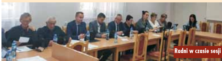
Radni w czasie sesji

Straży Pożarnych z terenu gminy Perzów. Ekwiwalent ustalony został w wysokości minimalnej stawki godzinowej, czyli 23,50 zł brutto. Ponadto za udział w szkoleniu wynagrodzenie wynosi 10,00 zł za każdą rozpoczętą godzinę, podobnie jak w ochronie ludności i porządku publicznego podczas imprezy publicznej.