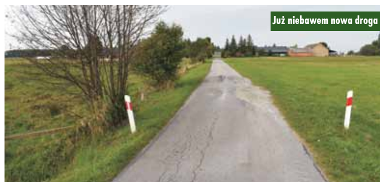
Już niebawem nowa droga

dofinansowania inwestycji z Rządowego Funduszu Polski Ład: Program