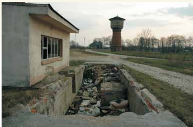
Rychtal – ruina wgi wozowej

dają w ruinę. Nie ma nikogo, kto powinien odpowiadać za utrzymanie stanu technicznego budynków i obiektów technicznych na całej linii. Zwłaszcza w Wielkim Buczku – najbardziej chyba zaniedbanym – gdzie od pięciu lat mieszkańcy nie mają wody (niegdyś była doprowadzona z pobliskiego PGR-u), a piwnice zalewają ścieki. Odnosi się wrażenie, że nikogo nie interesuje los dawnych pracowników