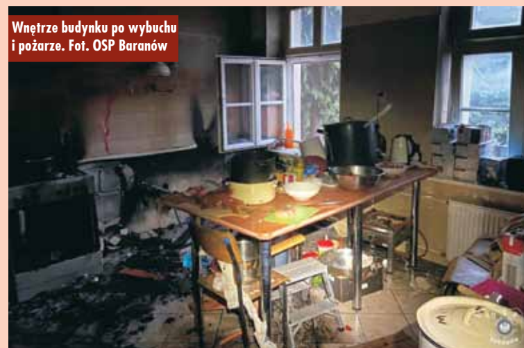
Wnętrze budynku po wybuchu i pożarze.

- Przybyli na miejsce zdarzenia strażacy zastali pożar w jednym z pomieszczeń budynku jednorodzinnego. W wyniku zdarzenia dwie osoby zostały poszkodowane. Działania strażaków polegały na zabezpieczeniu miejsca zdarzenia, odłączeniu zasilania w energię elektryczną oraz ugaszeniu palącego się pomieszczenia, w którym