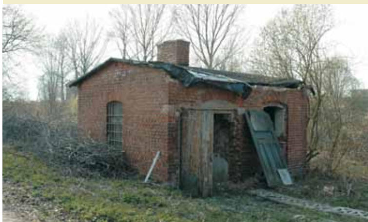
Wielki Buczek – pralnia