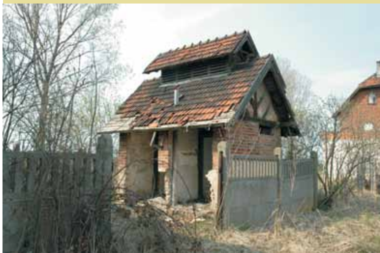
Trzcina – szalec