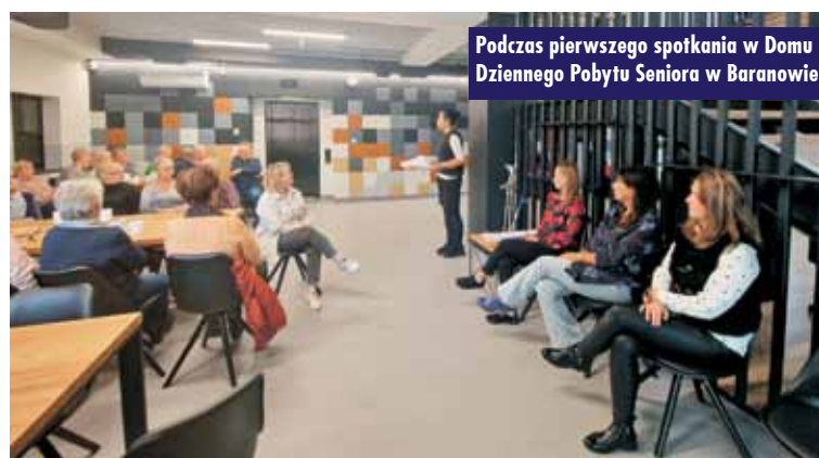
Podczas pierwszego spotkania w Domu Dziennego Pobytu Seniora w Baranowie

Warsztaty dla najmłodszych czytelników w Gminnej Bibliotece Publicznej w Baranowie