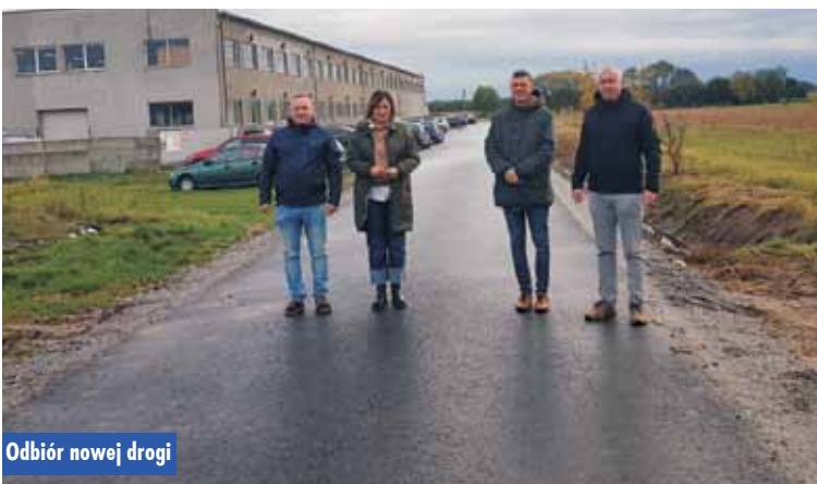
Odbiór nowej drogi