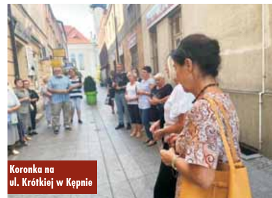
Koronka na ul. Krótkiej w Kępnie

Jest nadzieja, że setki tysięcy wiernych, którzy odmawiają Koronkę, zetkną się z kultem Bożego Miłosierdzia i iskra, o której mówił św. Jan Paweł II, jeszcze bardziej rozpali świat wiary. m