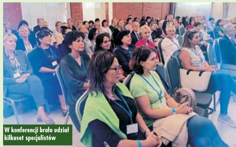
W konferencji brało udział kilkuset specjalistów

Burmistrz zauważył, że zwiększona będzie liczba studentów uczących się na kierunku medycznym Uniwersytetu Kaliskiego. - Dzięki