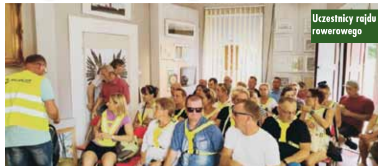
Uczestnicy rajdu rowerowego

W rajdzie wzięło udział wielu mieszkańców sołectwa Pomiany, jak również mieszkańców gminy Trzcinica. Uczestnicy mieli okazję wysłuchać opowieści przewodnika o historii Byczyny, a także zwiedzić