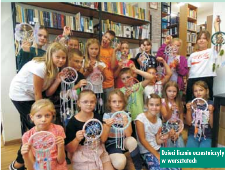
Dzieci licznie uczestniczyły w warsztatach