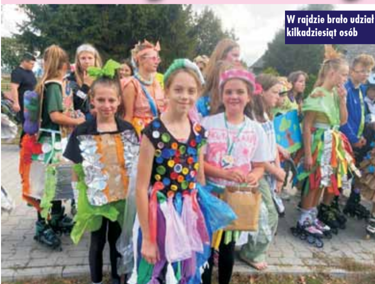
W rajdzie brało udział kilkadziesiąt osób

Rajd rolkowy przebiegał ulicami gminy, wzbudzając duże zainteresowanie mieszkańców, którzy licznie zebrał się przy trasie. Uczestnicy wystartowali z parkingu przy sali sportowej w Łęce Opatowskiej i ruszyli w kierunku miejscowości: Opatów, Trzebień, Biadaszki. Paradę zakończono na placu przy OSP w Trzebień. Rolkarze łącznie pokonali ponad 13 km. Każdy uczestnik rajdu otrzymał pamiątkowe gadżety i eko-medal. Warto podkreślić, że rolkarze całą trasę przejechali w ciekawych strojach, które były przygotowane z wykorzystaniem surowców wtórnych, odpadów przeznaczonych do recyklingu oraz innych ekologicznych materiałów. Nagrodzono także najciekawsze stroje, choć wybór nie