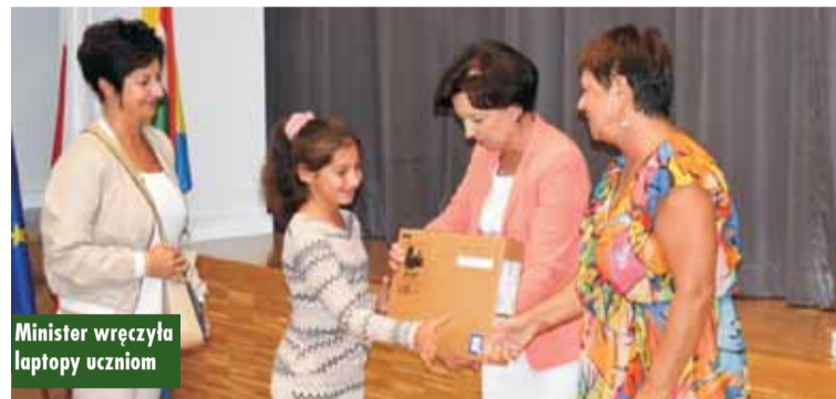
Minister wręczyła laptopy uczniom