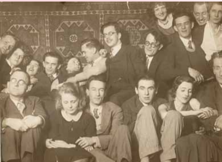
Kapiści w Paryżu, ze zbiorów Muzeum Krakowa

stworzenie czystego, pozbawionego odniesień do literatury i historii, malarstwa, będącego wynikiem kolorystycznych zestawień na płótnie.