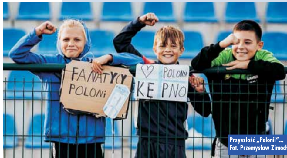
Przyszłość „Polonii”...

28 września br., o godzinie 15.00, na kępińskiej ulicy grupa wiernych odmówiła Koronkę do Bożego Miłosierdzia