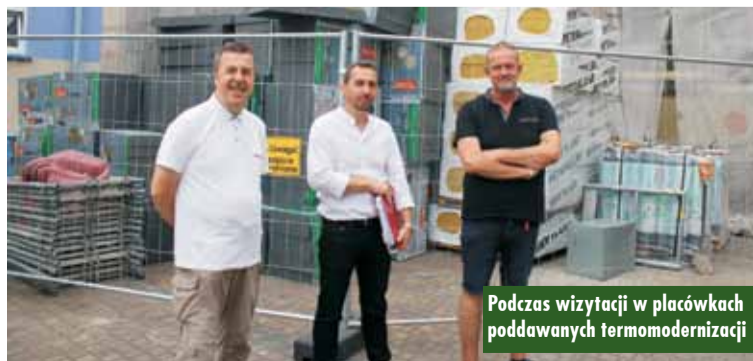
Podczas wizytacji w placówkach poddawanych termomodernizacji

Zadanie dofinansowano z Rządowego Funduszu Polski Ład, Program Inwestycji Strategicznych w kwocie 4.400.000,00 zł. Oprac. KR