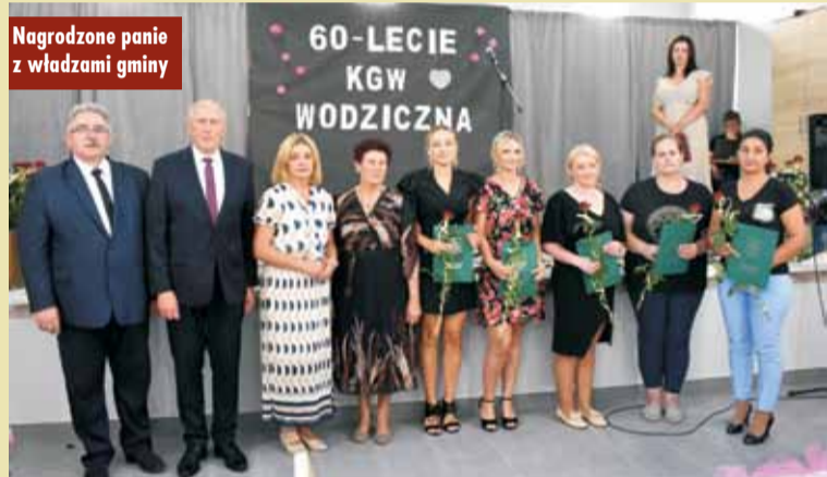
Nagrodzone panie z władzami gminy

Życzenia przekazali też zaproszeni goście oraz delegacje KGW z terenu gminy Trzcينica. Uroczystość uświetnił występ chóru „Laskowia-