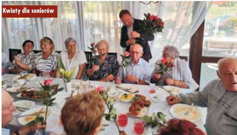
Kwiaty dla seniorów