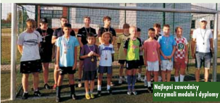
Najlepsi zawodnicy otrzymali medale i dyplomy

W czasie gier koszykarskich zawodnicy indywidualnie doskonalili swoje umiejętności. Dobierając się w pary, prowadzili gry poza klasyfikacją punktową. Dużym zainteresowaniem cieszyły się również gry i zabawy dla dzieci. W obecności rodziców najmłodsi uczestniczyli w różnorod-