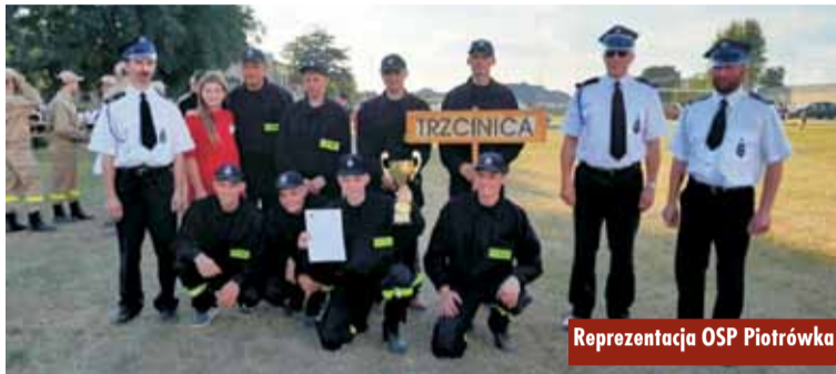
Reprezentacja OSP Piotrówka

10 września 2023 r. na terenie Dworku Myśliwskiego w Ustroniu odbył się Festiwal „Smaki Lasu”, którego organizatorami byli: Stowarzyszenie „Wrota Wielkopolski” oraz Leśny Zakład Doświadczalny w Siemianicach