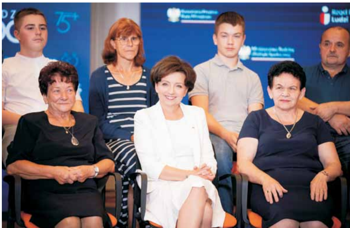
Marlena Małag minister rodziny i polityki społecznej, poseł na Sejm RP podczas konferencji poświęconej płacy minimalnej w 2024 roku oraz emeryturom stażowym

- Po 2015 roku udało nam się wprowadzić wiele reform i nowych projektów, które przywróciły należyta pozycję aktywnym pracownikom i tym, którzy weszli w okres emerytalny. Nasi poprzednicy nie rozumieli, że wsparcie należy rozpocząć od tych, którzy są w najtrudniejszej sytuacji. Zadaniem ministerstwa, którym kieruję, było przywrócenie właściwej równowagi w tym obszarze – mówi minister rodziny i polityki społecznej Marlena Małag, poseł na Sejm RP.