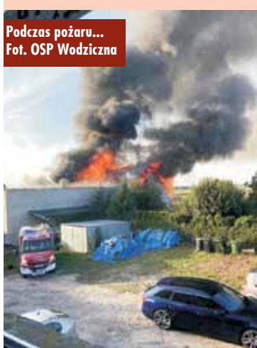
Podczas pożaru...

24 sierpnia br., tuż po godzinie 18.00, do Stanowiska Kierowania Komendanta Powiatowej Państwowej Straży Pożarnej w Kępnie wpłynęło zgłoszenie o pożarze budynku gospodarczego w miejscowości Wodiczna. Na miejsce zdarzenia zadysponowano zastępy z Jednostki Ratowniczo-Gaśniczej w Kępnie, OSP Wodiczna, OSP Laski, OSP Trzcinica, OSP Aniołka Pierwsza, OSP Piotrówka i OSP Opatów. Po dotarciu stwierdzono, że pożarem objęty jest budynek gospodarczy (warsztat samochodowy) w zwartej zabudowie. Jeden z mieszkańców wymagał pomocy medycznej.