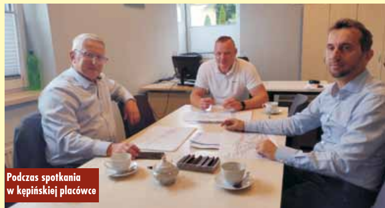
Podczas spotkania w kępińskiej placówce