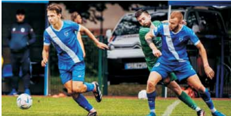
Gracze z Alei Marcinkowskiego nie mają ostatnio zbyt wielu powodów do zadowolenia. Białoniebiescy w dwóch ostatnich meczach stracili aż dziewięć bramek, nie strzelając przy tym ani jednej.

Na koniec dnia Wiara Lecha Poznań przegrała na własnym boisku z Obrą Kościan. Wiara Lecha poniosła pierwszą porażkę w sezonie. Lechici przegrali u siebie z Obrą 2:3. Pojed-