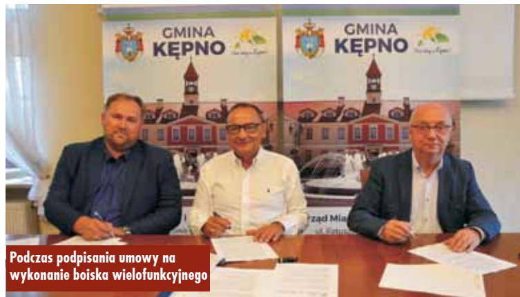
Podczas podpisania umowy na wykonanie boiska wielofunkcyjnego

- Boisko, jako obiekt przyszkolny, przeznaczone będzie na potrzeby uczniów w ramach zajęć sportowych i rekreacyjnych. Poza tym boisko bę-