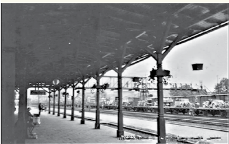
Kluczbork (Kreuzburg). Transport kolejowy sprzętu do granicy w pobliżu Namysłowa i Byczyny. Sierpień 1939 r.