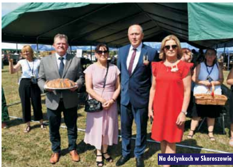
Na dożynkach w Skoroszowie