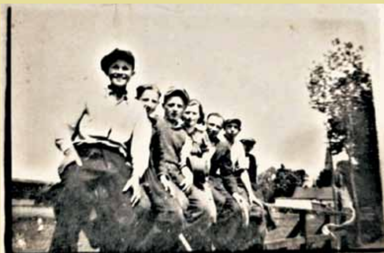
Most w Opatowie, który wysadzono 1 września 1939 r. W tle dzwonnica służąca Polakom za punkt obserwacyjny

nej i na plebani. Ciężkie karabiny maszynowe szwadronu ustawiono przy kościele i przy skrzyżowaniu dróg w