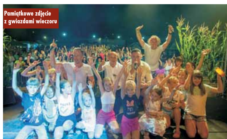
Pamiątkowe zdjęcie z gwiazdami wieczoru