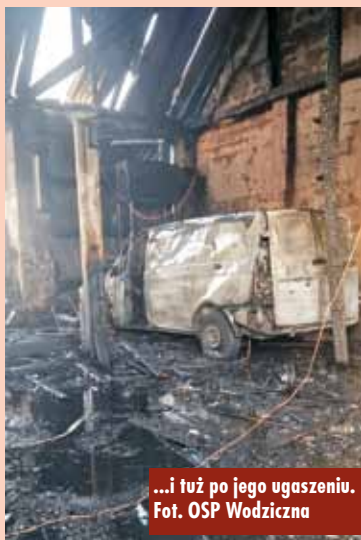
...i tuż po jego ugaszeniu.

24 sierpnia br., tuż po godzinie 18.00, do Stanowiska Kierowania Komendanta Powiatowej Państwowej Straży Pożarnej w Kępnie wpłynęło zgłoszenie o pożarze budynku gospodarczego w miejscowości Wodiczna. Na miejsce zdarzenia zadysponowano zastępy z Jednostki Ratowniczo-Gaśniczej w Kępnie, OSP Wodiczna, OSP Laski, OSP Trzcinica, OSP Aniołka Pierwsza, OSP Piotrówka i OSP Opatów. Po dotarciu stwierdzono, że pożarem objęty jest budynek gospodarczy (warsztat samochodowy) w zwartej zabudowie. Jeden z mieszkańców wymagał pomocy medycznej.