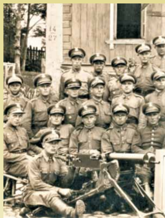
Kawaleria ze swoim ciężkim karabinem maszynowym

Leibstandarte SS Adolf Hitler liczył łącznie 3700 żołnierzy, kilkanaście ciężkich samochodów pancernych, artylerię, karabiny maszynowe oraz wyspecjalizowane pododdziały saperów, łączności i rozpoznania. Jego