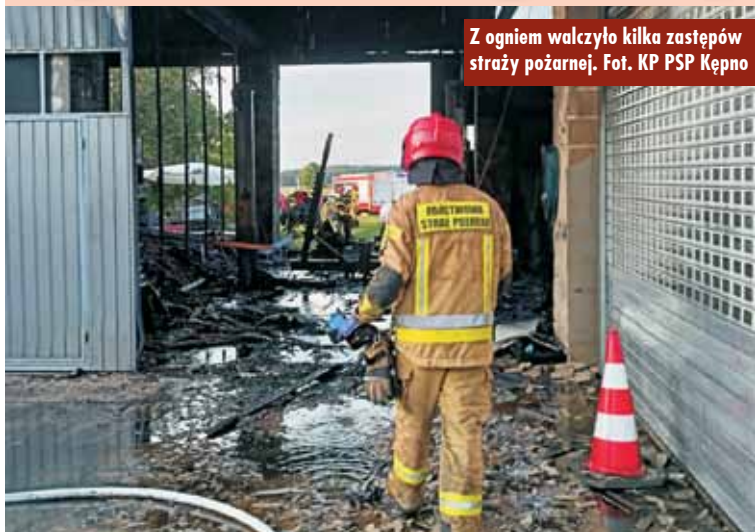
Z ogniem walczyło kilka zastępów straży pożarnej.

- Działania strażaków polegały na zabezpieczeniu miejsca zdarzenia i podaniu łącznie 5 prądów gaśniczych w natarciu na pożar oraz w obronie zabudowań sąsiadujących. Jednocześnie udzielono kwalifikowanej pierwszej pomocy osobie poszkodowanej do czasu przybycia na miejsce zdarzenia Zespołu Ratownictwa Medycznego. Z budynku przewencyjnie ewakuowano butle z gazami technicznymi. Działania gaśnicze doprowadziły do lokalizacji, a następnie całkowitego ugaszenia pożaru – relacjonuje oficer prasowy KP PSP Kępno, kpt. Paweł Michalski.