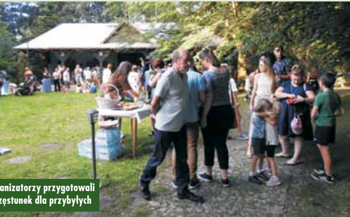
Organizatorzy przygotowali poczęstunek dla przybyłych

ścijańskiej pt. „Ogrody świętego Idziego”. To muzyczno-modlitwne spotkanie już na stałe wpisało się w kalendarz regionu i miało miejsce już po raz dwudziesty drugi.