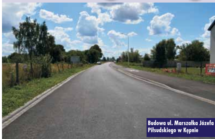
Budowa ul. Marszałka Józefa Piłsudskiego w Kępnie

jest spółka Kępińskie Przedsiębiorstwo Drogowo-Mostowe S.A. Wartość inwestycji wynosi 2.208.060,70 zł. Gmina Kępno uzyskała na to zadanie dofinansowanie w wysokości do 50% z Rządowego Funduszu Rozwoju Dróg. Termin realizacji to 13 października br.