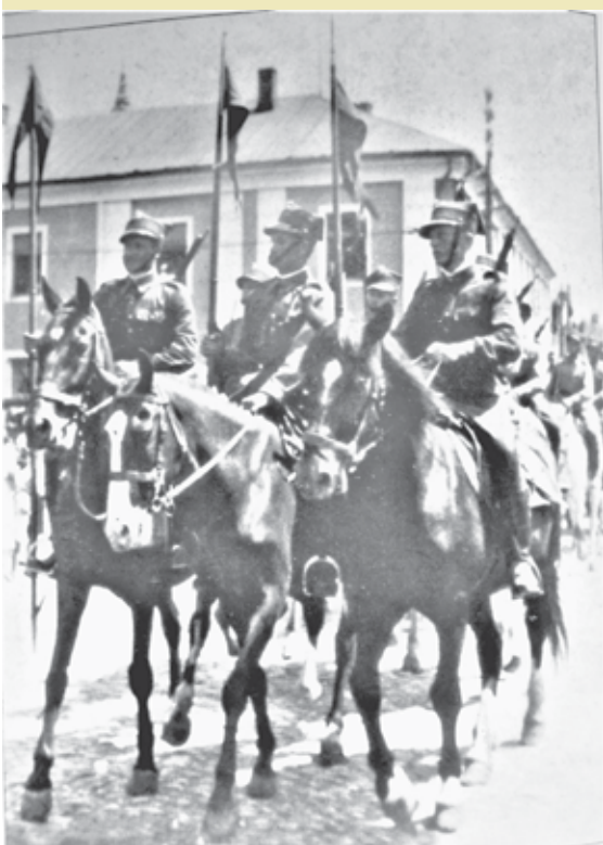
Defilada 1. Pułku Kawalerii KOP w Wieluniu 15 sierpnia 1939 r.

li w budynkach majątku ziemskiego przy parku w Łęce Opatowskiej. W czasie ćwiczeń odbywali strzelania