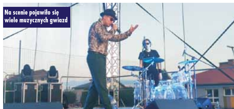
Na scenie pojawiło się wiele muzycznych gwiazd

gli korzystać. Jak zwykle mieszkańcy powiatu i nie tylko, nie odmówili organizatorom i wspaniale się bawili, żegnając tegoroczne lato do późnych godzin wieczornych. Oprac. m