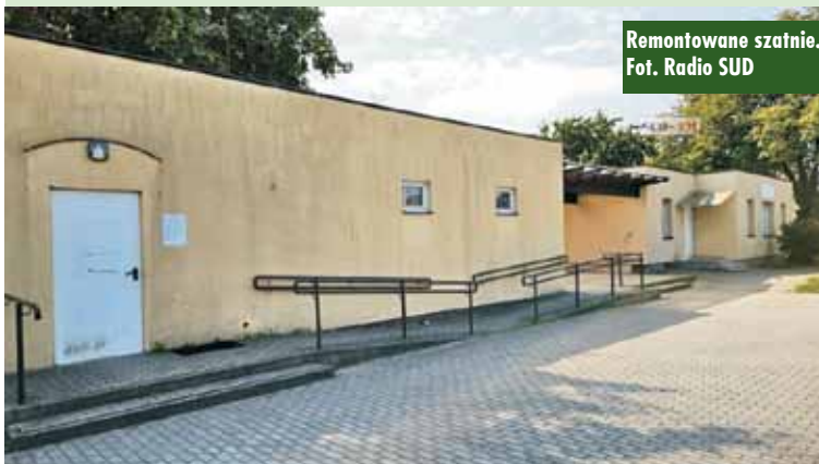
Remontowane szatnie.

Inwestycja obejmuje wykonanie prac budowlanych i remontowych budynku szatni, w tym: wykonanie ocieplenia ścian zewnętrznych, naprawę pokrycia dachu, wymianę rynien i rur spustowych, drzwi wejściowych, wymianę opraw oświetleniowych oraz wymianę kotła gazowego. Oprac. KR