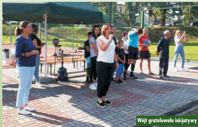
Wójt gratulowała inicjatywy