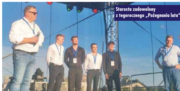
Starosta zadowolony z tegorocznego „Pożegnania lata”

Organizatorzy przygotowali wiele atrakcji dla dzieci, które chętnie korzystały z wesołego miasteczka i dmuchanej zjeżdżalni w strefie zabaw. Na scenie pojawiły się zespoły: Defis, Topky, MiłyPan i Ekstazy, któ-