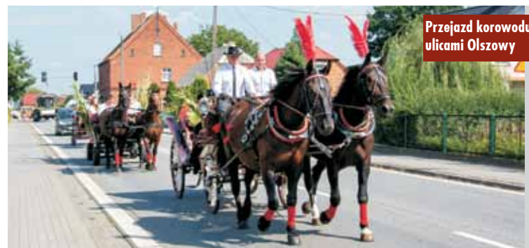
Przejazd korowodu ulicami Olszowy