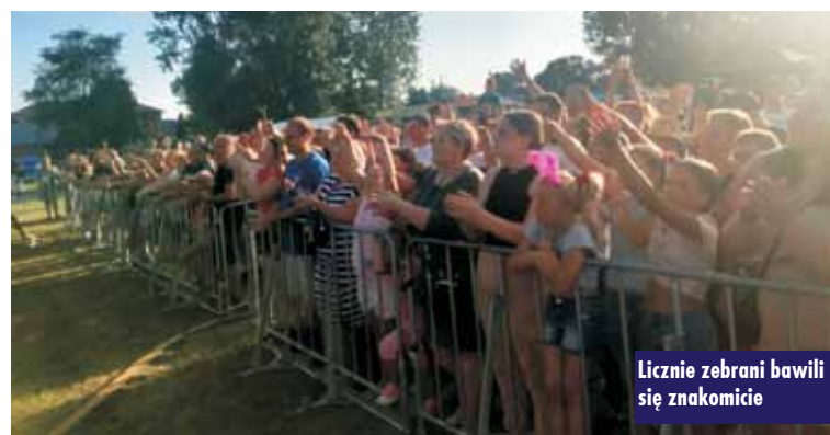
Licznie zebrani bawili się znakomicie

- Jak co roku „Pożegnania lata” odbywa się na terenie powiatu kępińskiego, wielokrotnie odbywały się w Kępnie, Bralinie, kilka razy w Baranowie, a teraz jest w Perzowie.