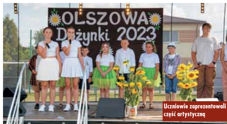
Uczniowie zaprezentowali część artystyczną