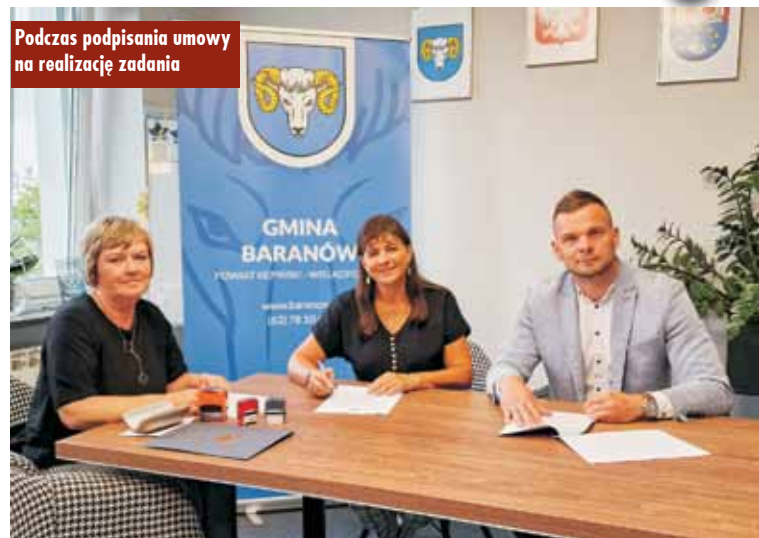
Podczas podpisania umowy na realizację zadania

W piątek, 25 sierpnia br., podpisano umowę na realizację zadania pn. „Budowa drogi gminnej Mroczeń – Słupia pod Kępnem”. Inwestycję wykona Kępińskie Przedsiębiorstwo Drogowo-Mostowe. Realizacja za-