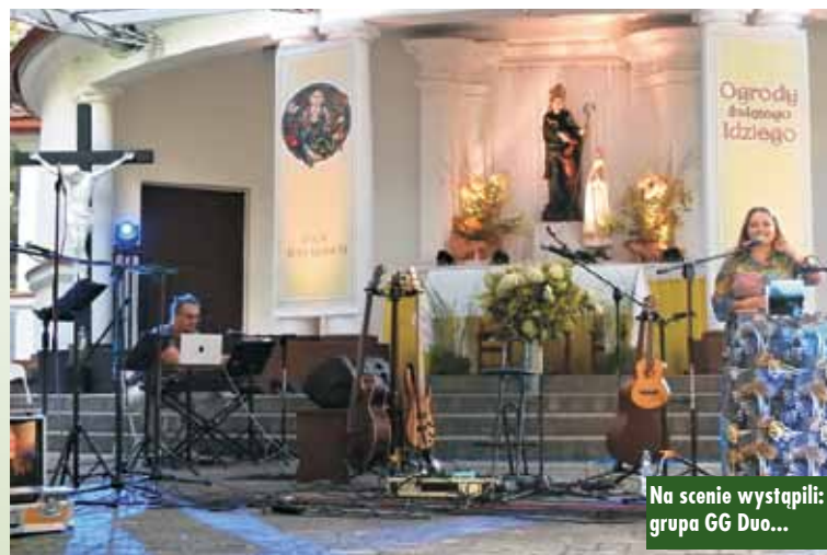
Na scenie wystąpili: grupa GG Duo...

Koncert zakończył się uroczystą mszą świętą z procesją światła oraz