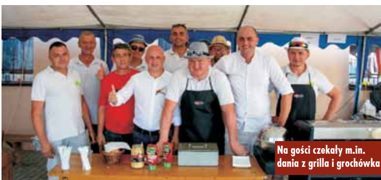
Na gości czekały m.in. dania z grilla i grochówka