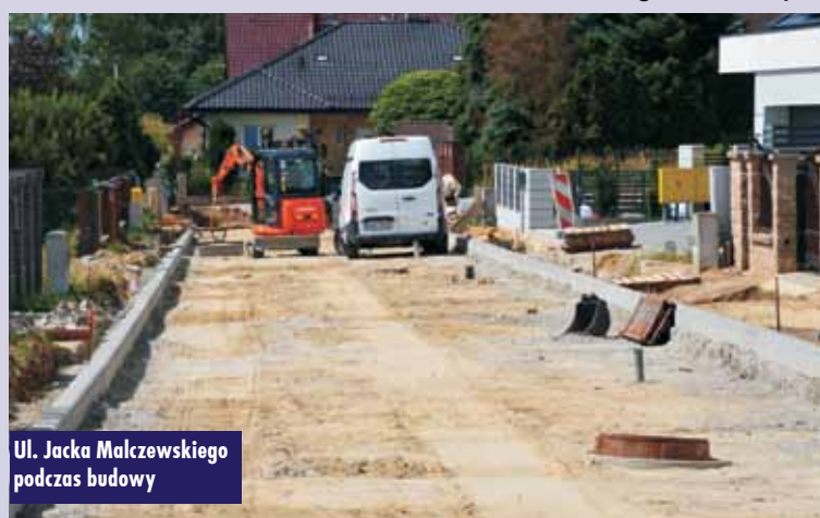
Ul. Jacka Malczewskiego podczas budowy

Zadanie obejmuje wykonanie jezdni ul. Piłsudskiego w Kępnie o nawierzchni asfaltowej, długości 518 m i szerokości 6 m. W zakresie inwestycji jest również wykonanie wpustów ulicznych do kanalizacji deszczowej,