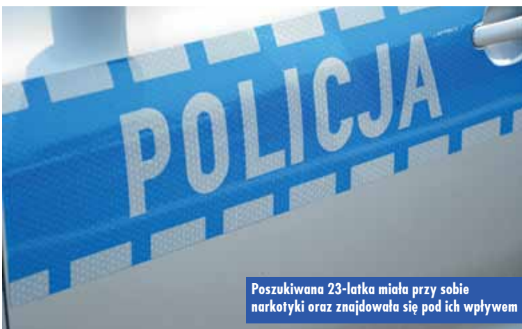
Poszukiwana 23-latką miała przy sobie narkotyki oraz znajdowała się pod ich wpływem