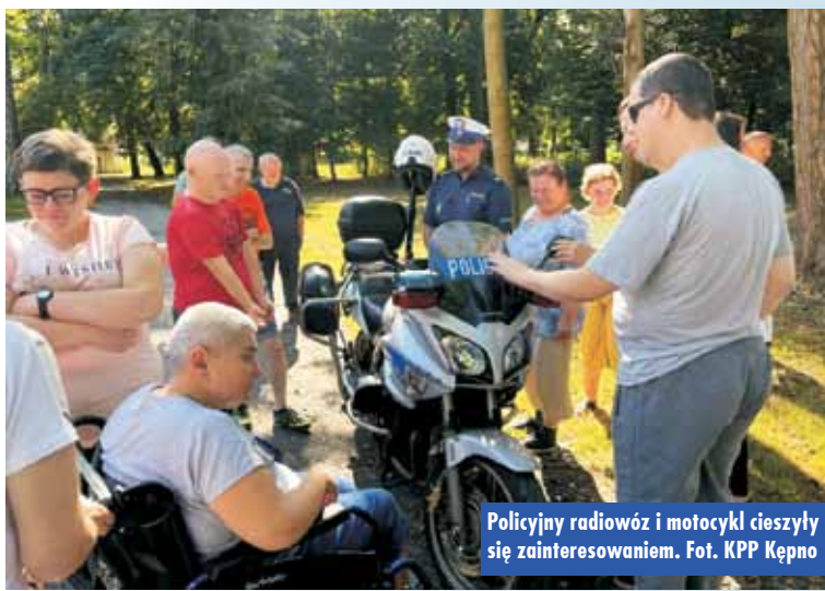
Policyjny radiowóz i motocykl cieszyły się zainteresowaniem.