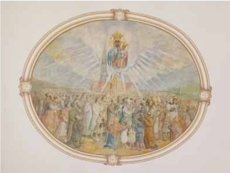
Środkowy fresk na sklepieniu kościoła

Trzy freski Nawiedzając świątynię zwracamy uwagę na trzy obrazy znajdujące się na sklepieniu kościoła, są to: „Chrzest Polski”, „Gody na Jasnej Górze” oraz „Wieczera Pańska”. Na-