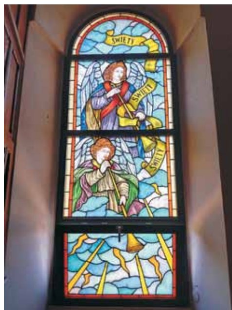
Witraż na chórze kościoła

pisem „St. Martino - ora pro nobis”, czyli „Św. Marcinie - módl się za nami”. Dzwony ze świątyni drem-