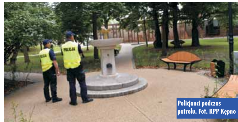
Policjanci podczas patrolu.

Na terenie budowy Galerii Handlowej w Baranowie znaleziono zwłoki 29-letniego mieszkańca gminy Biskupice