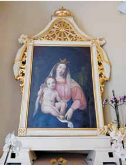
Feretron ze starego kościoła