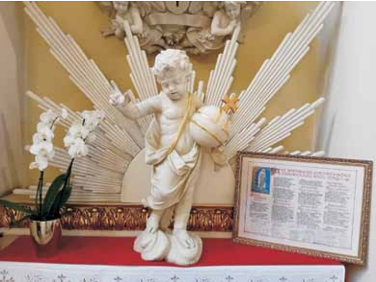
Dzieciątko Jezus ze starego kościoła

(rozpoczęcie roku sakralnego) było Wszystko gotowe. Lśniły (nieczytelne) i jasność. Równocześnie odmalowano probostwo i założono centralne ogrzewanie. Rozety na sklepieniu świątyni Od maja do lipca 1965 r. firma Ars Catolica z Katowic (wykonała również na zamówienie meble w zakrystii, użytkowane do dziś) umiesz-