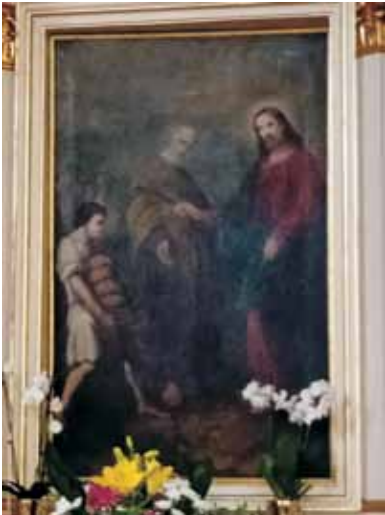
Obraz z bocznego ołtarza