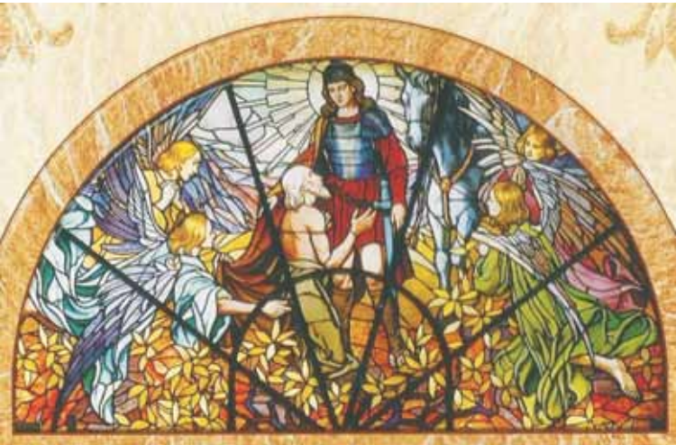
Witraż św. Marcina przypisywany J. Mehofferowi