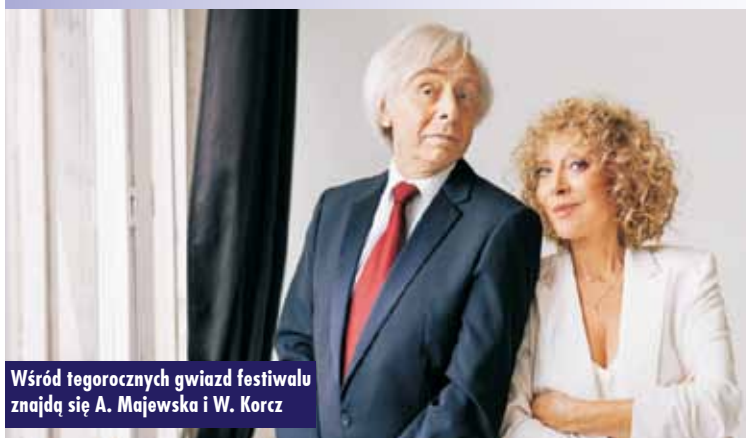
Wśród tegorocznych gwiazd festiwalu znajdują się A. Majewska i W. Korcz

Od 1 do 3 września br. na Rynku wydarzeniom scenicznym towarzyszyć będzie Festiwal Smaków. Przez trzy dni będziemy mogli skosztować specjalów kuchni międzynarodowej. Lubiane przez wszystkich food trucki staną na Rynku w Kępnie z bogatą ofertą gastronomiczną. Oprac. KR