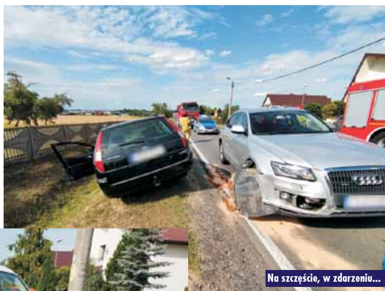
Na szczęście, w zdarzeniu...

21 lipca br., około godziny 16.22, do Stanowiska Kierowania Komendanta Powiatowej Państwowej Straży Pożarnej w Kępnie wpłynęło zgłoszenie o zdarzeniu drogowym na drodze krajowej nr 39 w Mroczeniu. Na miejsce zadysponowano zastępy z Jednostki Ratowniczo-Gaśniczej w Kępnie, OSP Mroczeń i OSP Baranów.