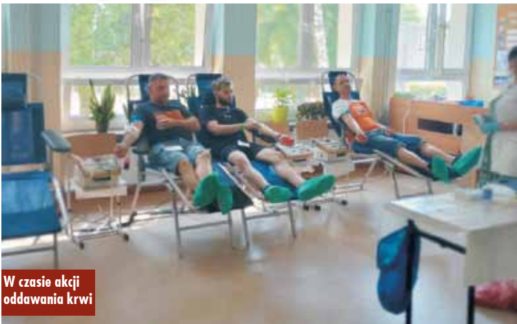
W czasie akcji oddawania krwi

9 lipca 2023 r. w Zespole Szkół im. Jana Pawła II w Laskach odbyła się akcja poboru krwi zorganizowana przez Regionalne Centrum Krwiodawstwa i Krwiolecznictwa w Kaliszu. Tego dnia krew oddało 27 krwiodawców.