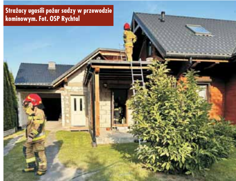
Strażacy ugasili pożar sadzy w przewodzie kominowym.

19 lipca br., około godziny 18.15, do Stanowiska Kierowania Komendanta Powiatowej Państwowej Straży Pożarnej w Kępnie wpłynęło zgłoszenie o pożarze sadzy w przewodzie kominowym budynku mieszkalnego przy ul. Zawada w Rychtalu. Na miejsce zdarzenia zadysponowano zastępy z Jednostki Ratowniczo-Gaśniczej w Kępnie i OSP Rychtal. - Działania strażaków polegały na zabezpieczeniu miejsca zdarzenia i wygasze-