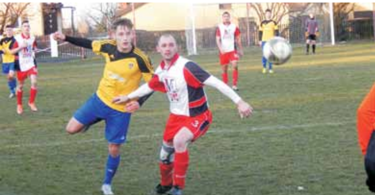
Wielkopoolanin Siemianice, lider Kaliskiej Klasy B walczył ambitnie, ale nie wystarczyło to na pokonanie drugiej siły Wielkopoolkiej piłki. Pucharowa przygoda drużyny z Siemianic była niczym bajka. Szkoda, że zabrakło w niej tylko pięknego zakończenia...