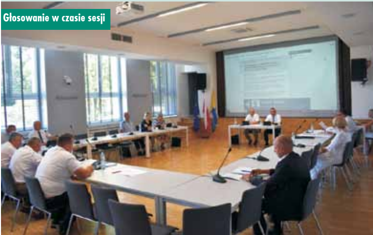
Głosowanie w czasie sesji

Radni podczas obrad podjęli uchwałę w sprawie zmiany uchwały budżetowej gminy Łęka Opatowska na 2023 r., a także w sprawie zmiany Wieloletniej Prognozy Finansowej Gminy na lata 2023-2039. Zajęli się też trybem i sposobem powoływania i odwoływania członków Zespołu Interdyscyplinarnego w Łęce Opatowskiej. Ważną uchwałą była ta doty-