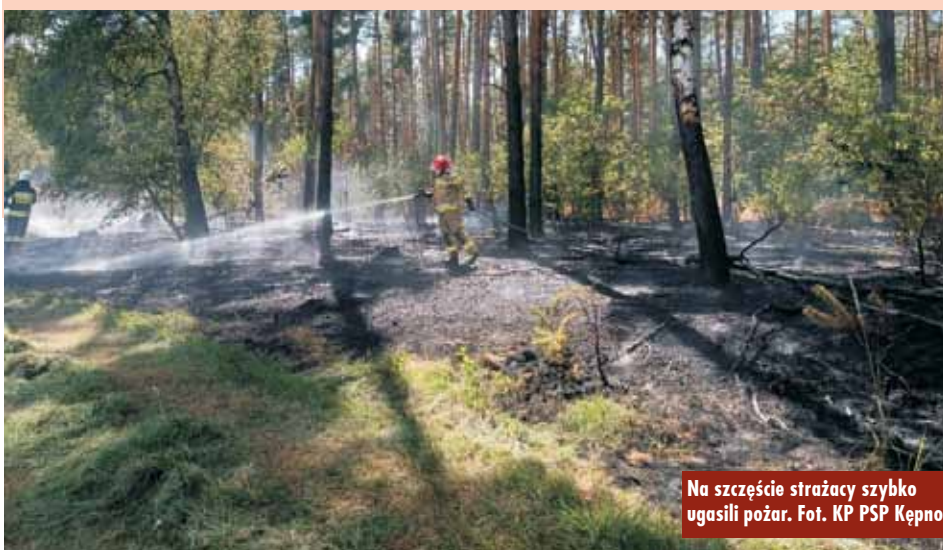
Na szczęście strażacy szybko ugasili pożar.