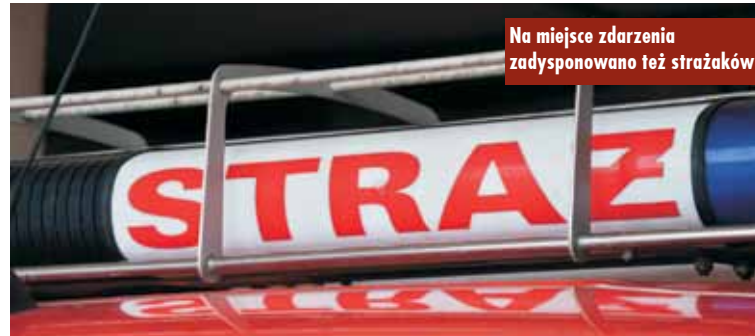
Na miejsce zdarzenia zadysponowano też strażaków