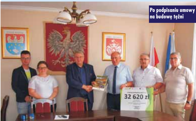
Po podpisaniu umowy na budowę tężni