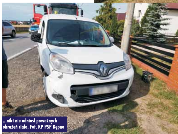
...nikt nie odniósł poważnych obrażeń ciała.

Po dotarciu na miejsce zdarzenia stwierdzono, że w zdarzeniu brały udział 4 samochody osobowe. Nie stwierdzono osób wymagających pomocy medycznej. - Działania strażaków polegały na zabezpieczeniu miejsca zdarzenia oraz uprzątnięciu pozostałości pokolizyjnych po zakończeniu czynności dochodzeniowych prowadzonych przez policję – poinformował oficer prasowy KP PSP Kępno, kpt. Paweł Michalski .