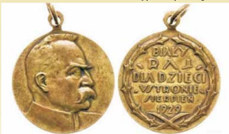
Medal wybity z okazji odsłonięcia popiersia Piłsudskiego

Dwór Myśliwski Ustronie to za- bytkowy obiekt, położony wśród ma- łowniczych łąk i lasów, blisko rzeki Prośny. Oddalony 2 km na północ od Opatowa, 7 km na południe od