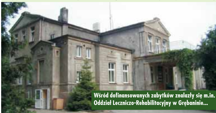
Wśród dofinansowanych zabytków znalazły się m.in. Oddział Lecznico-Rehabilitacyjny w Grębaninie...

piękno historycznych miejsc będzie zachowane na kolejne dekady. Dofinansowanie może być nawet na poziomie 98% wartości inwestycji – informuje poseł do Parlamentu Europejskiego Andżelika Możdżanowska .