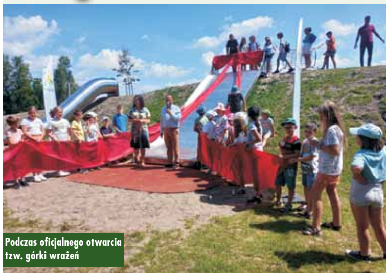
Podczas oficjalnego otwarcia tzw. górki wrażeń

Z myślą o najmłodszych i całych rodzinach w Kępnie powstał park zabaw, tzw. góra wrażeń. Nowe miejsce zostało wyposażone w szereg urządzeń zapewniających doskonałą zabawę i bezpieczeństwo. To miejsce aktywności fizycznej i odpoczynku na świeżym powietrzu. 11 lipca br. dokonano oficjalnego otwarcia inwestycji.