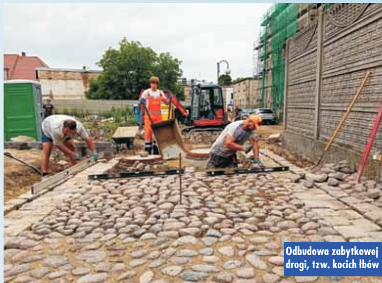
Odbudowa zabytkowej drogi, tzw. kocich łbów

Przypuszczalnie przebudowa bóżnicy będzie miała swój finał pod koniec tego roku. m