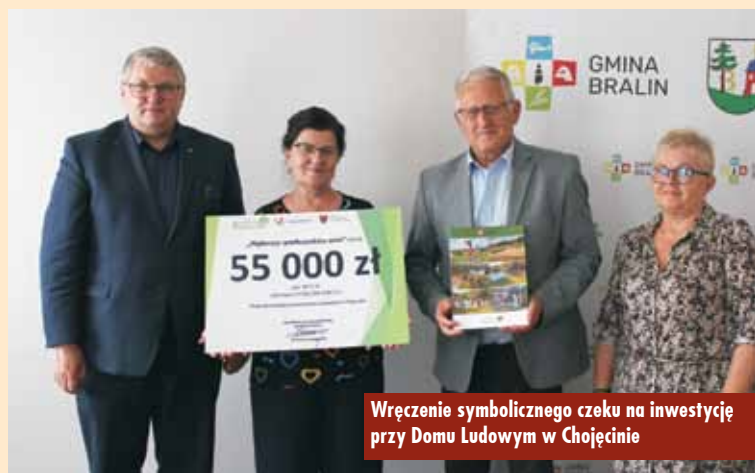
Wręczenie symbolicznego czeku w inwestycję przy Domu Ludowym w Chojęcinie

Umowy na powyższe dotacje zostały podpisane 10 lipca br. w Urzędzie Gminy Bralin z wicemarszałkiem Krzysztofem Grabowskim , reprezentującym Samorząd Województwa Wielkopolskiego. Gminę