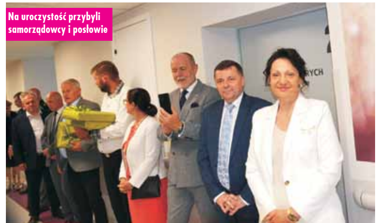
Na uroczystość przybyli samorządowcy i posłowie

wieckiego stawia na rozwój szpitali powiatowych, takich jak w Kępnie. - Serce rośnie, gdy widzi się, jakie efekty przyniosła ta inwestycja. Oddział ten przeszedł ogromną metamorfozę. Od kilku lat inwestycje w szpitalu potwierdziły jego znaczenie w Wielkopolsce. Wszystko po to, aby pacjent poczuł się, jak w swoim domu. Jest to dzieło wielu ludzi, to