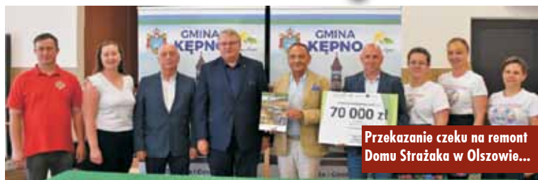
Przekazanie czeku na remont Domu Strażaka w Olszowie...

Remonty świetlicy wiejskiej w Krążkowach oraz Domu Strażaka w Olszowie zostaną przeprowadzone dzięki dotacjom pozyskanym przez Gminę Kępno z Urzędu Marszałkowskiego Województwa Wielkopolskiego.