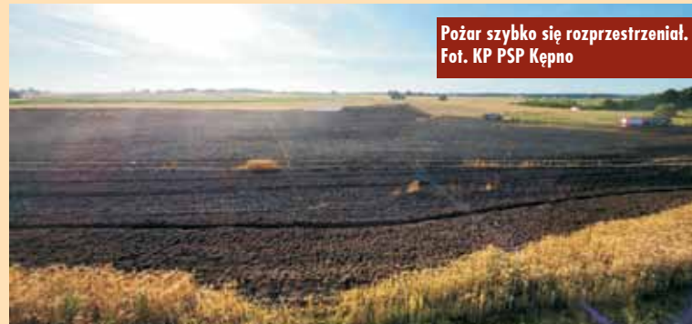
Pożar szybko się rozprzestrzeniał.

przy usuwaniu niedopałków papierosów i posługiwaniu się ogniem otwartym. Wyeliminujmy zachowania, które niosą ryzyko wybuchu pożaru, zwłaszcza w pobliżu obszarów leśnych i pól uprawnych. Wystarczy jedno źródło ognia, by spowodować ogromne straty materialne, zagrażając jednocześnie bezpieczeństwu