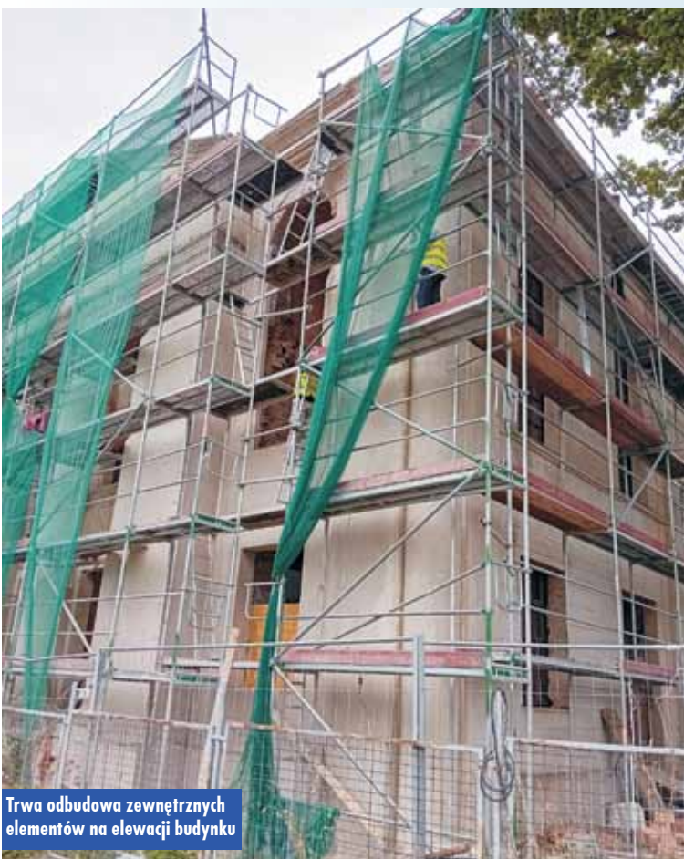
Trwa odbudowa zewnętrznych elementów na elewacji budynku