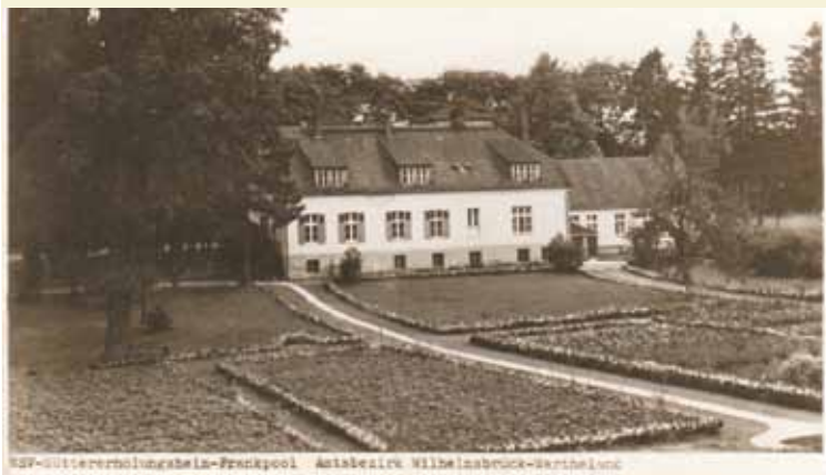
Widok Ustronia z 1941 r. po usunięciu popiersia

wiska i spowodować wzrost jego znaczenia, na kanwie popularności Marszałka Józefa Piłsudskiego posta- nowiono postawić na terenie zakładu leczniczego popiersie Marszałka.