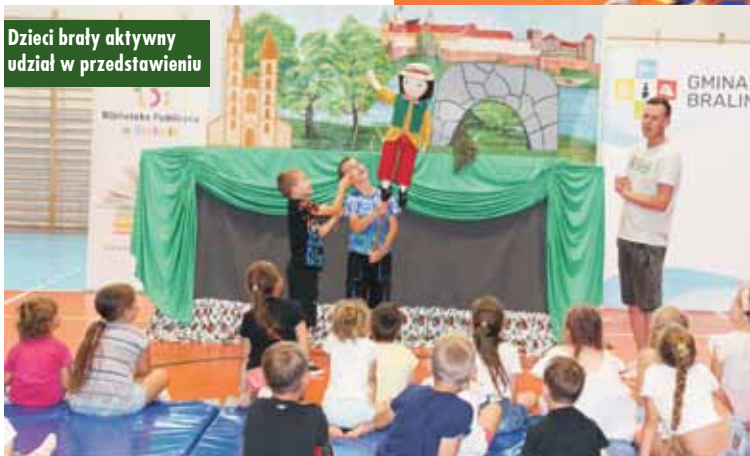
Dzieci brały aktywny udział w przedstawieniu