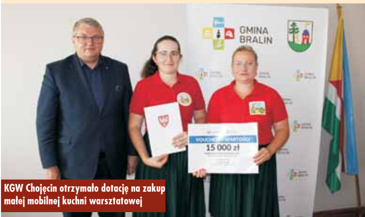
KGW Chojęcin otrzymało dotację na zakup małej mobilnej kuchni warsztatowej

Z kolei Koło Gospodyń Wiejskich w Chojęcinie pozyskało dofinansowanie w kwocie 15.000 zł w ramach otwartego konkursu ofert Departamentu Rolnictwa UMWW w Poznaniu na zadanie pn. „Mała