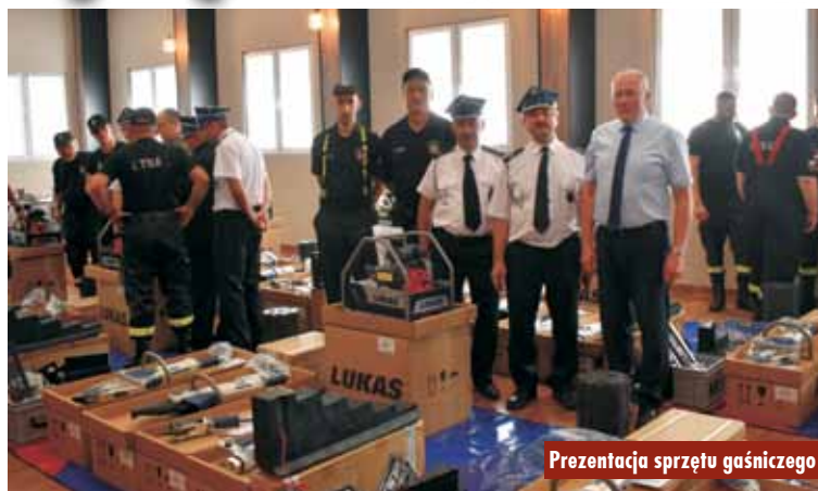
Prezentacja sprzętu gaśniczego

5 lipca 2023 r. w obiekcie Ochotniczej Straży Pożarnej w Golinie odbyło się przekazanie nowych zestawów hydraulicznych ratowniczo-technicznego dla strażaków z gminy Trzcينica. Wartość sprzętu to 81 991,80 zł, z czego 57 394,26