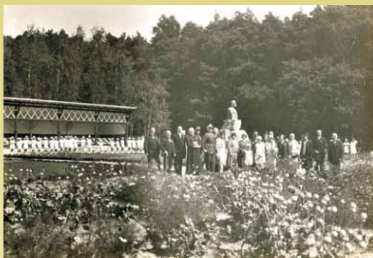
Zaproszeni goście na uroczystości odsłonięcia popiersia

W okresie międzywojennym w 1928 r. utworzono w Ustroniu Zakład Lecznicy pod nazwą „Biały Raj”, dedykowany leczeniu schorzeń dzieci. Na turnusach leczniczych do wybuchu wojny w 1939 r. przebywa- ło tam łącznie kilka tysięcy małych pacjentów. Miejsce to często wizy- towali politycy, artyści, przedsta- wiciele władz lokalnych. Aby jeszcze bardziej podnieść prestiż tego uzdro-