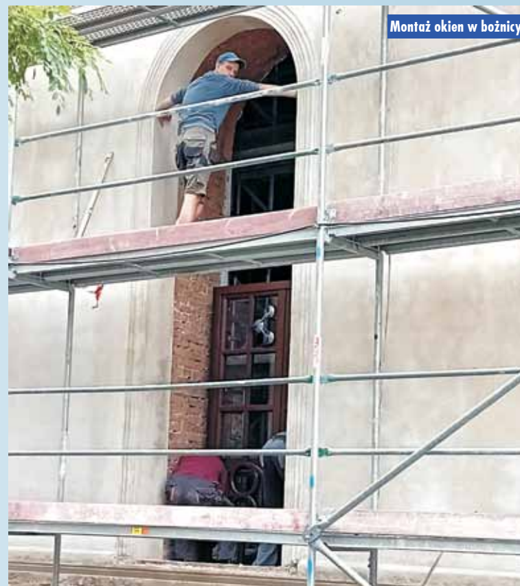
Montaż okien w bóżnicy

Aktualnie wstawiane są już nowe okna, nawiązujące do starego wzornictwa. Są jednak wykonane z nowoczesnych materiałów ciepłych, pozwalających na szczelność, co gwarantuje ogrzanie całej kubatury budynku. - Projekt okiennic był tworzony pod nadzorem konserwator-