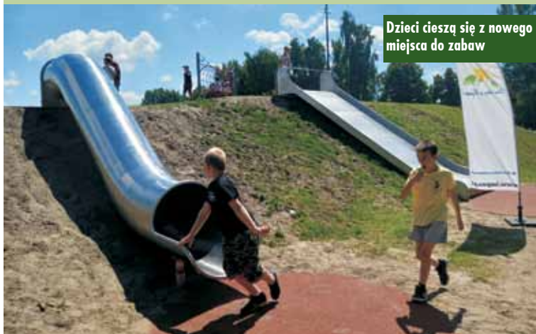
Dzieci cieszą się z nowego miejsca do zabaw