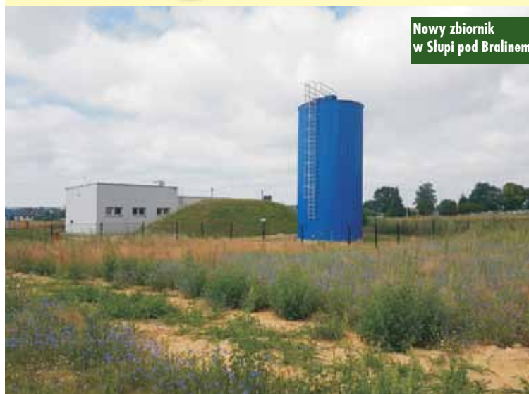
Nowy zbiornik w Słupi pod Bralinem

W czerwcu 2023 r., po uzyskaniu pozytywnych wyników badań jakości wody, włączono do użytku nowy zbiornik buforowy wody V-150 m 3 , zlokalizowany przy hydroforni w Słupi pod Bralinem. Budowa zbiornika