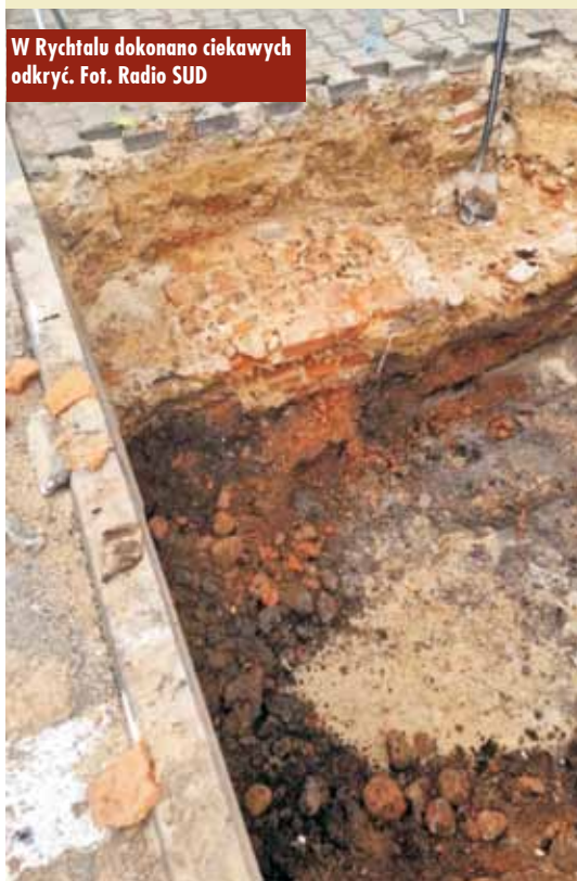
W Rychtalu dokonano ciekawych odkryć.

jące. Jest to wymóg konserwatora zabytków przed planowaną modernizacją płyty Rynku. - Archeolodzy dokonali ciekawych odkryć, m.in. znaleziono fundamenty pomnika św. Jana Nepomucena, który kiedyś znajdował się na Rynku. Odkryto również drewniane elementy, które mogą być pozostałością po zabudowaniach, np. drewnianych budynkach mieszkalnych. Niewykluczone, że są to elementy po dawnym urzędzie. Archeolodzy odkryli dosyć duże fundamenty ceglane. Cały przekrój warstwy gruntów ujawnił elementy,