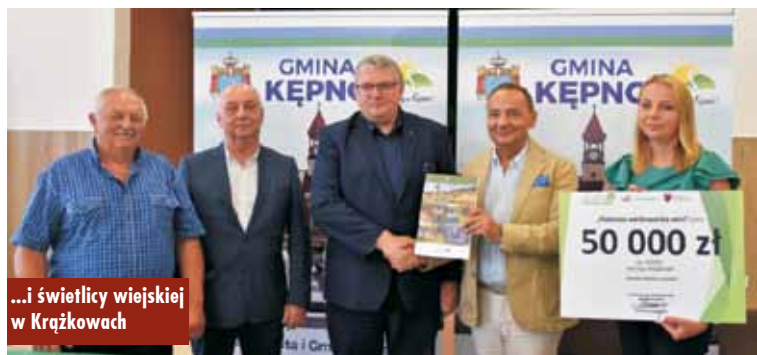
...i świetlicy wiejskiej w Krążkowach

- Prace remontowe znacząco wpłyną na poprawę estetyki budynków, będących miejscem spotkań lokalnej społeczności – podsumował burmistrz. Oprac. KR