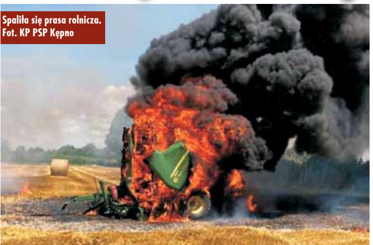
Spaliła się prasa rolnicza.

nęło zgłoszenie o pożarze prasy rolniczej oraz ścierniska w Domasławie. Na miejsce zdarzenia zadysponowano zastępy z Jednostki Ratowniczo-Gaśniczej w Kępnie, OSP Domasław i OSP Trębaczów. Po dotarciu na miejsce zdarzenia potwierdzono, że ma miejsce pożar maszyny rolniczej oraz ścierniska na powierzchni około 3 arów. - Działania strażaków, po zabezpieczeniu miejsca zdarzenia, polegały na podaniu dwóch prądów gaśniczych w natarciu na źródła pożaru, co doprowadziło do ugaszenia pożaru. W celu potwierdzenia usunięcia zagrożenia maszynę sprawdzono kamerą termowizyjną – relacjonuje oficer prasowy KP PSP Kępno, st. kpt. Paweł Michalski.