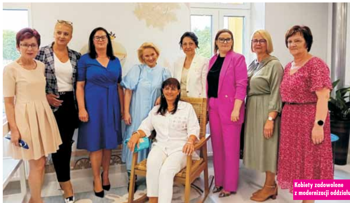
Kobiety zadowolone z modernizacji oddziału

Z kolei starosta dziękował wszystkim, którzy wsparli realizację tejże inwestycji, a w szczególności A. Możdżanowskiej, wręczając symboliczny bukiet kwiatów. - Nie byłoby