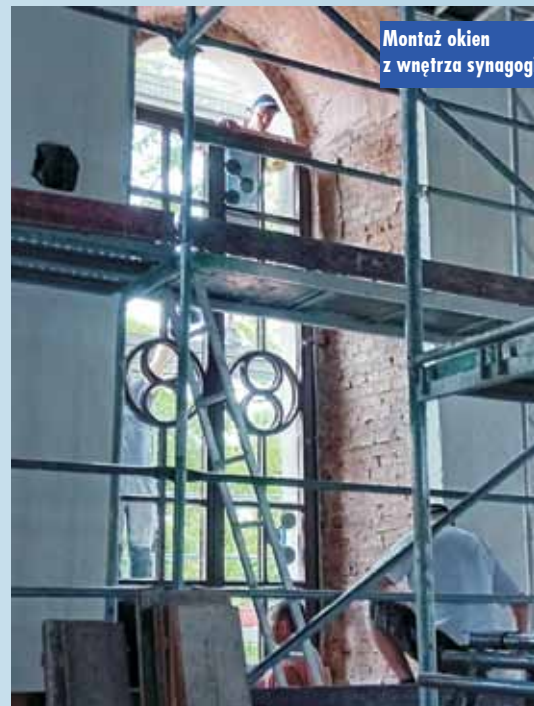
Montaż okien z wnętrza synagogi

- W pierwszy weekend września, w czasie cyklicznie organizowanego Festiwalu Trzech Kultur, będzie można już zobaczyć elewa-