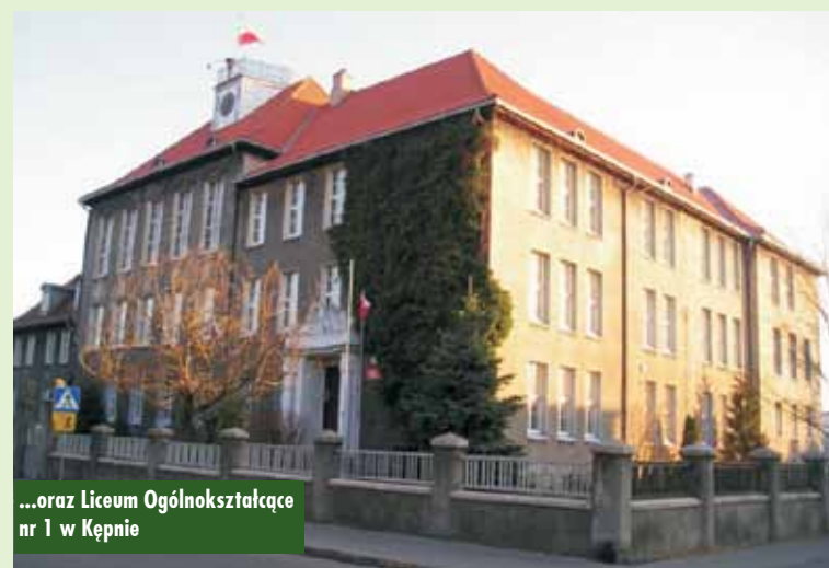
...oraz Liceum Ogólnokształcące nr 1 w Kępnie

Do Wielkopolski trafi blisko 220 milionów złotych. Środki przyznano