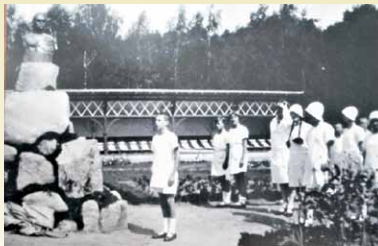
Dzieci przy popiersiu Marszałka