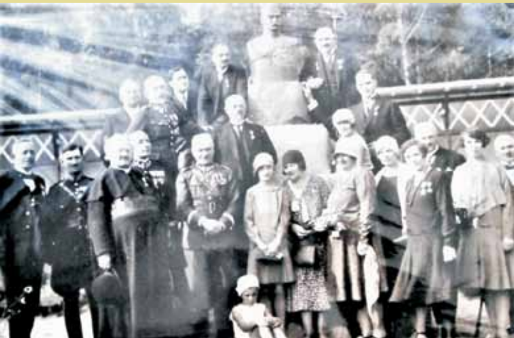
Goście w Ustroniu w czasie odsłonięcia popiersia

25 sierpnia 1929 r. w Ustroniu, w Wieruszowa i 14 km na południowy wschód od Kępna. Administracyjnie