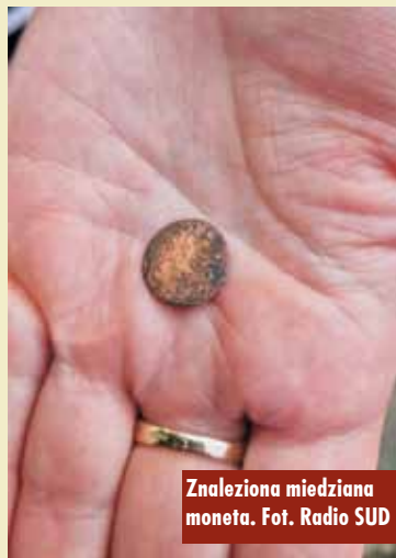
Znaleziona miedziana moneta.

Rychtal znalazł się na krótkiej ministerialnej liście miejscowości kandydujących, aby uzyskać status miasta