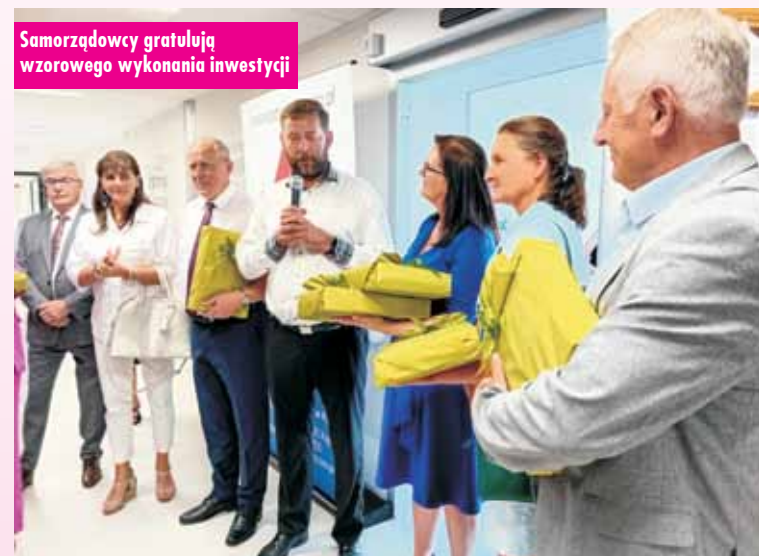
Samorządowcy gratulują wzorowego wykonania inwestycji

tej inwestycji bez wsparcia premiera, który znacznie wsparł finansowo tę inwestycję. Wielkie uznanie również