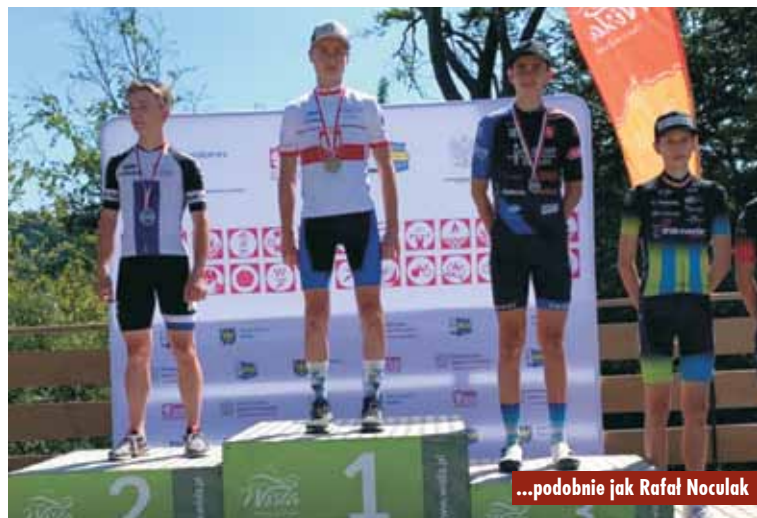
...podobnie jak Rafał Noculak

Termomodernizacja budynków w Szkole Podstawowej w Bralinie i w Zespole Szkół w Nowej Wsi Książęcej