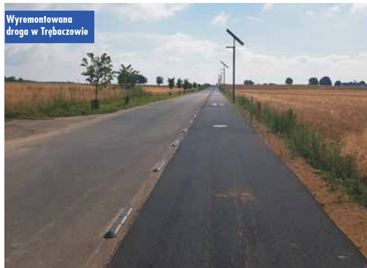
Wyremontowana droga w Trębaczowie

Słupia pod Bralinem z nowym zbiornikiem wodnym