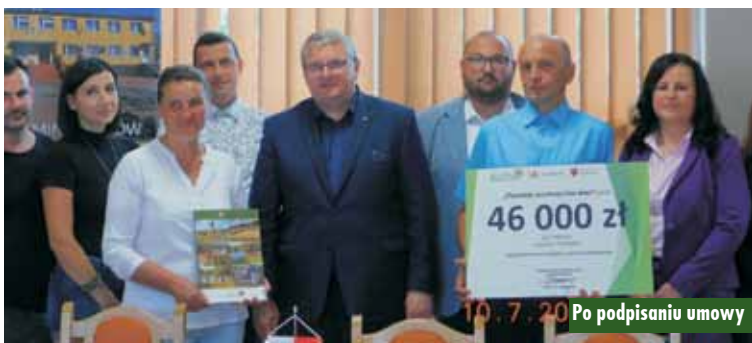
10.7.20 Po podpisaniu umowy

zadania „Zagospodarowanie kompleksu sportowo-rekreacyjnego w Turkowach”, w ramach XIII edycji konkursu „Pięknieje Wielkopolska Wieś”. W ramach projektu zostanie wykonany parking z wyznaczonym miejscem dla osób niepełnosprawnych, uzupełnienie ogrodzenia oraz niwelacja części skarpy. Zostaną wymienione siatki dwóch piłkochwyty, siatka do siatkówki oraz siatki w bramkach. Przewidywany koszt inwestycji wyniesie 65.815,64 zł, z czego 46.000 zł stanowi dofinansowanie. Oprac. m