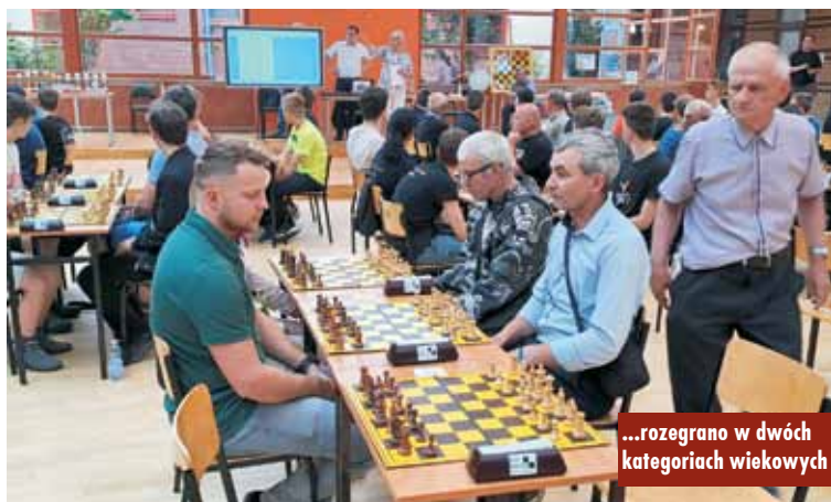
...rozegrano w dwóch kategoriach wiekowych

Najmłodsi mieszkańcy gminy Bralin na wycieczce w Opolu