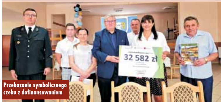
Przekazanie symbolicznego czeku z dofinansowaniem