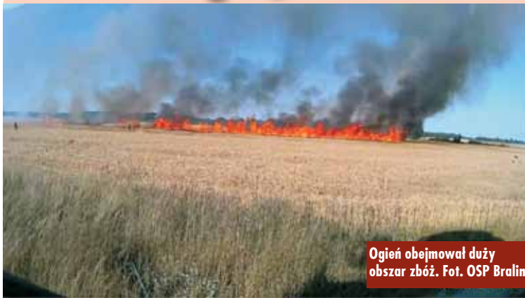
Ogień obejmował duży obszar zbóż.

9 lipca br., około godziny 18.05, do Stanowiska Kierowania Komendanta Powiatowego Państwowej Straży Pożarnej w Kępnie wpłynęło zgłoszenie o pożarze zboża na pniu w Czerminie. Na miejsce zadysponowano zastępy z Jednostki Ratowniczo-Gaśniczej w Kępnie, OSP Czermin, OSP, Bralin, OSP Chojęcin, OSP Turkowy, OSP Opatów i OSP Kępno.