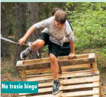
Na trasie biegu

Szczęśliwie zakończyły się poszukiwania 54-latką, który po kilku godzinach od zgłoszenia został odnaleziony przez kępińskich mundurowych