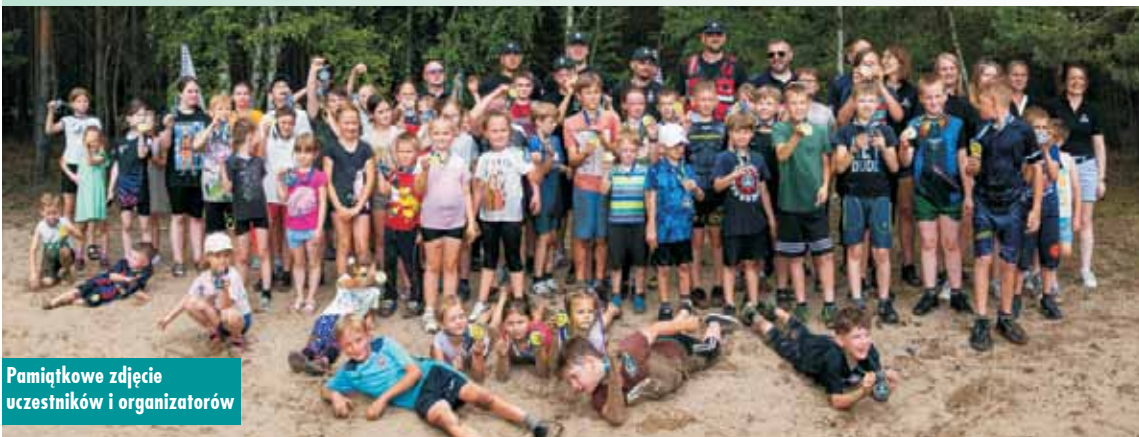
Pamiątkowe zdjęcie uczestników i organizatorów

25 czerwca br. na terenach leśnych w miejscowości Jankowy odbył się „Ekstremalny bieg z przeszkodami dla dzieci”. Wydarzenie zorganizowane zostało przez Stowarzyszenie Kobiet Aktywnych Gminy Baranów w partnerstwie z Komendą Powiatową Policji w Kępnie. Imprezę zorganizowano w ramach projektu dofinansowanego ze środków budżetu Gminy Baranów.