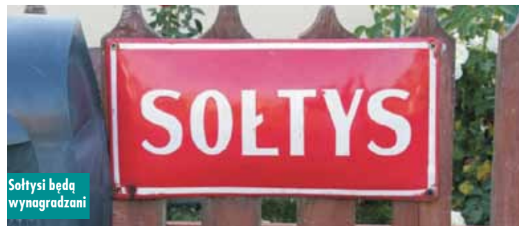
Sołtysi będą wynagradzani

lat, a mężczyzn 65 lat, nie byli skazani prawomocnym wyrokiem za przestępstwo lub przestępstwo skarbowe popełnione w związku z pełnieniem funkcji sołtysa.