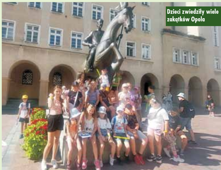
Dzieci zwiedziły wiele zakątków Opola