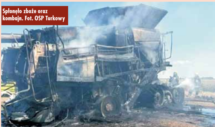
Splonęło zboże oraz kombajn.

10 lipca br. w świetlicy wiejskiej w Turkowach została podpisana umowa między Gminą Perzów, a Urzędem Marszałkowskim Województwa Wielkopolskiego