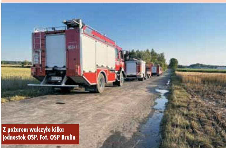
Z pożarem walczyło kilka jednostek OSP.

Dofinansowanie dla Szkoły Podstawowej im. Mikołaja Kopernika w Bralinie