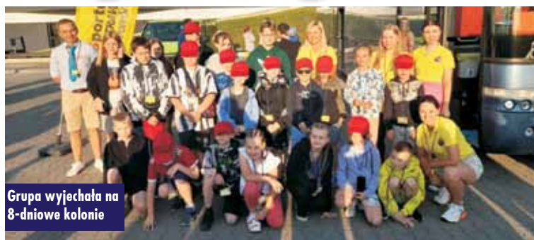
Grupa wyjechała na 8-dniowe kolonie

9 lipca br. pierwsza grupa dzieci i młodzieży z terenu gminy Bralin wyruszyła na 8-dniowe kolonie do nadmorskiej miejscowości Łazy. Kolonie współfinansowane ze środków z Programu Rozwiązywania Problemów Alkoholowych i Przeciwdziałania Narkomanii.