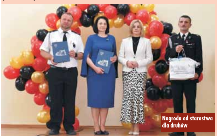
Nagroda od starostwa dla druhów

Nie zabrakło też podziękowań, życzeń i gratulacji, które złożyli przybyli goście. Przekazano również gratulacje oraz statuetkę w imieniu prezesa Rady Ministrów Mateusza Morawieckiego. Spotkanie uświetniła orkiestra. Oprac. m