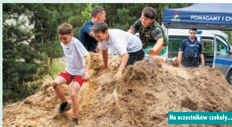
Na uczestników czekały...