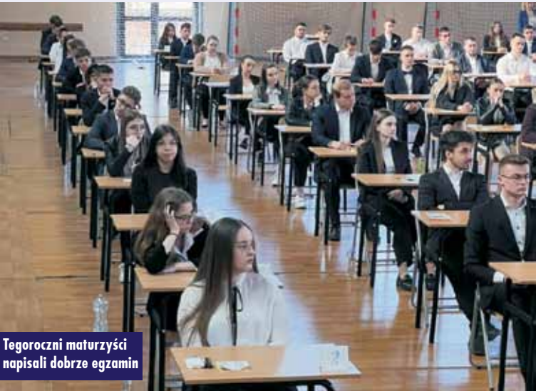
Tegoroczni maturzyści napisali dobrze egzamin

Analizując wyniki ze względu na typy szkół, należy zauważyć, że podobnie jak w latach ubiegłych wyższą zdawalność osiągnęły licea. W powiecie kępińskim jest ona bardzo wysoka w obu liceach i średnio wyniosła w powiecie 95,4%, przy średniej w Wielkopolsce 90% a w kraju 91,1%. W Liceum Ogólnokształcącym nr I ze 104 uczniów egzamin zdało 101, tj. 97,1%, a w Liceum Ogólnokształcącym nr II w ZSP nr 1 z 49 uczniów zdało 45, tj. 91,8%. Jest to kolejny rok, w którym kępińskie licea osiągają zdawalność zdecydowanie