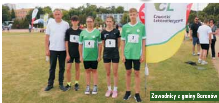
Zawodnicy z gminy Baranów