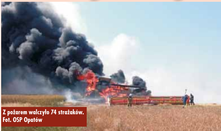
Z pożarem walczyło 74 strażaków.

stwierdzono, że pali się zboże na pniu, a pożarem całkowicie objęty jest też kombajn zbożowy. Rozprzestrzenianie się pożaru było intensyfikowane porami wiatru. - Działania strażaków polegały na zabezpieczeniu miejsca zdarzenia, następnie, wraz z dojazdem kolejnych zastępów, podano łącznie 8 prądów wody w obronie i natarciu, co doprowadziło do lokalizacji, a następnie ugaszenia pożaru. Pogorzelisko zostało oborane maszynami rolniczymi przez właścicieli – relacjonuje oficer prasowy KP PSP Kępno, kpt. Paweł Michalski . Oprac. KR