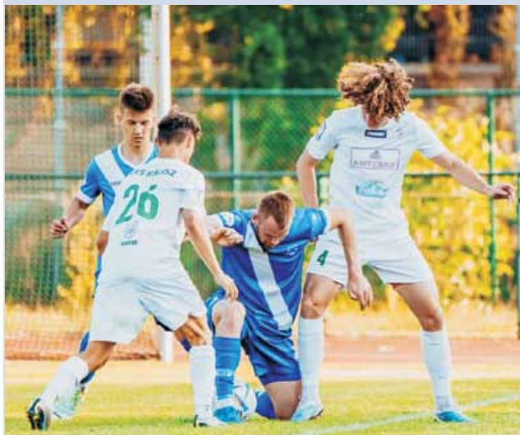
Kępnianie postawili się drugoligowcowi i rewelacji ostatniej edycji Pucharu Polski, czyli KKS-owi Kalisz, ale ostatecznie przegrali 1:2 w letnim sparingu z okazji 115-lecia klubu z Alei Marcinkowskiego.