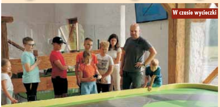
W czasie wycieczki

4 lipca 2023 r. odbyła się wycieczka do Złotego Stoku i Paczkowa zorganizowana w ramach Programu Profilaktycznego przez gminę Trzcínica. Wzięli w niej udział uczniowie klas I-VIII Szkoły Podstawowej w Laskach. Pierwszym punktem wycieczki było zwiedzanie średnio-wiecznej osady górniczej. Następnie uczestnicy odwiedzili kopalnię złota oraz Metamuzeum Motoryzacji w Paczkowie.