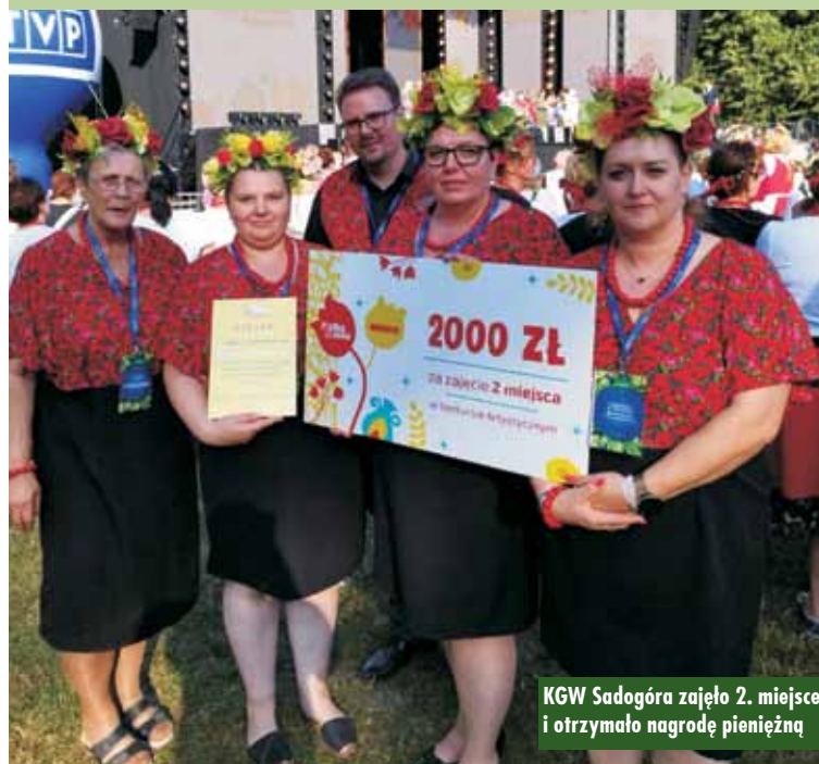
KGW Sadogóra zajęło 2. miejsce i otrzymało nagrodę pieniężną