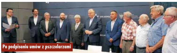
Po podpisaniu umów z pszczelarzami

Stosowana umowa na realizację zadania została podpisana pomiędzy Województwem Wielkopolskim a Regionalnym Związkiem Pszczelarzy Wielkopolski Północnej w Chodzieży, reprezentującym także związki pszczelarskie z Konina, Kalisza, Leszna i Poznania. Realizacja tego zadania ma ogromne znaczenie dla ekosystemów roślinnych i poprawy warunków środowiskowych na obszarze Wielkopolski. W ciągu trzech edycji programu (2018-2020) zakupiono i rozdyskrebowano ponad 130 ton plastrów węży o wartości 6 milionów złotych, a z pomocy co roku korzystało ponad 4600 wielkopolskich pszczelarzy. Natomiast w latach 2021 i 2022 w ramach zakupu i dystrybucji pokarmów pszczelich, ponad 887 ton trafiło do przeszło 307 tysięcy pni pszczelich na terenie Wielkopolski. Ponadto, w tym czasie w regionie udało się zasadzić kilkadziesiąt tysięcy drzew miododajnych. Program ten cieszy się stałym zainteresowaniem ze strony lokalnych samorządów, a przeznaczone na ten cel środki są w całości wykorzystywane. Oprac. KR