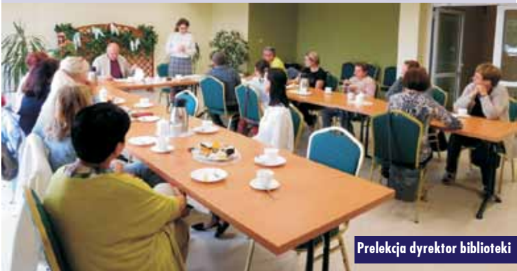
Prelekcja dyrektora biblioteki

W czerwcu br. w Gminnej Bibliotece Publicznej w Trzcínicy odbyło się spotkanie organizacyjne dla osób dorosłych i seniorów chcących wziąć udział w Gminnym Konkursie Historycznym, którego tematyka nawiązuje do losów „Bohaterów i bohaterów getta warszawskiego”. Przypomnijmy, iż 2023 r. został ogłoszony Rokiem Pamięci Bohaterów i Bohaterów Getta Warszawskiego dla uczczenia 80. rocznicy wybuchu powstania w getcie warszawskim.