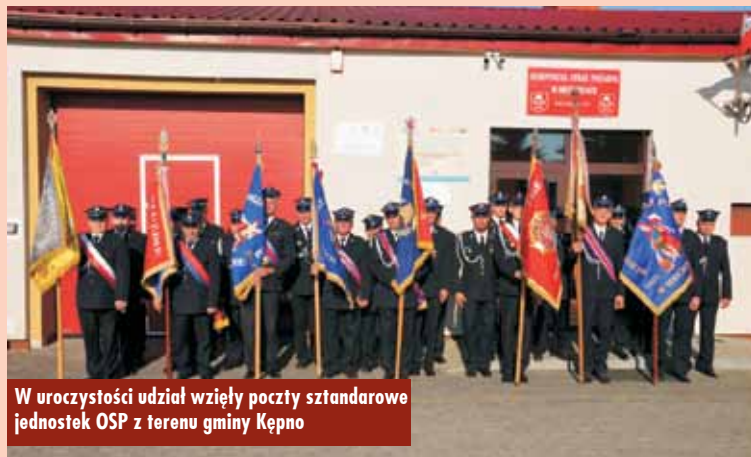
W uroczystości udział wzięły poczty sztandarowe jednostek OSP z terenu gminy Kępno

Następnie wszyscy goście oraz delegaci z sąsiadujących jednostek – OSP Mikorzyn, OSP Domanin, OSP Kierzno, OSP Świba, OSP Olszowa, OSP Rzetnia, OSP Kępno i OSP Szklarka Mielęcka – udali się na poczęstunek do Domu Ludowego w Mechnicach.