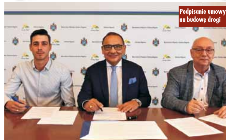
Podpisanie umowy na budowę drogi