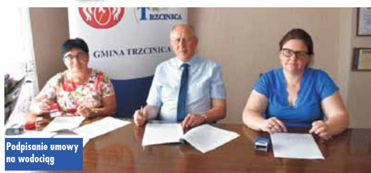
Podpisanie umowy na wodociąg