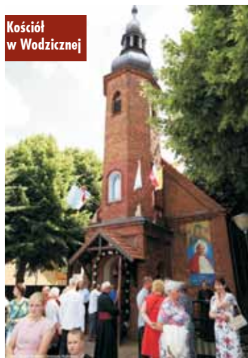
Kościół w Wodziecnej

IV Powiatowy Przegląd Zespołów Śpiewaczych w Laskach