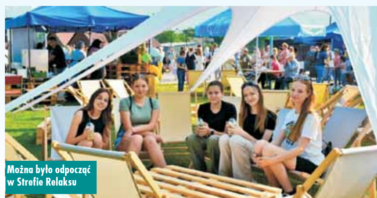
Można było odpocząć w Strefie Relaksu

Korzystając z okazji, wręczono nagrody za zajęcie pierwszych miejsc w konkursie oddawania krwi „Wampirada”, organizowanego w 3 czerwca br. w Rychtalu. W kategorii