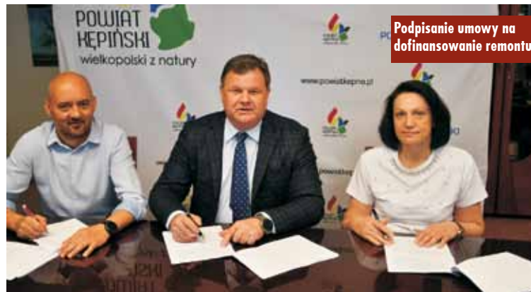
Podpisanie umowy na dofinansowanie remontu

realizację całości zadania do końca tego roku, co znacząco skróci czas realizacji inwestycji – stwierdza pilotująca program dofinansowanie europoseł Andżelika Moździanowska .