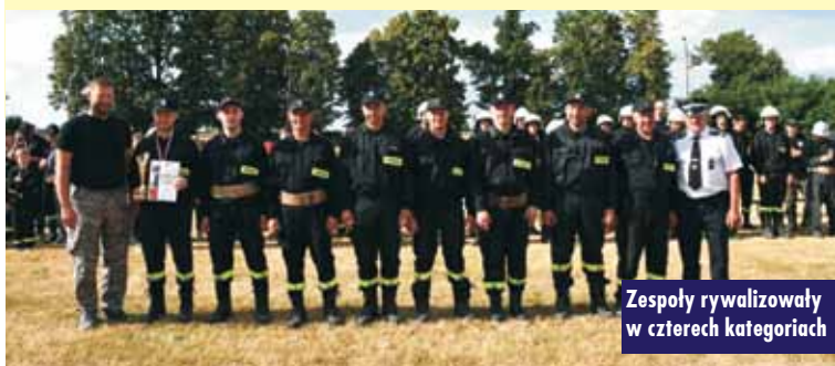
Zespoły rywalizowały w czterech kategoriach

Spotkanie z pierwszym mieszkańcem gminy Perzów urodzonym w 2023 r.