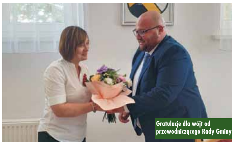
Gratulacje dla wójt od przewodniczącego Rady Gminy

środowiska, gospodarki komunalnej i mieszkaniowej, oświaty, kultury, bezpieczeństwa i porządku oraz wielu innych zagadnień zostały zawarte w obszernym Raporcie o stanie gminy w 2022 r.