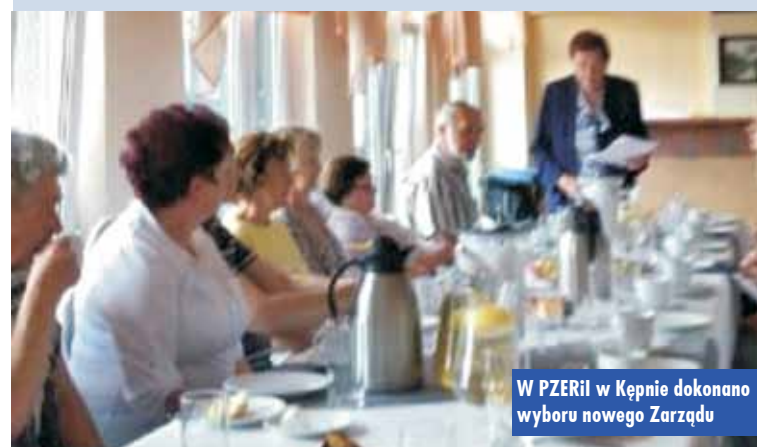
W PZERiI w Kępnie dokonano wyboru nowego Zarządu