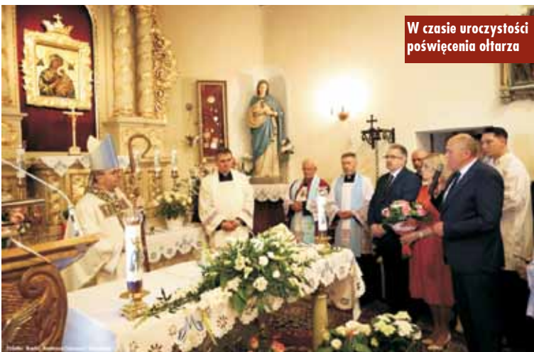
W czasie uroczystości poświęcenia ołtarza