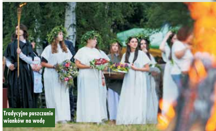
Tradycyjne puszczanie wianków na wodę

23 czerwca br. w Mikorzynie odbyła się Noc Świętojańska, inaugurująca okres wakacyjny w gminie Kępno.