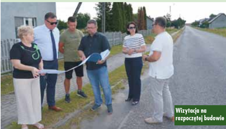
Wizytacja na rozpoczęciu budowy

Policjanci Komendy Powiatowej Policji w Kępnie zatrzymali siedmiu imigrantów z Indii, którzy byli przewożeni przez 27-letniego kierowcę ze Słupska