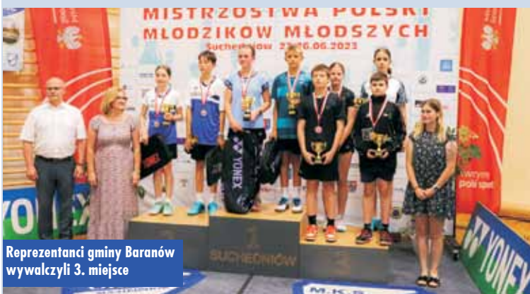
Reprezentanci gminy Baranów wywalczyli 3. miejsce

W zawodach wzięła udział rekordowa liczba 213 zawodników i zawodniczek z klubów z całej Polski. Donaborowski klub reprezentowało