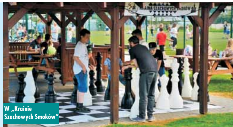
W „Krainie Szachowych Smoków”

trzy spektakularne eksplozje kolorów. Radość z tej kolorowej zabawy czerpali zarówno najmłodszy, jak i dorośli. Możecie nam uwierzyć, że było