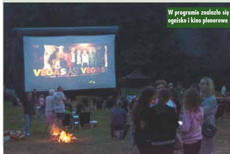
W programie znalazło się ognisko i kino plenerowe

Wybrano Zarząd Polskiego Związku Emerytów Rencistów i Inwalidów – Oddział Rejonowy w Kępnie