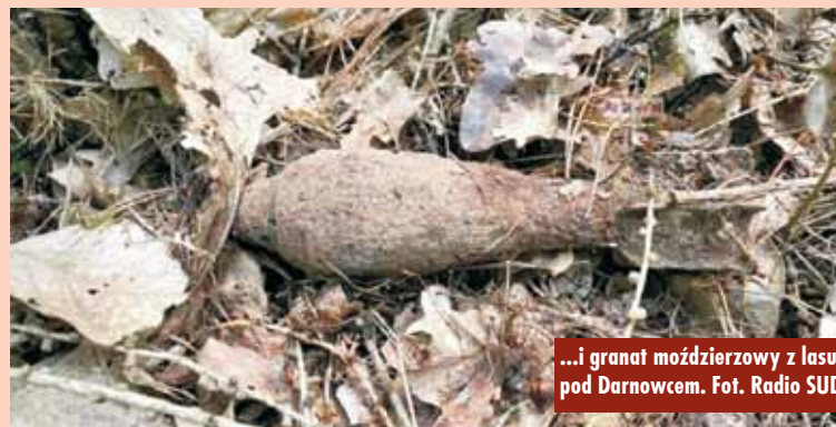
...i granat moździerzowy z lasu pod Darnowcem.

ny światowej. W lesie pod Darnowcem znaleziono natomiast radziecki granat moździerzowy (50 mm) z zapalnikiem, również z okresu II wojny światowej. Na miejsce przybyli saperzy z Brzęgu, aby zabrać i zdetonować niewybuchy. - W wielu miejscach jeszcze dziś możemy natknąć się na pozostałości minionej wojny, resztki składów amunicji, granaty, miny, pociski moździerzowe, bomby lotnicze, amunicję – jednym słowem, niewypały i niewybuchy,