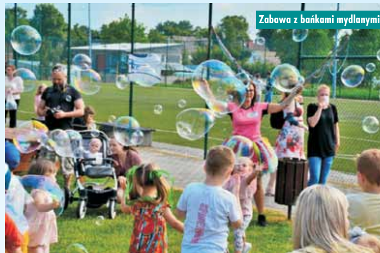
Zabawa z bańkami mydlanymi

Spółecznej oraz Kampania V Europejskiego Dnia Przeciwdziałania Włamaniom do Domów – Komenda Powiatowa Policji w Kępnie.