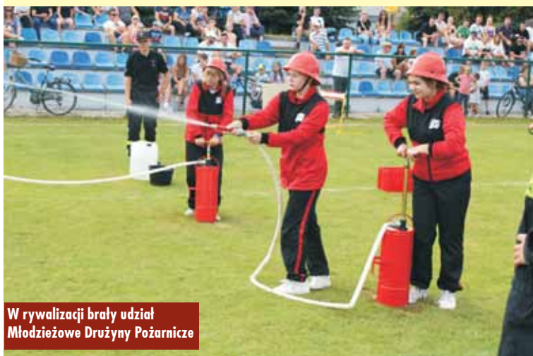
W rywalizacji brały udział Młodzieżowe Drużyny Pożarnicze