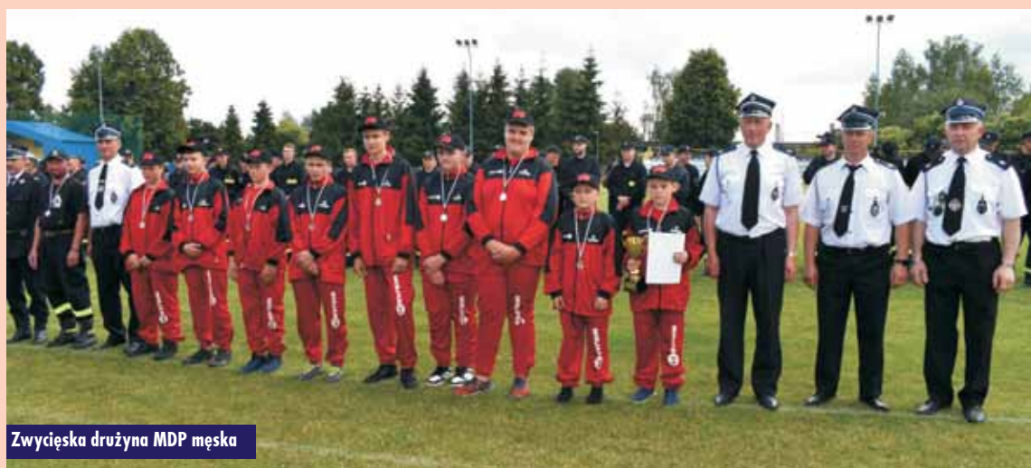
Zwycięska drużyna MDP męska