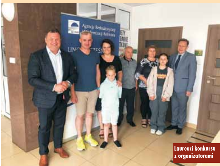
Laureaci konkursu z organizatorami

Podpisanie umowy na wdrożenie kolejnego etapu projektu „E-usługi publiczne dla mieszkańców miasta i gminy Kępno”