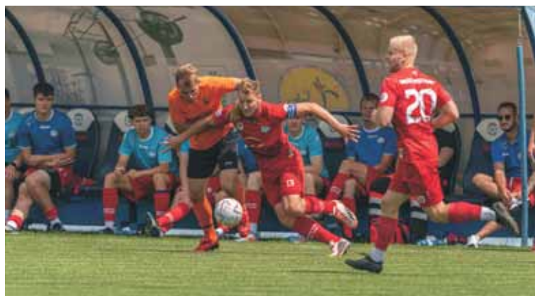
Warta Międzychód przegrała u siebie finał baraży z Pogonią Łobżenica i po 15. sezonach pożegnała się z czwartą ligą.

trafieniami. Losy meczu wyjaśniły się dopiero w samej końcówce. Najpierw w 78. minucie z rzutu karnego do wyrównania doprowadził Rafał Kubacki . Ale bohaterem meczu został Jan