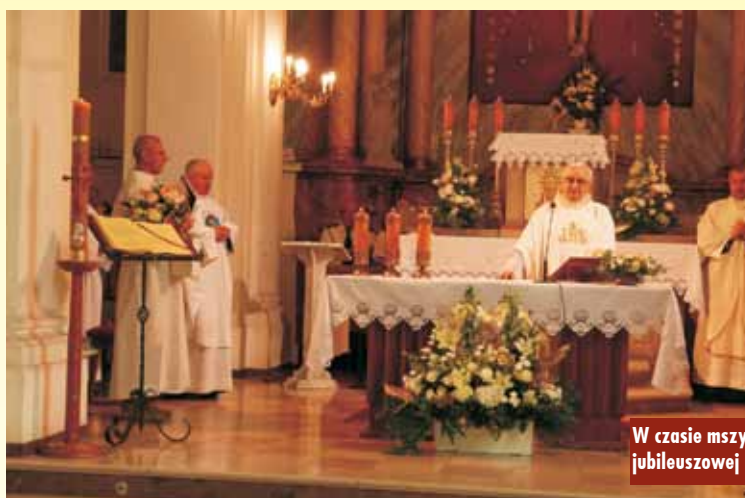
W czasie mszy jubileuszowej