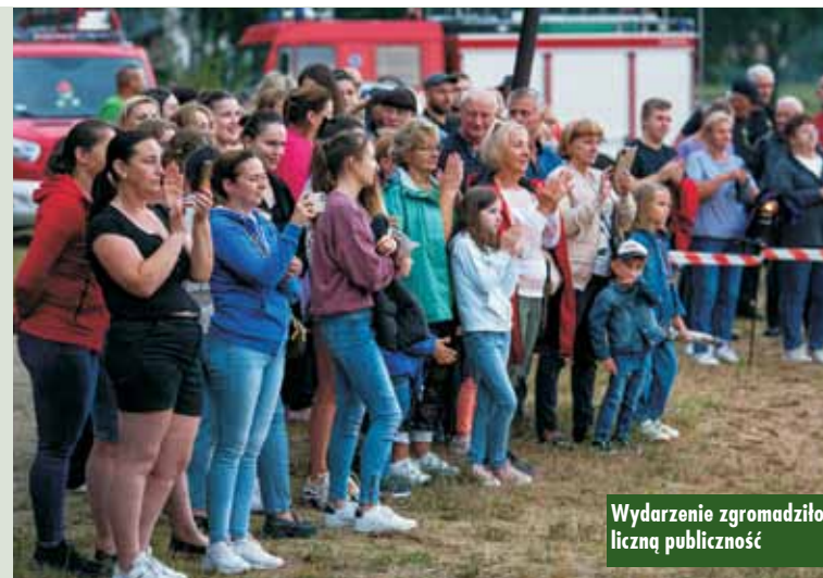
Wydarzenie zgromadziło liczną publiczność

Tegoroczne wydarzenie zorganizowane zostało przez Stowarzyszenie „Otwarte drzwi”, zrzeszające absolwentów i nauczycieli z SP Mikorzyn, Gminę Kępno, Kępiński Ośrodek