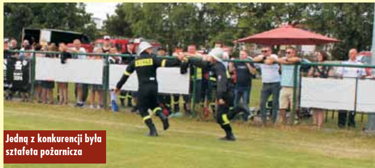
Jedną z konkurencji była sztafeta pożarnicza