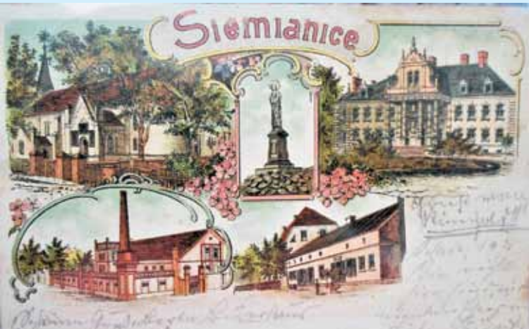
Nr 1. Opis pocztówek w tekście przy zamieszczonym numerze

przede wszystkim zbieram wszelkie pamiątki związane z moją rodzinną gminą. Są to zabawki, zegarki, monety, medale, odznaki, bombki choinkowe, fotografie, pisma urzędowe, listy i, oczywiście, pocztówki.