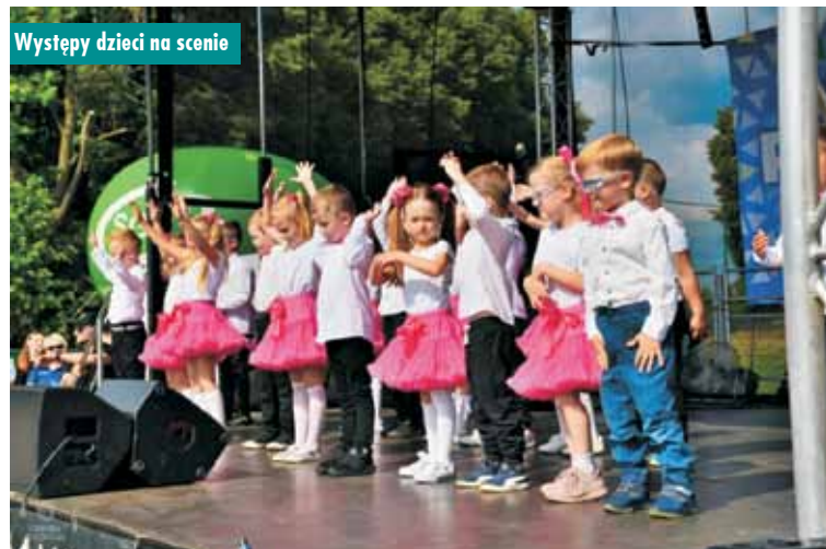
Występy dzieci na scenie