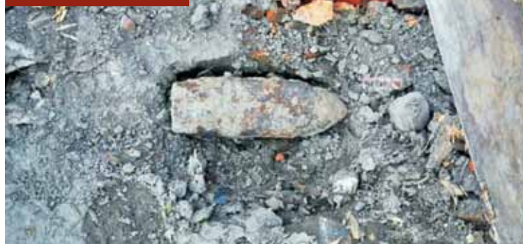
Pocisk przeciwpancerny znaleziony w Kozie Wielkiej...

ny światowej. W lesie pod Darnowcem znaleziono natomiast radziecki granat moździerzowy (50 mm) z zapalnikiem, również z okresu II wojny światowej. Na miejsce przybyli saperzy z Brzęgu, aby zabrać i zdetonować niewybuchy. - W wielu miejscach jeszcze dziś możemy natknąć się na pozostałości minionej wojny, resztki składów amunicji, granaty, miny, pociski moździerzowe, bomby lotnicze, amunicję – jednym słowem, niewypały i niewybuchy,