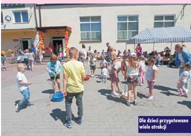
Dla dzieci przygotowano wiele atrakcji