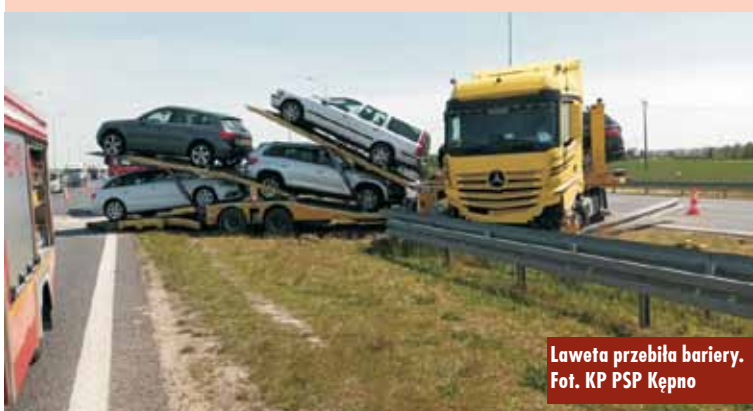
Laweta przebiła bariery.