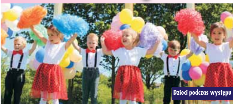
Dzieci podczas występu

3 czerwca br. na placu przy Przedszkolu „Kwiaty Polskie” w Bralinie odbył się festyn rodzinny. Zabawa rozpoczęła się występami