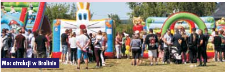
Moc atrakcji w Bralinie

dmuchane zamki, fotobudka i malowanie twarzy. Nie zabrakło również stoiska z watą cukrową i popcornem. Była to doskonała okazja do integra-