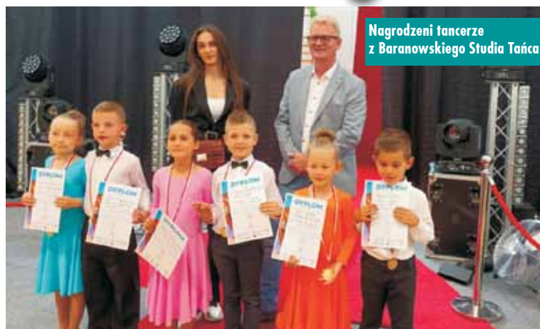
Nagrodzeni tancerze z Baranowskiego Studia Tańca