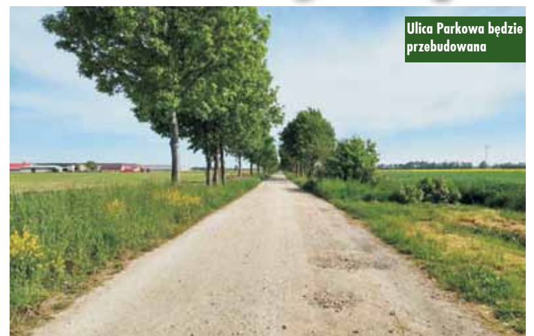
Ulica Parkowa będzie przebudowana

Spotkanie seniorów z Koła Emerytów, Rencistów i Inwalidów z Łęki Opatowskiej