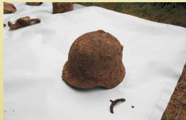
Znaleziony wśród szczątków hełm niemiecki