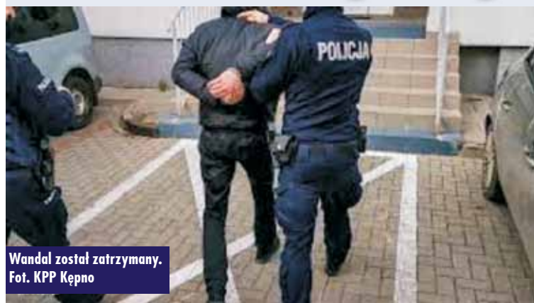
Wandal został zatrzymany.

2 czerwca br., o godzinie 19.40, dyżurny Komendy Powiatowej Policji w Kępnie otrzymał zgłoszenie, że na terenie jednej z posesji w Rychtalu nieznaną mężczyznę dokonano zniszczenia mienia w postaci wybicia wszystkich szyb w samochodzie osobowym marki Fiat oraz wybił szybę w oknie i drzwiach wejściowych w budynku, należącym do gminy Rychtal. - Wysłani na miejsce policjanci wykonali niezbędne czynności procesowe, zabezpieczyli wszystkie ślady, przesłuchano świadków oraz zabezpieczono monitoringi. Wszystkie podjęte działania miały na celu