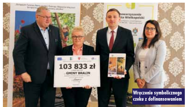
Wręczenie symbolicznego czeku z dofinansowaniem

Zadanie będzie realizowane w ramach poddziałania „Wsparcie na wdrażanie operacji w ramach strategii rozwoju lokalnego kierowanego przez społeczność” w ramach działa-