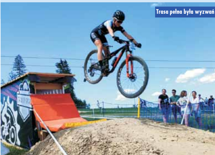
Trasa pełna była wyzwań

Festyn rodzinny w Przedszkolu „Kwiaty Polskie” w Bralinie