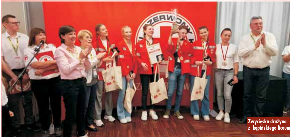
Zwycięska drużyna z kępińskiego liceum