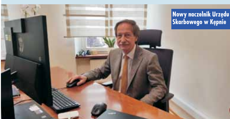
Nowy naczelnik Urzędu Skarbowego w Kępnie

Najwięcej milionerów, bo aż 99%, rozlicza się w ramach PIT-36L. Są to głównie przedsiębiorcy płacący podatek liniowy.