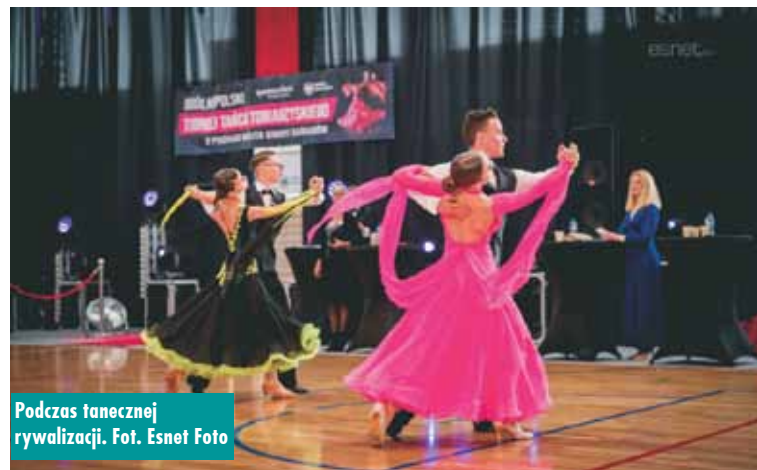
Podczas tanecznej rywalizacji.