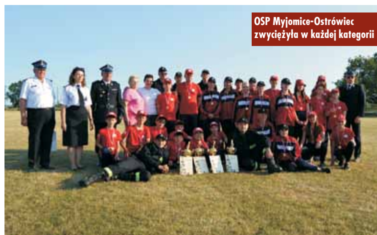
OSP Myjomicze-Ostrówiec zwyciężyła w każdej kategorii

4 czerwca br. w Myjomicach odbyły się Gminne Zawody Sportowo-Pożarnicze. W zmaganiach rywalizowały jednostki Ochotniczych Straży Pożarnych z terenu gminy Kępno. Uczestnicy zmagali się z ćwiczeniem bojowym i sztafetą pożarniczą. W zawodach startowali seniorzy, seniorki i Młodzieżowe Drużyny Pożarnicze.