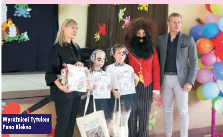
Wyróżnieni Tytułem Pana Kleksa