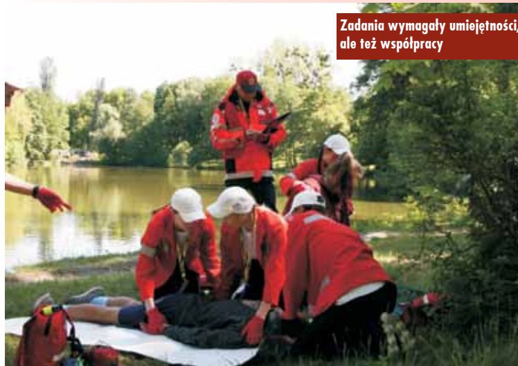
Zadania wymagały umiejętności, ale też współpracy

W Cafe Club Polonia odbył się zjazd absolwentów rocznika maturalnego 1978