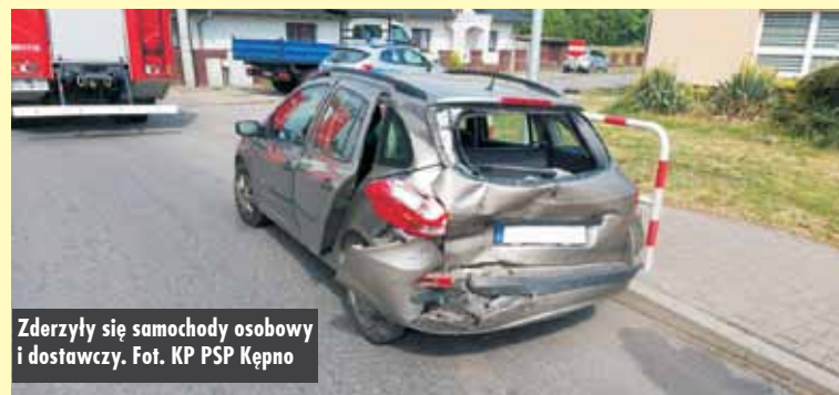
Zderzyły się samochody osobowy i dostawczy.

poinformował kpt. Jakub Sobczak z KP PSP Kępno. Oprac. KR