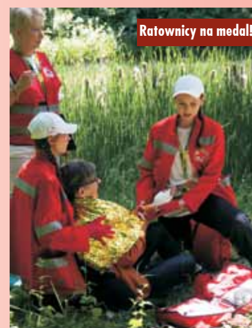
Ratownicy na medal!

Ostatecznie po 6 godzinach zmagania i podsumowaniu zawodów, krótko przed północą, sędziowie ogłosili wyniki. Drużyna z Kępna uzyskała