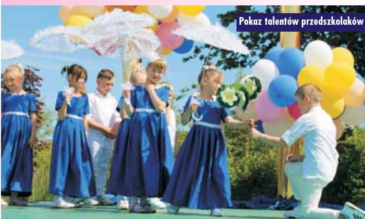
Pokaz talentów przedszkolaków