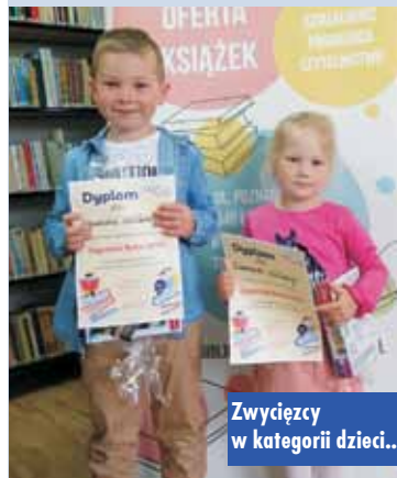
Zwycięzcy w kategorii dzieci...

Z okazji trwającego w dniach 8-15 maja 2023 r. Tygodnia Bibliotek w Gminnej Bibliotece Publicznej w Łęce Opatowskiej z siedzibą w Opatowie oraz w Filii w Łęce Opatowskiej i Siemianicach odbyło się wręczenie nagród laureatom konkursu „Czytelnik Roku 2022”, który to na stałe wpisał się w działalność biblioteki. Do konkursu zostali wytypo-