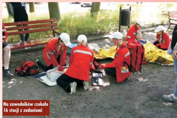
Na zawodników czekało 16 stacji z zadaniami

Awans do etapu centralnego wymagał zwycięstwa na etapie rejonowym, który odbył się w Kaliszu, oraz na etapie wojewódzkim, zorganizowanym na terenie Parku Cytadela w Poznaniu.