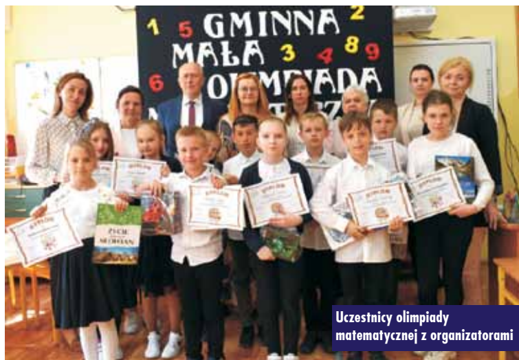
Uczestnicy olimpiady matematycznej z organizatorami