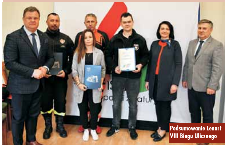
Podsumowanie Lenart VIII Biegu Ulicznego

Podczas spotkania premierę miał film, który został nakręcony, aby uchwycić najpiękniejsze momenty Lenart VIII Biegu Ulicznego o Puchar Starosty Kępińskiego. Oprac. m