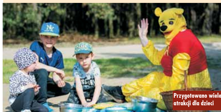
Przygotowano wiele atrakcji dla dzieci