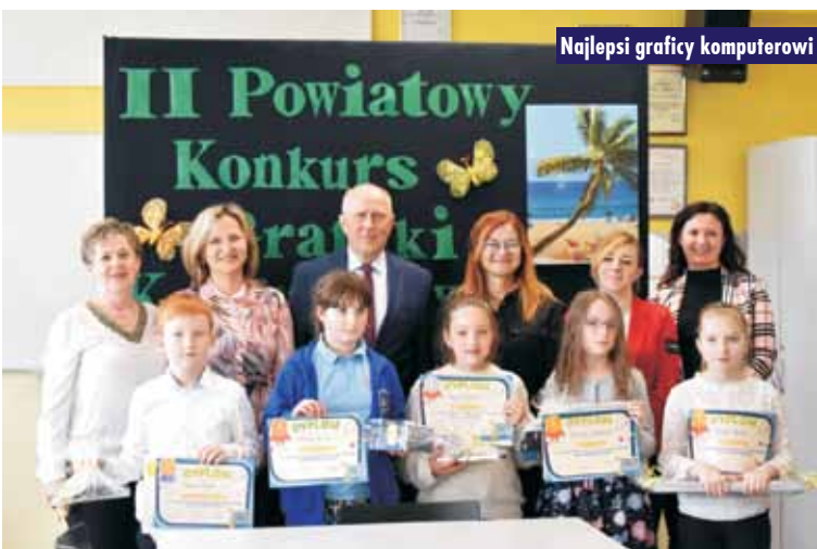
Najlepsi graficy komputerowi

Kongres Wielkopolska Sercem Europejskiej Przedsiębiorczości