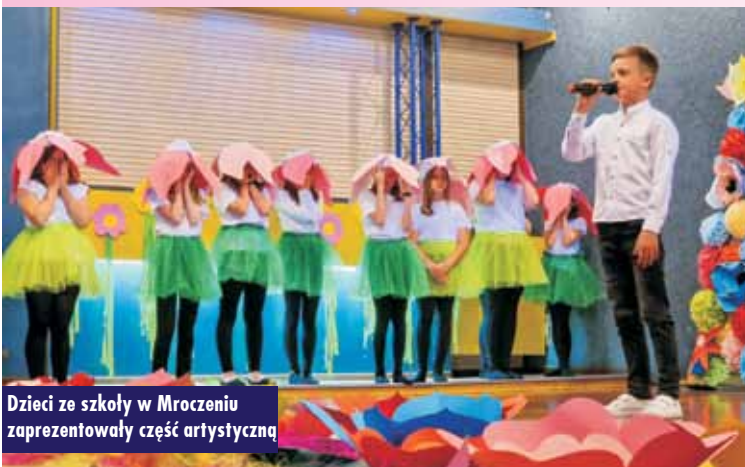
Dzieci ze szkoły w Mroczeniu zaprezentowały część artystyczną

się łąka pełna tańczących kwiatów. Dzieci zaprezentowały przedstawienie, dotyczące najpiękniejszego kwiatu na ziemi – Matki. Dziewczynki przez ostatni miesiąc intensywnie i ciężko pracowały nad tańcem – tak współczesnym, jak i klasycznym, baletowym, by pokazać piękno bycia mamą, jej wszystkie etapy w życiu – od wyczekiwania, narodzin dziecka, po trud wychowania, podczas okresu dojrzewania swojej pociechy, bycia partnerką w życiu dorosłym, syna czy córki, aż w końcu moment, w którym samodzielnie będą musiały poradzić sobie w dorosłym życiu. Nie ma znaczenia, czy matka jest współczesną, wyzwoloną kobietą, pracującą w korporacji, czy taką klasyczną, która serwuje dzieciom bezpieczeń-