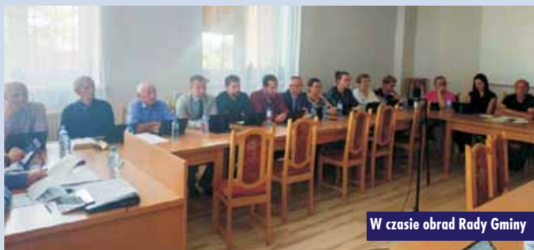
W czasie obrad Rady Gminy

polegających na montażu systemu sygnalizacji pożaru wraz z transponderem GPRS, w kościele filialnym pod wezwaniem św. Filipa i Jakuba