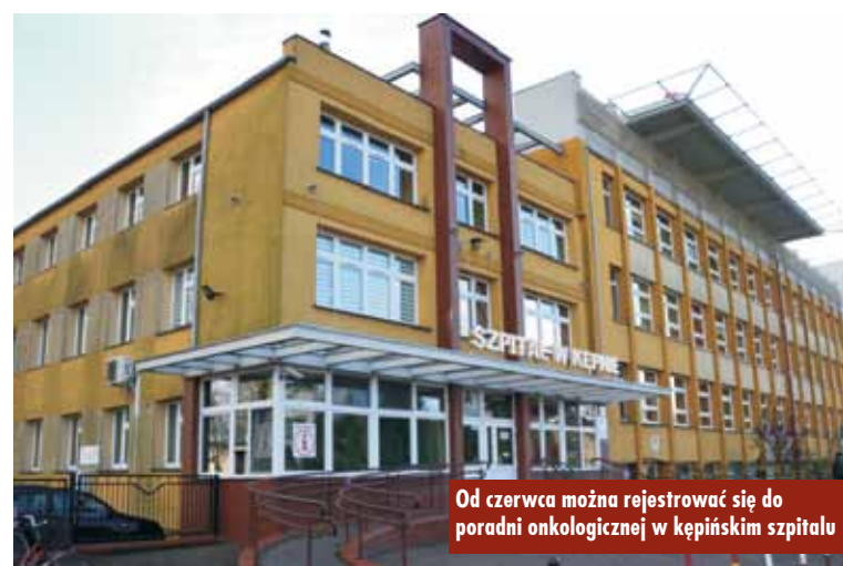
Od czerwca można rejestrować się do poradni onkologicznej w kępińskim szpitalu