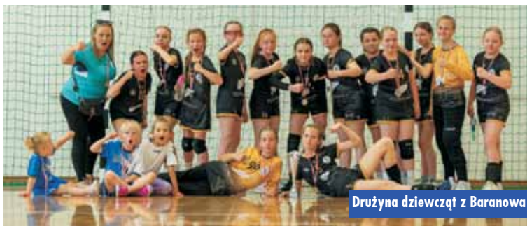
Drużyna dziewcząt z Baranowa