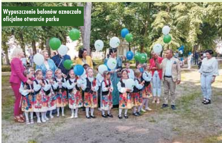
Wypuszczenie balonów oznaczało oficjalne otwarcie parku