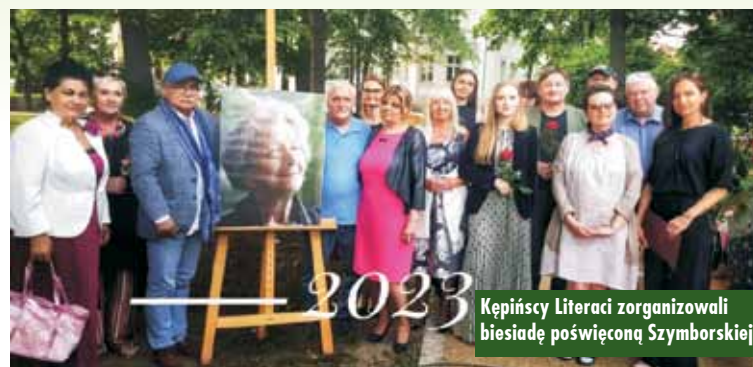
Kępińscy Literaci zorganizowali biesiadę poświęconą Szymborskiej