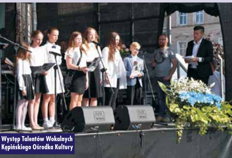
Występ Talentów Wokalnych Kępińskiego Ośrodka Kultury