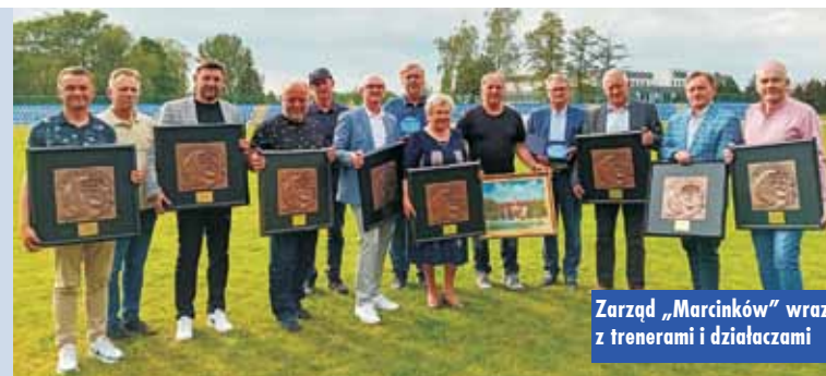
Zarząd „Marcinków” wraz z trenerami i działaczami