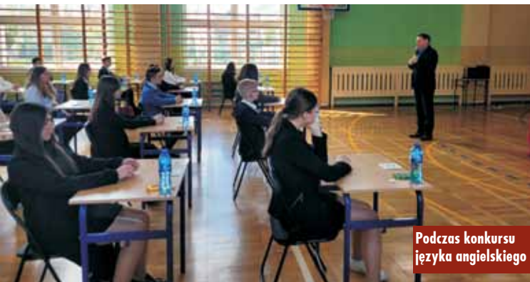
Podczas konkursu języka angielskiego