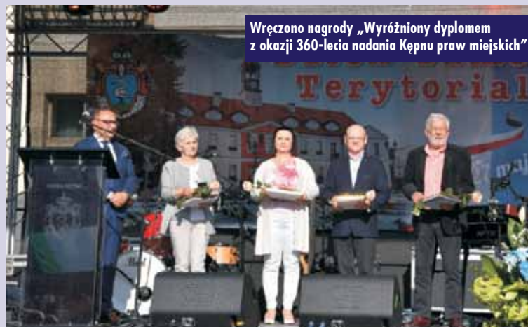
Wręczono nagrody „Wyróżniony dyplomem z okazji 360-lecia nadania Kępnu praw miejskich”