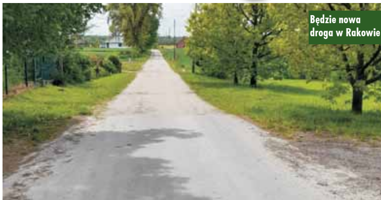
Będzie nowa droga w Rakowie

Gmina Łęka Opatowska otrzymała dofinansowanie ze środków budżetu Województwa Wielkopolskiego w wysokości 98 000 zł na przebudowę dróg dojazdowych do gruntów rolnych. Zgodnie ze złożonym wnioskiem, w tym roku środki te zostaną przeznaczone na przebudowę drogi w Rakowie. Dzięki dofinansowaniu oraz przy udziale środków własnych zostanie wykonana nawierzchnia asfaltowa na odcinku drogi o długości 410 m i szerokości 4 m. Oprac. m