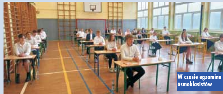
W czasie egzaminu ósmoklasistów

jest określony żaden minimalny próg zdawalności. Od ich wyniku zależy