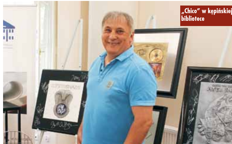
„Chico” w kępińskiej bibliotece