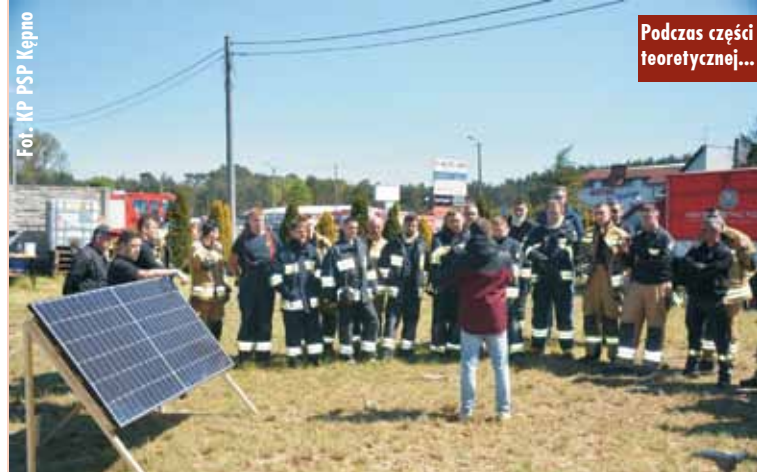
Podczas części teoretycznej...

Dzięki obecności przedstawicieli firm dystrybuujących sprzęt do jednostek PSP i OSP, na ćwiczeniach była możliwość przetestowania aparatów ochrony układu oddechowego, kamer termowizyjnych oraz armatury pożarniczej. Ponadto na miejscu obecny był również przedstawiciel firmy zajmującej się profesjonalnym