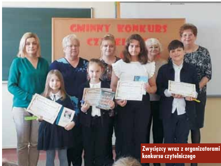
Zwycięzcy wraz z organizatorami konkursu czytelniczego

28 kwietnia 2023 r. w Zespole Szkół w Trzcinicy odbył się Gminny Konkurs Czytelniczy o tytuł „Mistrza Pięknego Czytania”. W konkursie wzięli udział uczniowie ze szkoły podstawowej w Laskach i Trzcinicy. Konkurs odbywał się w trzech kategoriach wiekowych klas: III, IV i V.