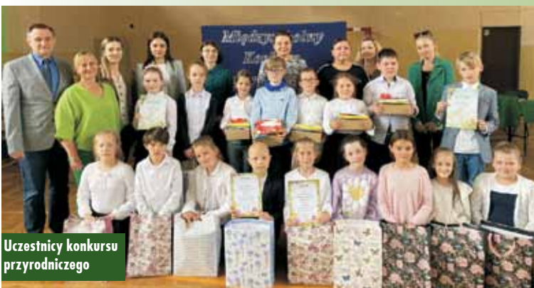
Uczestnicy konkursu przyrodniczego