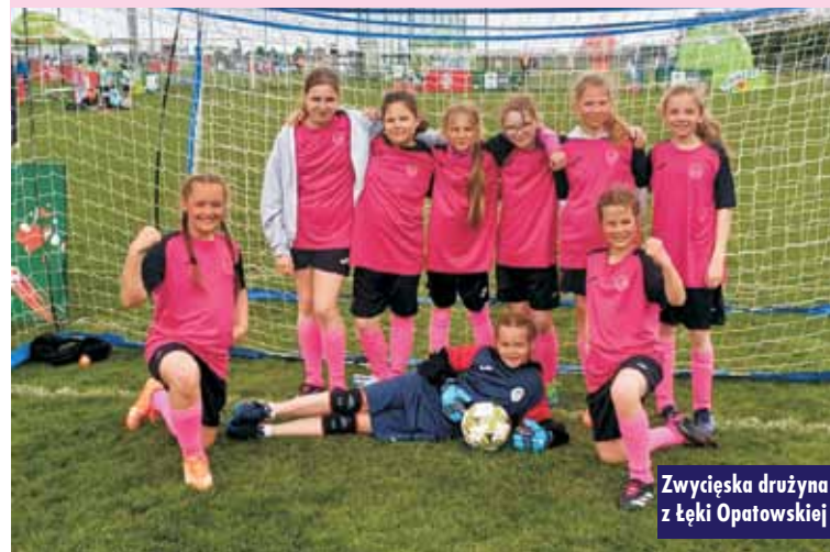
Zwycięska drużyna z Łęki Opatowskiej