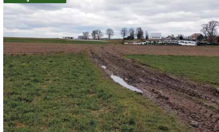
Polna droga w Miechowie