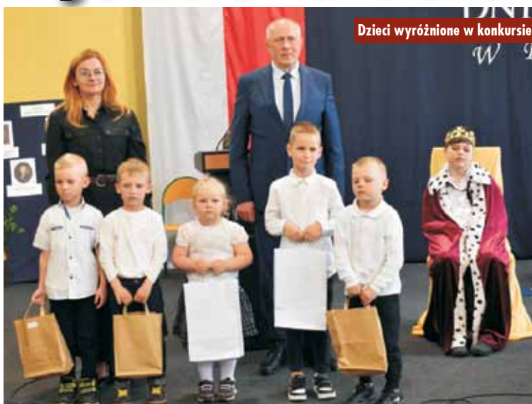
Dzieci wyróżnione w konkursie

4 maja 2023 r. w Urzędzie Gminy Trzcinica odbyło się rozstrzygnięcie konkursu ogłoszonego przez