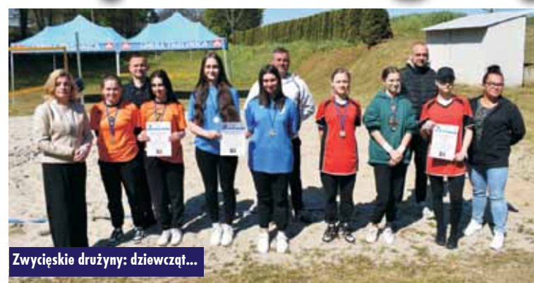
Zwycięskie drużyny: dziewcząt...

9 i 10 maja 2023 r. w Kuźnicy Trzcińskiej odbyły się rozgrywki piłki siatkowej plażowej dziewcząt i chłopców w ramach Mistrzostw Powiatu Młodzieży Szkolnej. Do eliminacji przystąpiły po 3 pary w kategorii dziewcząt i chłopców. Pierwsze miejsce w kategorii dziewcząt zdobyły reprezentantki ze Szkoły Podstawowej w Trębaczowie, drugie miejsce zajęła drużyna ze Szkoły Podstawowej w Trzcinicy, a trzecie