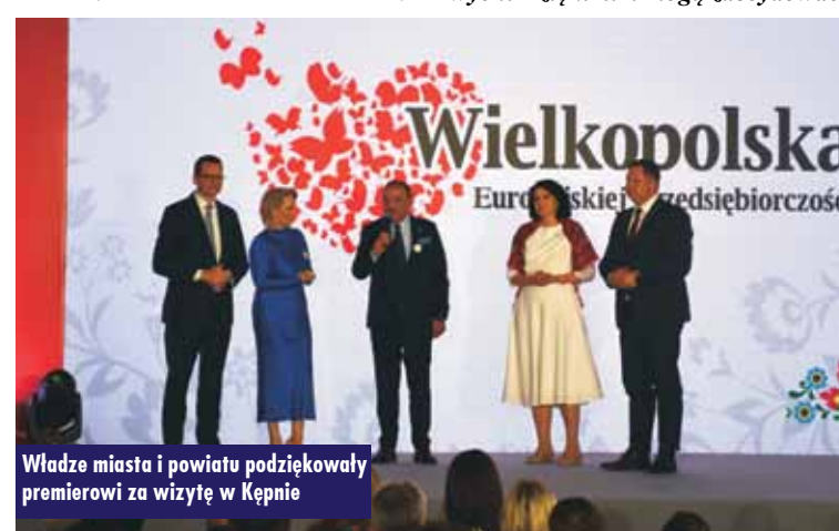
Władze miasta i powiatu podziękowały premierowi za wizytę w Kępnie

W kolejnym forum dyskusyjnym – „Polska wieś & przedsiębiorczość & zdrowie”, prowadzonym przez poseł