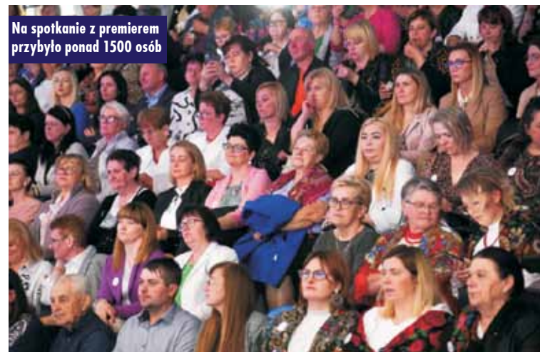
Na spotkanie z premierem przybyło ponad 1500 osób