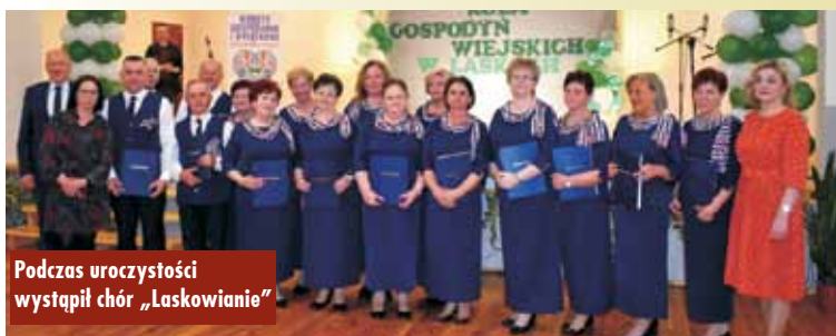
Podczas uroczystości wystąpił chór „Laskowianie”