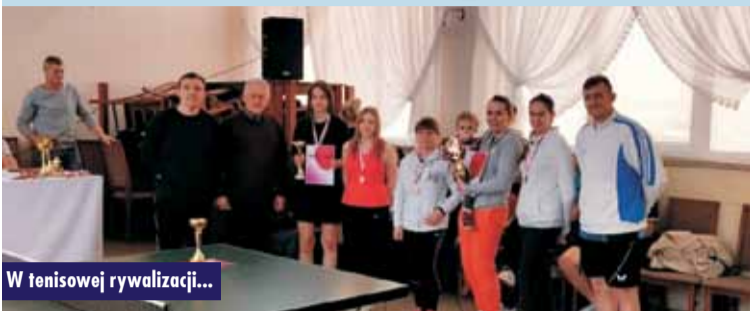
W tenisowej rywalizacji...