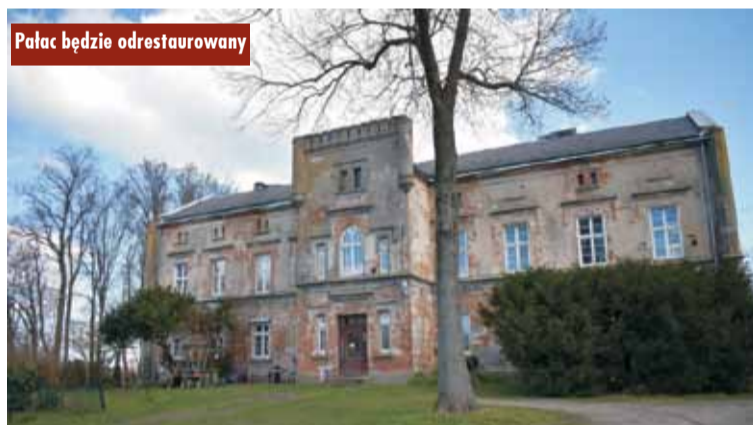
Pałac będzie odrestaurowany

Gmina Trzcinica złożyła wnio- ski o dofinansowanie w ramach Rządowego Programu Odbudowy Zabytków. Wnioski dotyczą trzech