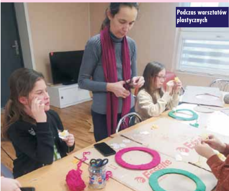
Podczas warsztatów plastycznych