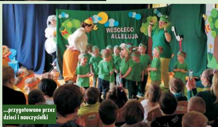
...przygotowane przez dzieci i nauczycielki