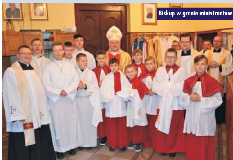
Biskup w gronie ministrantów