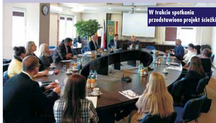
W trakcie spotkania przedstawiono projekt ścieżki

W ramach projektu Centrum Wsparcia Doradczego 4 kwietnia 2023 roku w Starostwie Powiatowym w Namysłowie odbyło się spotkanie „Forum Wymiany Doświadczeń” dla „Partnerstwa 307”. W spotkaniu udział wzięli przedstawiciele Mi- nisterstwa Funduszy i Polityki Re- gionalnej, przedstawiciele Urzędu Marszałkowskiego Województwa Opolskiego, przedstawiciele Fundacji Fundusz Współpracy oraz przed- stawiciele samorządów członków partnerstwa. Gminę Trzcinica