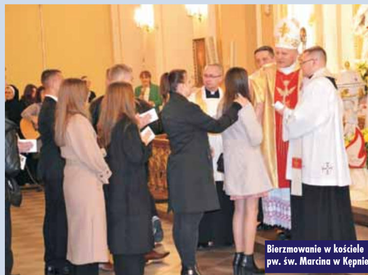
Bierzmowanie w kościele pw. św. Marcina w Kępnie