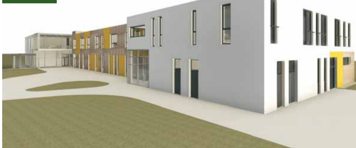
Wizualizacja szpitala po rozbudowie

zamknięcie inwestycji do końca bieżącego roku – dodaje.