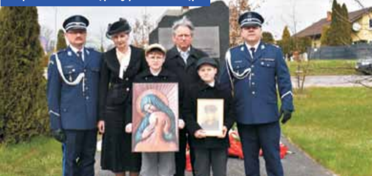
Policjanci wraz z rodziną poległych.