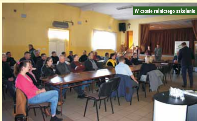
W czasie rolniczego szkolenia

Dzień Pamięci Ofiar Zbrodni Katyńskiej w gminie Trzcinica