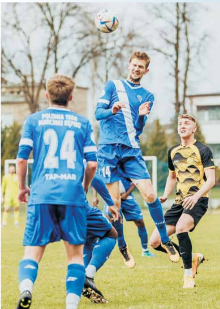
To będzie trudna końcówka sezonu dla drużyny z Alei Marcinkowskiego. Kępniaki w arcyważnym meczu z Polonią Leszno nie mogą sobie pozwolić na stratę punktów.