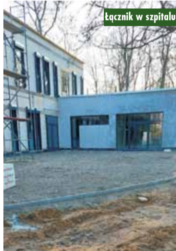
Łącznik w szpitalu

Zapytany, czy prawdą jest, że są szanse na dodatkowe środki zewnętrzne przy dokończeniu inwestycji, starosta odpowiada: - Jak już wspominałem wcześniej, o dofinansowanie na zakup sprzętu i wyposażenia medycznego dla etapu I, obejmującego parter budynku, SPZOZ w Kępnie wystąpił do Urzędu Marszałkowskiego. Wniosek znajduje się obecnie na etapie oceny - wyjaśnia.