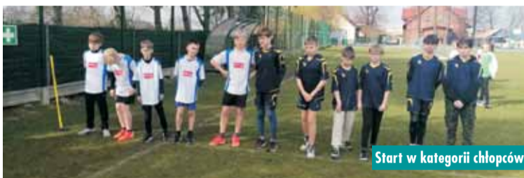
Start w kategorii chłopców

31 marca br. w Łęce Opatowskiej odbyły się Mistrzostwa Gminy w Indywidualnych i Drużynowych Biegach Przełajowych w ramach „XXIV Igrzysk Dzieci 2022/2023” i „XXIV Młodzieży Szkolnej 2022/2023”.