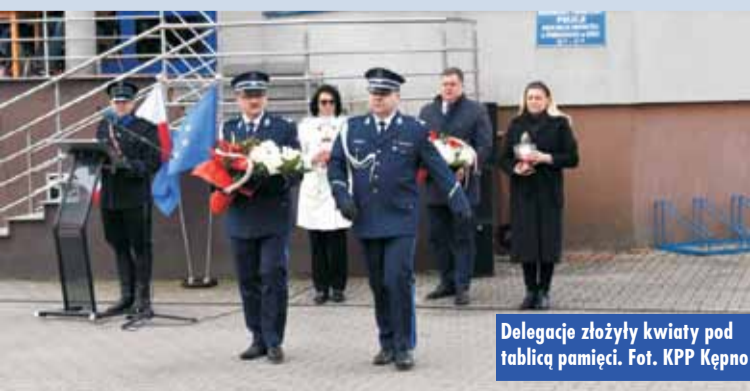
Delegacja złożyła kwiaty pod tablicą pamięci.