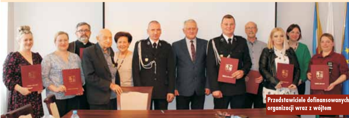
Przedstawiciele dofinansowanych organizacji wraz z wójtem