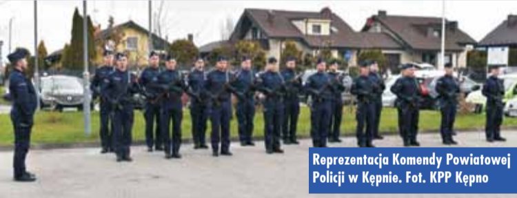
Reprezentacja Komendy Powiatowej Policji w Kępnie.

Punktem kulminacyjnym było niezwykle podniosłe odczytanie apelu poległych. Następnie pod pomnikiem złożono symboliczne wiązanki kwiatów.