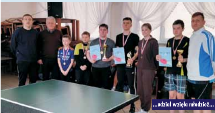
...udział wzięła młodzież...