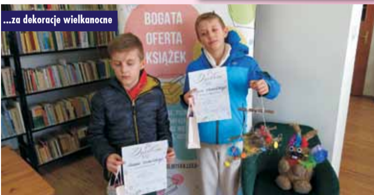
...za dekoracje wielkanocne

5 kwietnia w Szkole Podstawowej im. Kardynała Stefana Wyszyńskiego uczniowie w ramach zajęć z języka angielskiego wykonali kapelusze wielkanocne tzw. Easter Bonnets