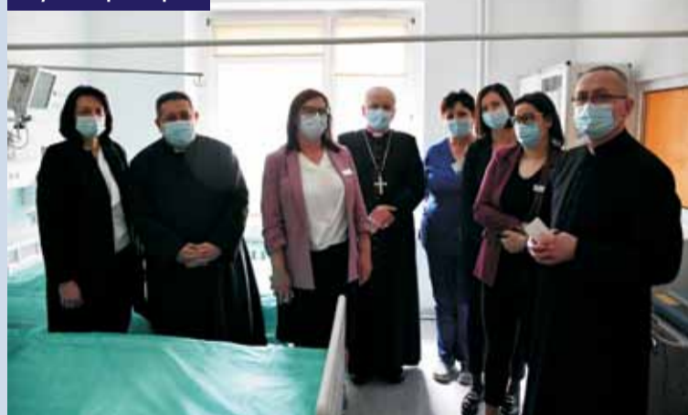
Wizyta biskupa w szpitalu