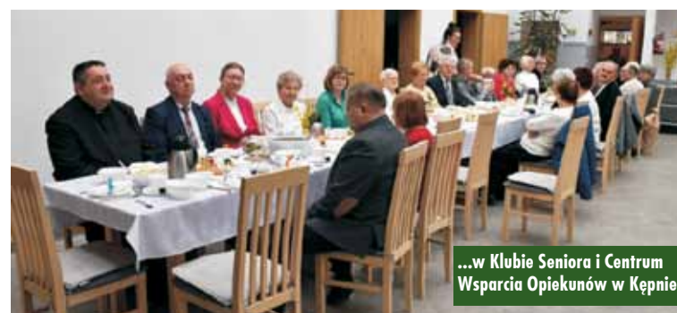
...w Klubie Seniora i Centrum Wsparcia Opiekunów w Kępnie