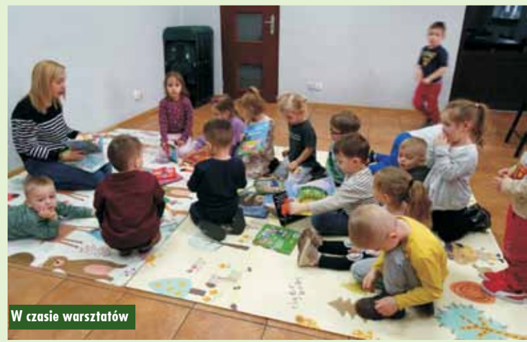
W czasie warsztatów