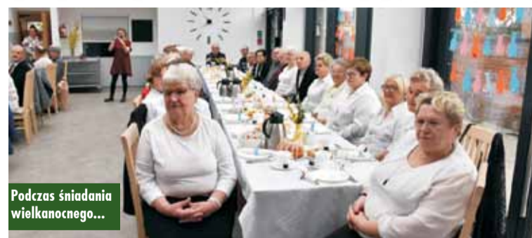
Podczas śniadania wielkanocnego...