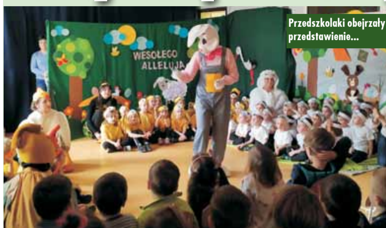
Przedkolaki obejrzały przedstawienie...