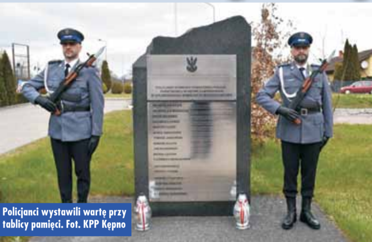
Policjanci wystawili wartę przy tablicy pamięci.

13 kwietnia br. na placu Komendy Powiatowej Policji w Kępnie odbyły się apel poświęcony 83. rocznicy Sowieckiej Zbrodni na Policjantach Policji Państwowej II RP. W 2015 r. odsłonięto tam tablicę Pamięci Policjantów Komendy Powiatowej Policji Państwowej w Kępnie Zamordowanych w Sowieckich i Hitlerowskich Obozach Zagłady, na której znajdują się nazwiska kilkunastu kępińskich