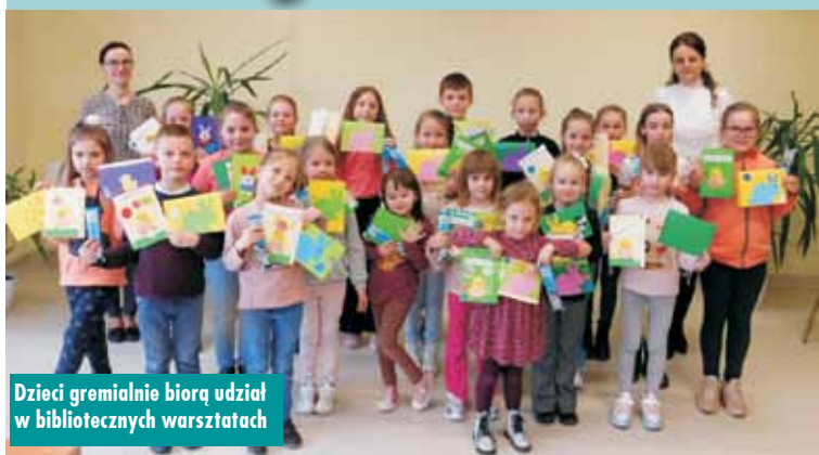
Dzieci gremialnie biorą udział w bibliotecznych warsztatach