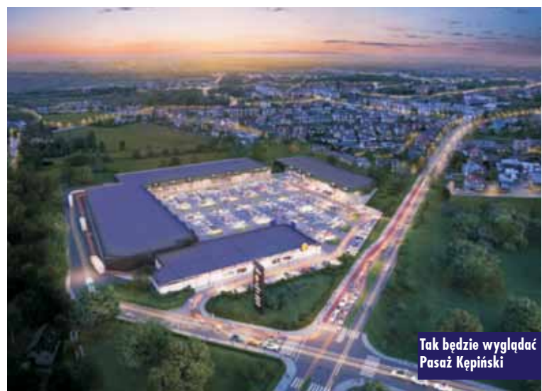
Tak będzie wyglądać Pasaż Kępiński

najemcy, z drugiej wsluchujemy się w potrzeby lokalnych społeczności. Dzięki temu budujemy tenant-mix, który jest atrakcyjny dla klientów, a równocześnie przynosi zyski naszym najemcom. Nasze doświadczenie i wypracowane schematy działania pozwalają nam sprawnie realizować plany inwestycyjne zgodnie z założeniami – podkreśla prezes. Dla zmotoryzowanych przygotowany zostanie parking na około 400 pojazdów. Na terenie parku powstanie także stacja ładowania pojazdów elektrycznych. - To, co charakteryzuje okoliczne gminy, to niski poziom bezrobocia i stosunkowo wysoka siła nabywcza mieszkańców. Baranów to jedna z najzamożniejszych gmin w całej