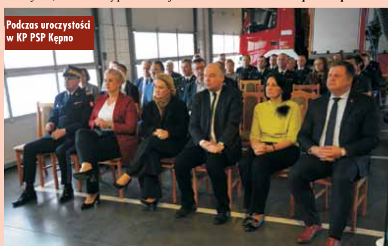
Podczas uroczystości w KP PSP Kępno

W skali kraju do jednostek trafi 675 pojazdów, wśród nich samochody bojowe lekkie, ciężkie i średnie. Najwięcej z nich trafi na Mazowsze, Wielkopolska znalazła się na drugim miejscu z dofinansowaniem na zakup 61 pojazdów. - Od 2016 r. do wielkopolskich jednostek Ochotniczych Straży Pożarnych trafiły 233 nowe samochody ratowniczo-gaśnicze plus 61 nowych samochodów, które oddajemy w tym roku. Kwota, która została przeznaczona na realizację tego zadania, to prawie 300 milionów złotych. To ogromna kwota, bez której nie udało się w tak szybkim tempie rozwijać Krajowego Systemu Ratowniczo-Gaśniczego i ochrony przeciwpożarowej – wskazywał nadbryg. D. Matczak, dziękując za wsparcie jednostek OSP. Wspominał również o pozostałych dotacjach, m.in. na wyposażenie jed-