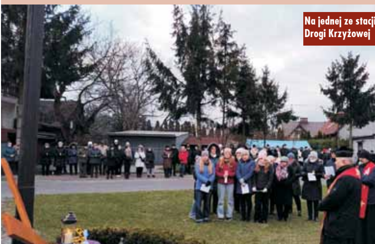
Na jednej ze stacji Drogi Krzyżowej

dzialek, 4 kwietnia br. Organizatorem Drogi Krzyżowej jest od lat parafia pw. św. Anny w Bralinie. Oprac. KR