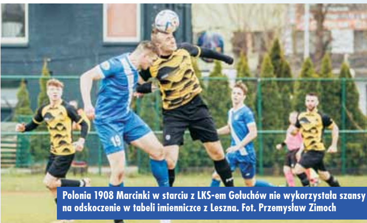
Polonia 1908 Marcinko w starciu z LKS-em Gołuchów nie wykorzystała szansy na odskoczenie w tabeli imiennicze z Leszna.

o ligowy byt. Obydwie ekipy mają po 21 punktów, a walka o utrzymanie na czwartoligowych boiskach zapowiada się nie mniej pasjonująco niż walka o