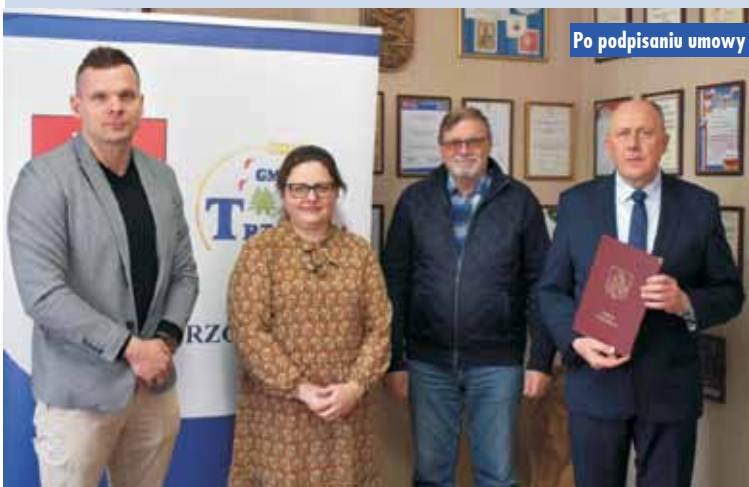
Po podpisaniu umowy

Podpisanie umowy poprzedziło postępowanie o udzielenie zamówienia publicznego, na które wpłynęły 2 oferty w wartościach od 1 799 964,99 zł brutto do 2 121 341,44 zł brutto. Za kwotę 1 799 964,99 zł brutto prace wykona Kępińskie Przedsiębiorstwo Drogowo-Mostowe S.A. Przedmiotem zamówienia jest przebudowa drogi na odcinku 1079 metrów oraz