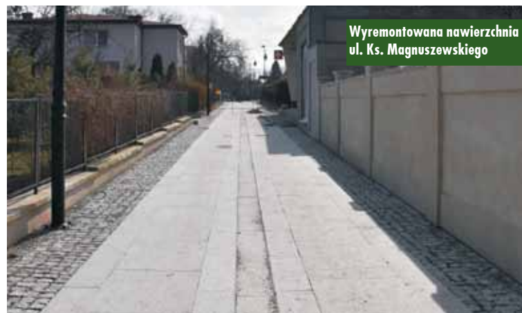
Wyremontowana nawierzchnia ul. Ks. Magnuszewskiego

Przewidziany jest również zakup i montaż koszy na śmieci, stojaków