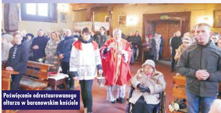
Poświęcenie odrestaurowanego ołtarza w baranowskim kościele

bytkowym wyposażeniem w tym największy ołtarz w drewnianych kościołach w Polsce o wymiarach 8,12 metra wysokości z XVIII wieku oraz renesansowe trzy boczne ołtarze z XVII wieku. Prace konserwacyjne kościoła kosztowały 2 mln. - Wszystko dokonało się dzięki ofiarności wiernych, a także dotacjom z: Unii Europejskiej, Województwa Wielkopolskiego i Starostwa Powiatowego – podsumowuje A. Wawrzyniak.