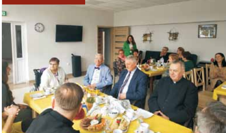
Podczas śniadania wielkanocnego w klubie seniora w Bralinie

W Mnichowicach kulturowana jest starodawna tradycja – skrzekoty