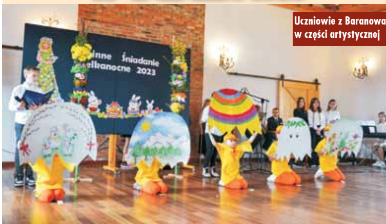
Uczniowie z Baranowa w części artystycznej