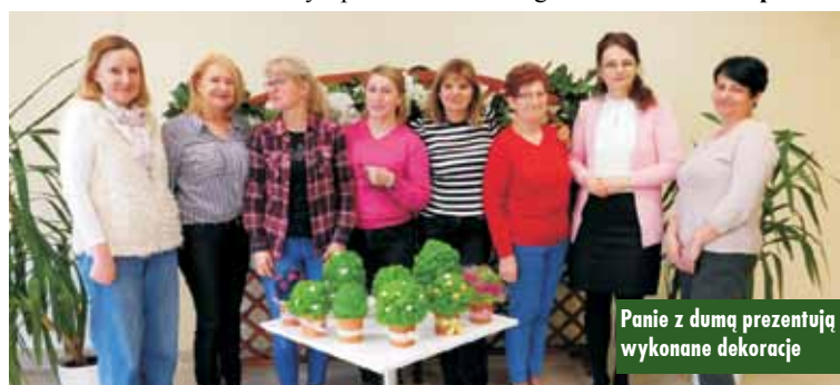
Panie z dumą prezentują wykonane dekoracje