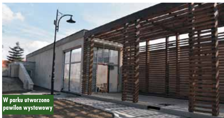
W parku utworzono pawilon wystawowy

oraz nawierzchni sąsiadującej z parkiem ulicy Ks. Magnuszewskiego. Odbiły się też pierwsze próby związane z uruchomieniem oświetlenia parku.