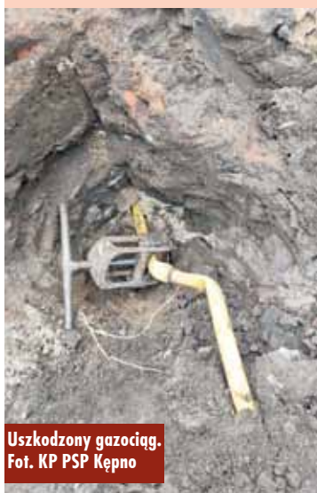
Uszkodzony gazociąg.

4 kwietnia br., około godziny 14.40, do Stanowiska Kierowania Komendanta Powiatowego Państwowej Straży Pożarnej w Kępnie wpłynęło zgłoszenie o uszkodzeniu gazociągu przy ul. Kluczborskiej w Baranowie.