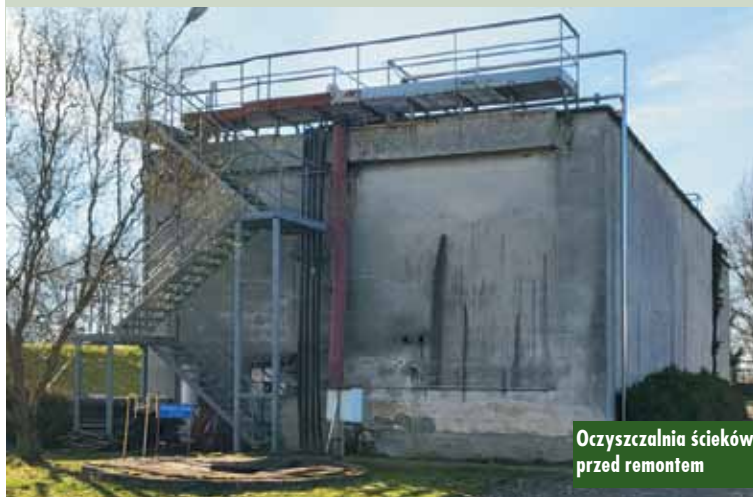
Oczyszczalnia ścieków przed remontem

Koszt inwestycji to 6.429.210 zł brutto, przy czym 4.749.689,44 zł stanowią środki z Rządowego Funduszu Polski Ład: Programu Inwestycji Strategicznych (edycja 2). Oprac. m