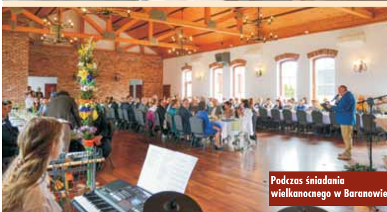
Podczas śniadania wielkanocnego w Baranowie