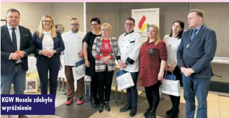
KGW Nosale zdobyło wyróżnienie