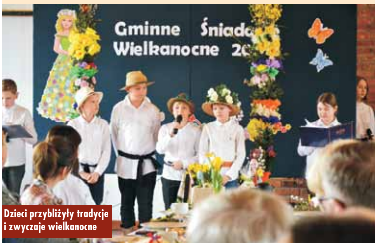
Dzieci przybliżyły tradycje i zwyczaje wielkanocne