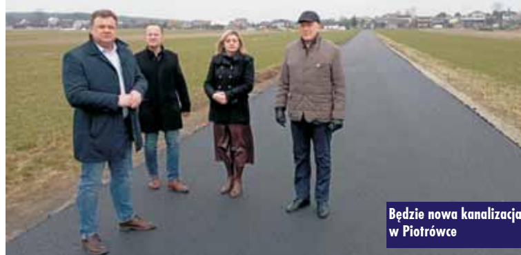
Będzie nowa kanalizacja w Piotrówce

23 marca br. odbyły się kreatywne warsztaty kulturotwórcze w Gminnej Bibliotece Publicznej w Trzcinicy