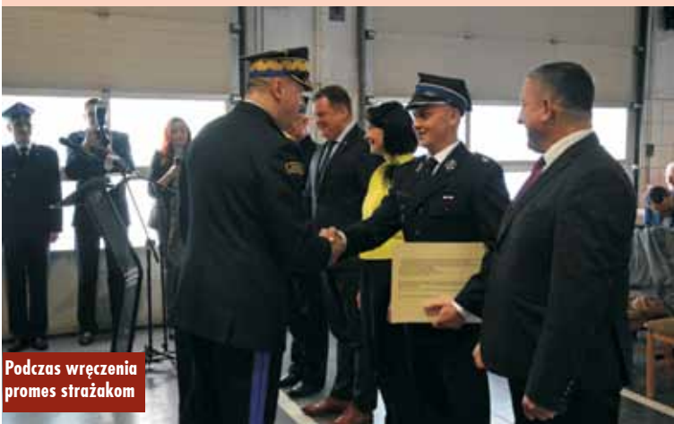
Podczas wręczenia promes strażakom

- Hasło „Bogu na chwałę, ludziom na ratunek” jest wpisane w DNA każdego strażaka, każdej drużyny i druha-ochotnika, którzy na co dzień gwarantują i zabezpieczają zdrowie i życie naszych mieszkańców, każdego sołectwa, gminy, powiatu, naszej pięknej wielkopolskiej ziemi, całej Rzeczypospolitej Polskiej, ale i Europy (...). Z dumą i ogromną satysfakcją słucham słów ogromnego uznania w Parlamencie Europejskim o naszych strażakach – strażakach PSP i druha-ochotnikach. Serce rośnie, bo jesteśmy w Europie przykładem gwarancji bezpieczeństwa, zdrowia, życia i mienia wszystkich obywateli całej Europy (...). Drodzy rycerze świętego Floriana, dziękujemy za to, że jesteście, że trwacie na posterunku, w czujności, służbie, a każdy mieszkaniec może spać bezpiecznie.