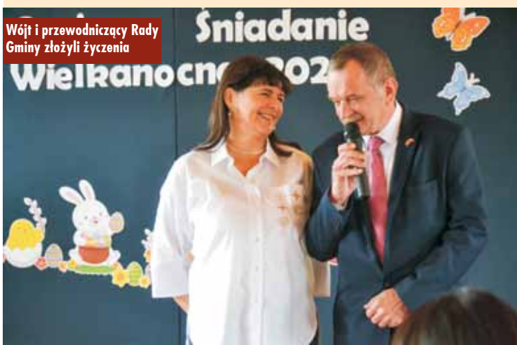
Wójt i przewodniczący Rady Gminy składają życzenia