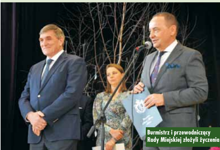
Burmistrz i przewodniczący Rady Miejskiej złożyli życzenia

my z tych świąt, ale też pamiętajmy o naszych braciach z Ukrainy, którzy przeżywają ogromną tragedię i nie mogą w spokoju spędzić tego czasu – mówił wóldarz.