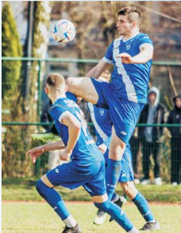
Kępianie nie sprawili niespodzianki w Ostrowie Wielkopolskim. Zupełnie przespana pierwsza połowa zadecydowała o porażce 1:3. Trzeba jednak przyznać, że zwłaszcza w drugiej połowie biało-niebiescy pozostawili po sobie niezłe wrażenie.

strzałem Patryka Kieliby. Patryk Szafran, bramkarz gnieźnieńskiego zespołu, zdołał jednak wyjąć zwycięsko z tego pojedynku. O porażce LKS