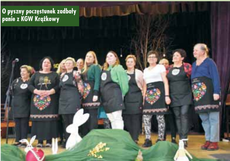
O pyszny poczęstunek zadbały panie z KGW Krążkowy