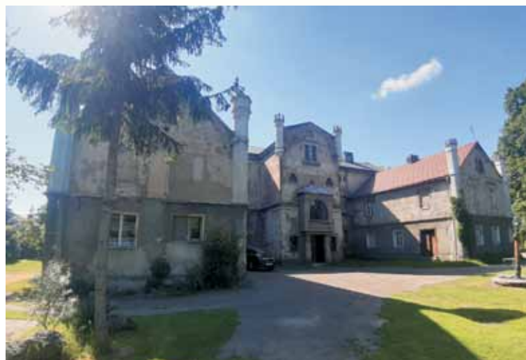
Pałac w Pomianach.

Narodowy Instytut Dziedzictwa, karty ewidencji zabytków powiatu kępińskiego Strony internetowe http://www.kepnasocjum.pl/userphotogallery.php?album_id=46 https://www.powiatkepno.pl/powiat/palace_i_dworki https://www.kepno.pl/206-atrakcje-i-zabytki.html https://www.nid.pl/pl/Informacje_ogolne/Zabytki_w_Polsce/rejestr-zabytkow/zestawienia-zabytkow-nieruchomych/