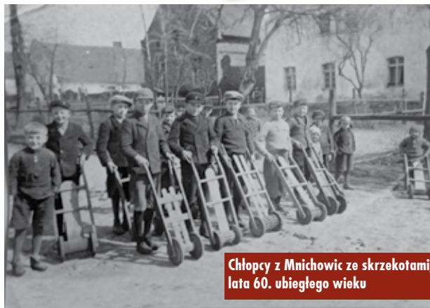
Chłopcy z Mnichowic ze skrzekotami, lata 60. ubiegłego wieku

z nich zostały zapomniane, np.: Gojowa Niedziela. W czwartą niedzielę Wielkiego Postu dzieci chodziły po domach z „gojem”. Była to choineczka przybrana kolorowymi papierkami. Przy wejściu do domu śpiewały: A ta święta Katarzyna miała ojca poganina Dał jej wieżę wybudować i dwa okna wyflotrować A to trzecie sama dała żeby Boga oglądała Włóczyli ją po ulicy, po tej ostrej kamienicy Gdzie Jezusa umęczyli tam jej