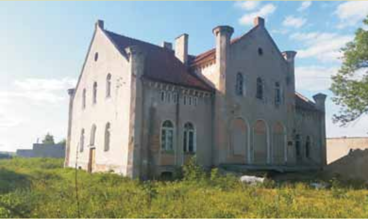
Pałac w Olszowie.

piono do pewnych prac remontowych przy dworku. Wszystkie zabudowania gospodarcze zostały rozebrane. Częściowo zachowano mieszkania służby