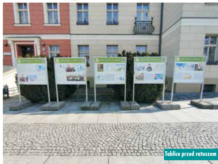
Tablice przed ratuszem

Drodzy Czytelnicy, „Tygodnik Kępiński” można znaleźć także w internecie. Serdecznie zapraszamy na stronę www.tygodnikkepinski.pl oraz na Facebook pod adres www.facebook.com/tygodnikkepinski Zapraszamy do czytania i komentowania!