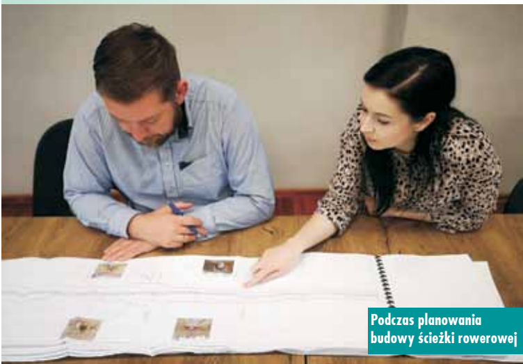
Podczas planowania budowy ścieżki rowerowej

Koło Emerytów i Rencistów w Łęce Opatowskiej zorganizowało śniadanie wielkanocne. Spotkanie odbyło się w miejscowym Domu Strażaka