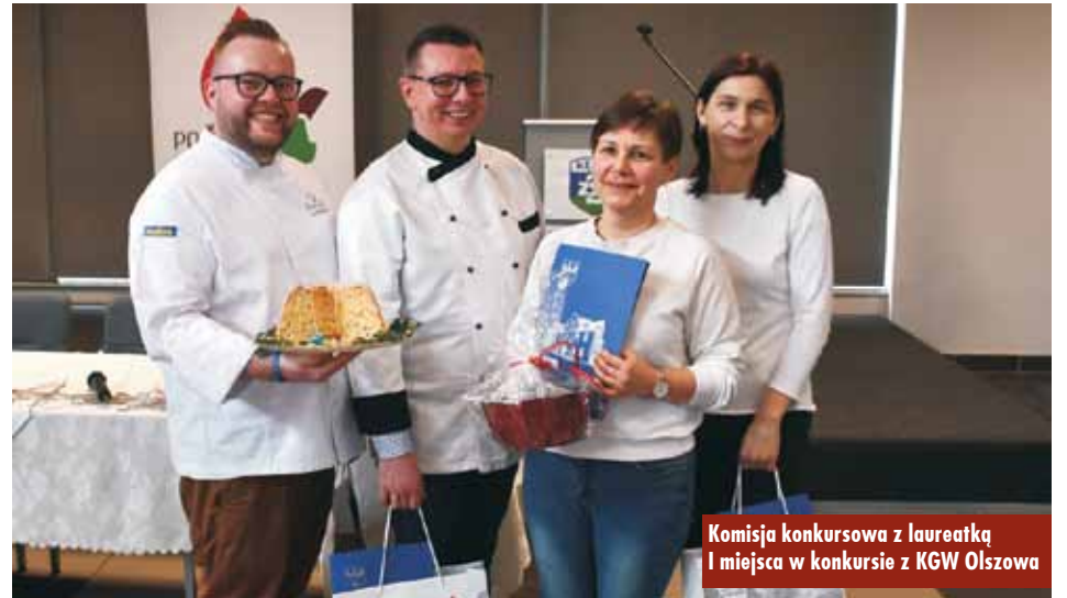
Komisja konkursowa z laureatką I miejsca w konkursie z KGW Olszowa

XVII Rowerowa Droga Krzyżowa „Śladami znaków wiary po Ziemi Ostrzeszowskiej”