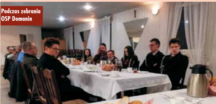
Podczas zebrania OSP Domanin

Policjanci Posterunku Policji w Bralinie dokonali zatrzymania czterech mieszkańców powiatu kępińskiego, którzy posiadali przy sobie znaczną ilość narkotyków