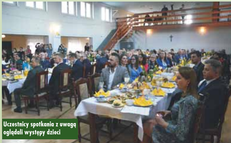
Uczestnicy spotkania z uwagą oglądali występy dzieci