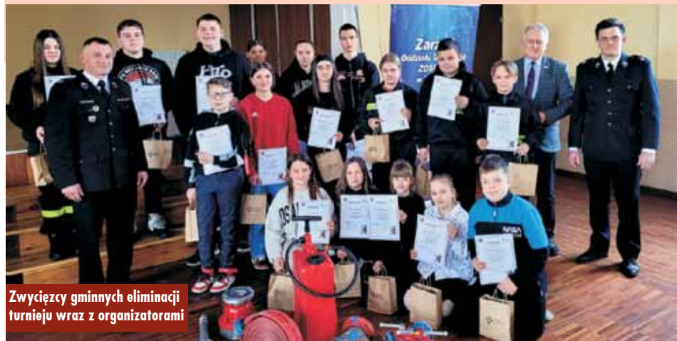
Zwycięzcy gminnych eliminacji turnieju wraz z organizatorami