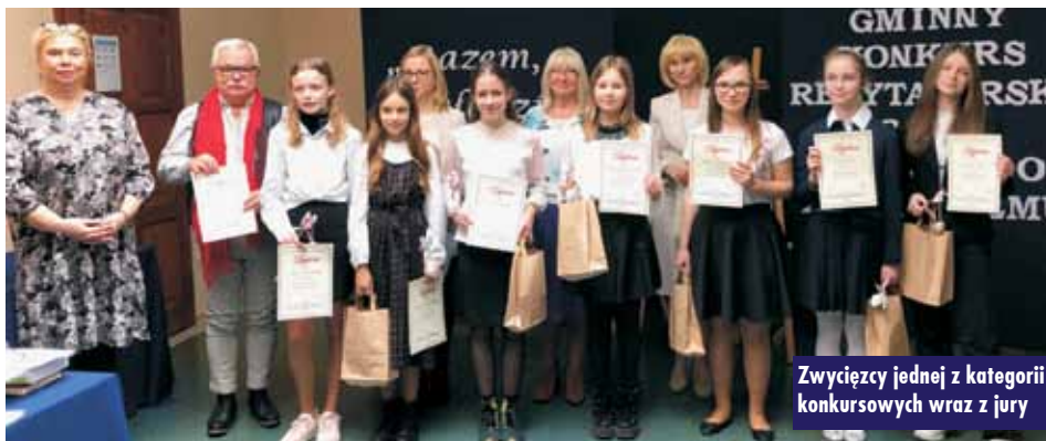
Zwycięzcy jednej z kategorii konkursowych wraz z jury

25 marca br. w Domu Ludowym w Trzciniicy odbyło się gminne śniadanie wielkanocne zorganizowane przez Koło Gospodyń Wiejskich w Trzciniicy oraz Urząd Gminy Trzciniica