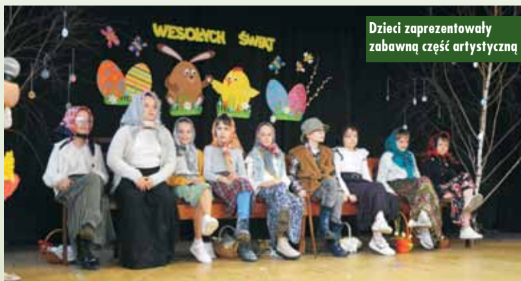
Dzieci zaprezentowały zabawną część artystyczną