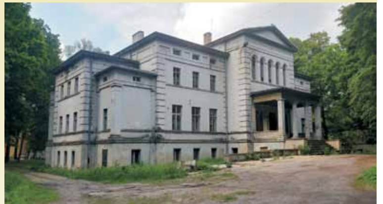
Pałac w Ślupii pod Kępem.

Niestety, nie wszystkie prezentują również taki stopień zachowania. W interesie całego społeczeństwa należy podjąć działania w celu zabezpieczenia i uratowania dla przyszłych pokoleń wszystkich powyżej opisanych zabytków. W tym miejscu należy przytoczyć dwa pozytywne przykłady zadbania o dziedzictwo kulturowe. Jeszcze kilkanaście lat temu dwór w Nosalach i Trzcinicy był mógł zaliczony do listy zapomnianych i zniszczonych dworów. Jednak dzięki zaangażowaniu poszczególnych osób zostały one wyremontowane. Dwór w Aniolkach został tak przebudowany, że utracił on praktycz-