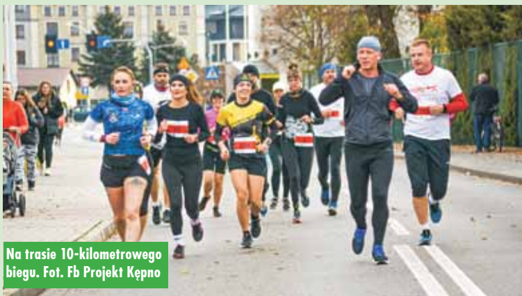
Na trasie 10-kilometrowego biegu.