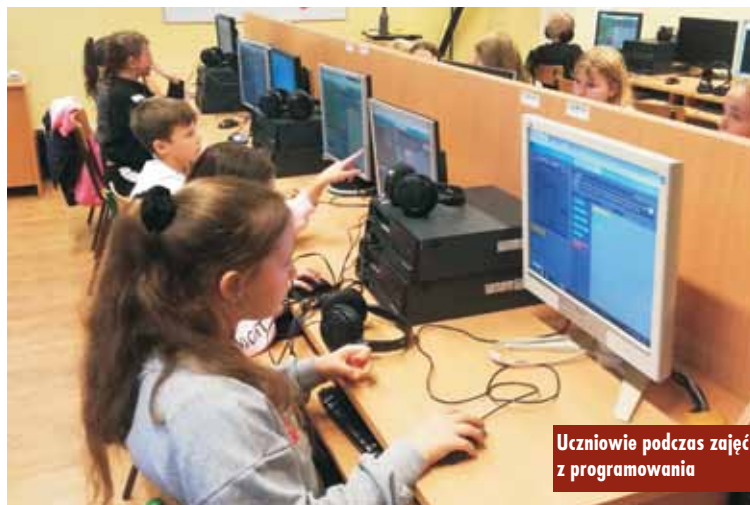
Uczniowie podczas zajęć z programowania

Kodowania, który odbywał się od 8 do 23 października br. Placówka włączyła się w ogólnoswiatowe obchody.