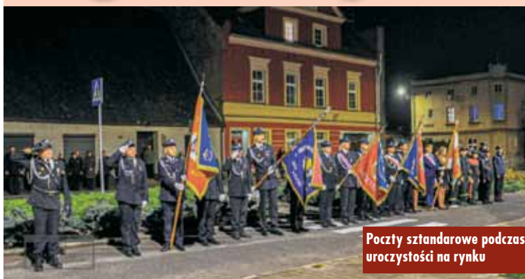
Pocztę sztandarową podczas uroczystości na rynku

Pierwszą częścią obchodów Narodowego Święta Niepodległości był Bieg dla Niepodległej, organizowany na rychtańskim „Orliku”, którego celem było uzyskanie minimum 1918 okrążeń „Orlika”. Bieg miał charakter otwarty – mógł biec każdy, w każdym wieku. Okrążenia wszystkich uczestników były sumowane – cel udało się osiągnąć.