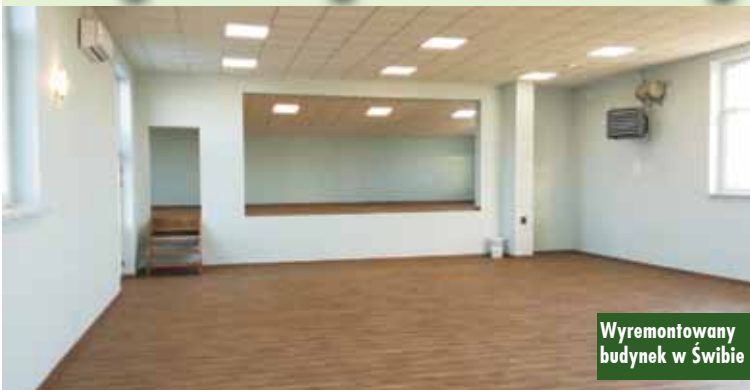
Wyremontowany budynek w Świbie

Zakończone zostały prace związane z realizacją zadania pn. „Remont budynku Ośrodka Kultury Fizycznej i Sportu w Świbie”. Projekt jest współfinansowany w kwocie 50.000 zł przez Samorząd Województwa Wielkopolskiego w ramach programu „Wielkopolska odnowa wsi 2020+”. Dzięki realizacji zadania w