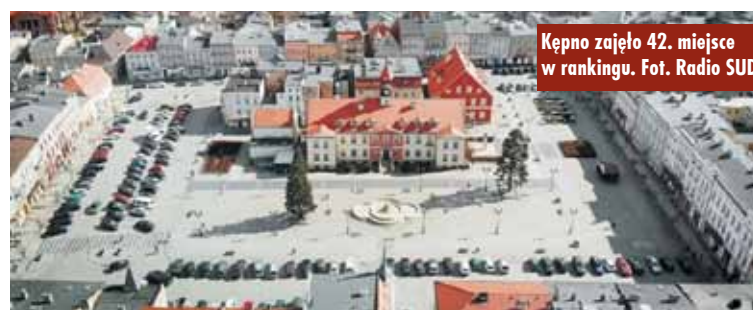
Kępno zajęło 42. miejsce w rankingu.

W klasyfikacji tej miasto i gmina Kępno zajęło 42. miejsce, otrzymując 99,701% punktów w rankingu. - Kępno posiada miejscowy plan zagospodarowania przestrzennego obejmujący całą gminę, czym może pochwalić się tylko część samorządów w kraju.