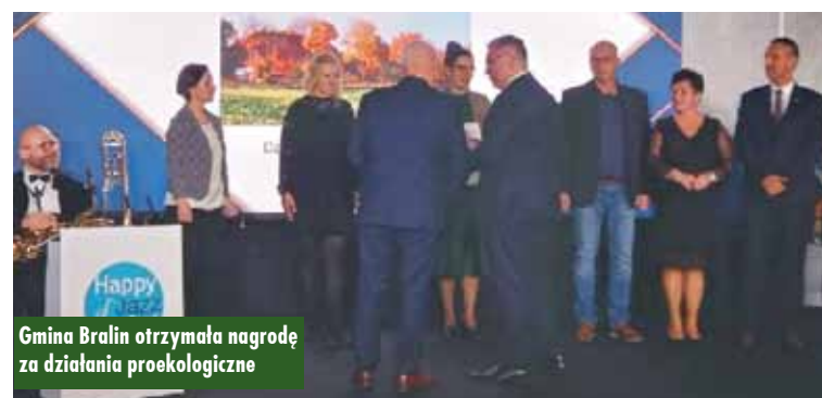
Gmina Bralin otrzymała nagrodę za działania proekologiczne