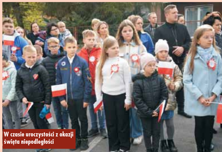
W czasie uroczystości z okazji święta niepodległości

rawieckiego. „Pod Biało-Czerwoną” to projekt, którego celem było zjednoczenie Polaków, uhonorowanie poległych za wolność i niepodległość naszej ojczyzny, ale także zachęcenie