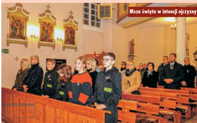
Msza święta w intencji ojczyzny