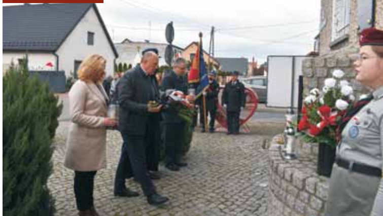
Oddali cześć bohaterom

Gmina Trzcinica po raz kolejny wydaje okolicznościowy kalendarz