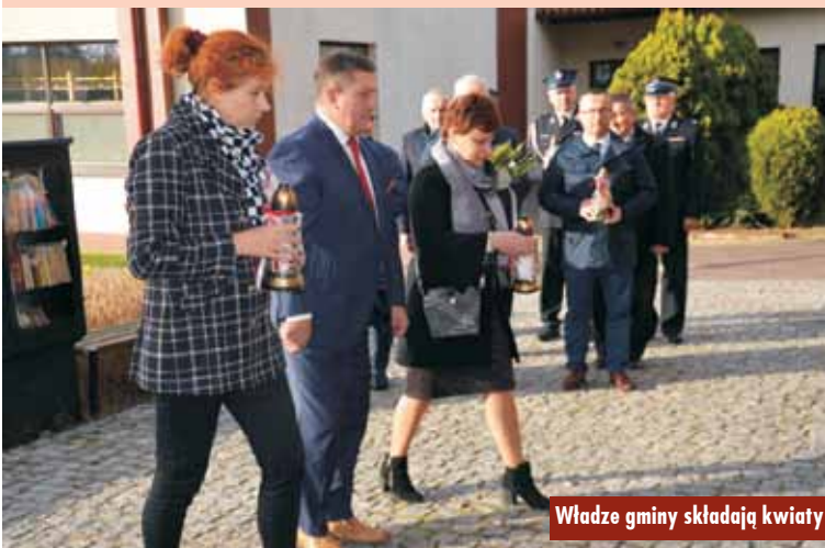
Władze gminy składają kwiaty