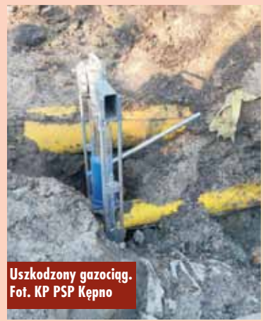
Uszkodzony gazociąg.

na wyznaczeniu strefy niebezpiecznej w promieniu 200 m od źródła wycieku, jednocześnie prowadzono