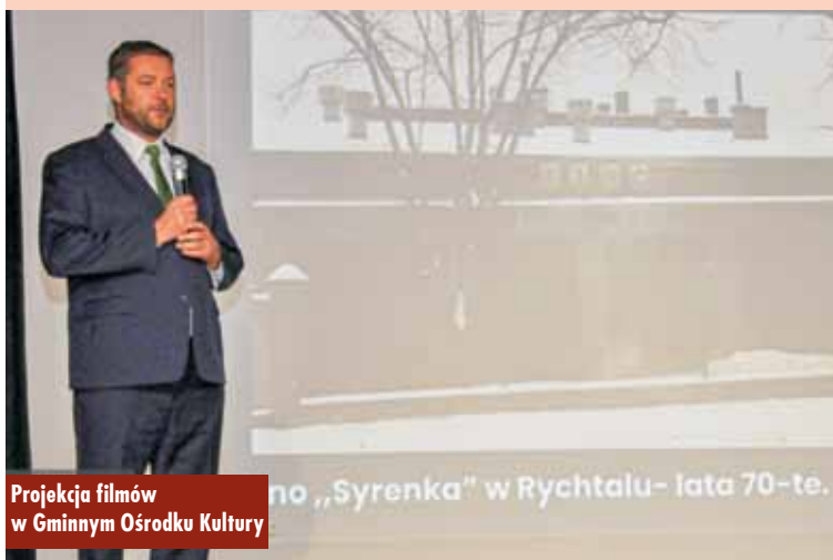
Projekcja filmów w Gminnym Ośrodku Kultury

Ostatnim wydarzeniem, upamiętniającym rocznicę odzyskania przez Polskę niepodległości, była projekcja dwóch produkcji filmowych, która miała miejsce w Gminnym Ośrodku Kultury, gdzie dawniej mieściło się rychtańskie kino „Syrenka”. Oprac. KR