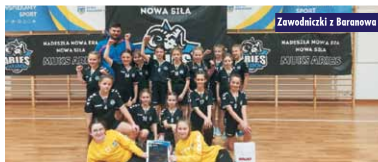
Zawodniczki z Baranowa

rozgrywki w tym właśnie terminie. Jestem dumna z postępów naszych kadrowiczek, ponieważ 4. miejsce w tym turnieju, po raptem kilku miesiącach od rozpoczęcia treningów, przy grze z tak znakomitymi zespo-