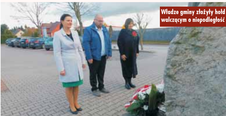
Władze gminy złożyły hołd walczącym o niepodległość

Gmina Perzów brała udział w projekcie „Pod białą-czerwoną” realizowanym pod honorowym patronatem