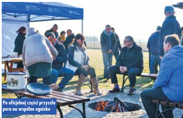
Po oficjalnej części przyszła pora na wspólne ognisko