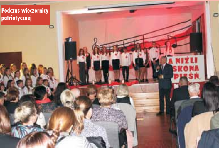
Podczas wieczornicy patriotycznej