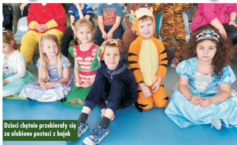
Dzieci chętnie przebierali się za ulubione postaci z bajek