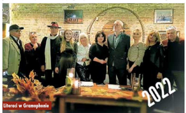
Literaci w Gramophonie