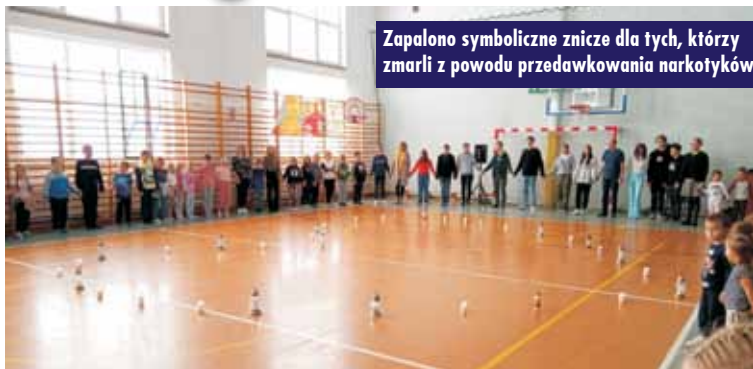
Zapalono symboliczne znicze dla tych, którzy zmarli z powodu przedawkowania narkotyków

W Zespole Szkół w Nowej Wsi Książęcej po raz pierwszy zainaugurowana została Kampania Białych Serc, która co roku porusza bardzo ważne kwestie dotyczące różnego rodzaju uzależnień i związanych z nimi zagrożeń. Tegoroczna, XVIII już, kampania trwała od 12 do 23 października, a jej hasłem przewodnim było: „Włącz alarm!”.