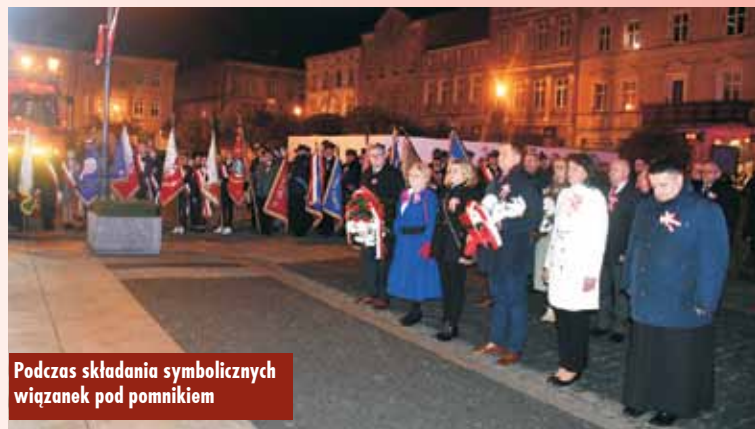
Podczas składania symbolicznych wiązanek pod pomnikiem