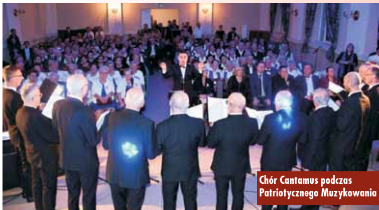
Chór Cantamus podczas Patriotycznego Muzykowania

naród, który ma silnie zakorzenione poczucie wolności. To naród, który niezłomnie dąży do tego, by swoje niepodległe i suwerenne państwo utrzymać i mieć. (...) Dziś, w 104. rocznicę odzyskania niepodległości, słowa: suwerenność, niepodległość i wolność nabierają jeszcze bardziej symbolicznego wymiaru. (...) Wolność to również obowiązek i troska, by poczucie solidarności i jednolitości nie stało się tylko fasadą, hasłem wypowiadanych od wielkiego święta. Ważnym jest, by niepodległość wiązała się ze świadomością i troską o to, co dostaliśmy w spadku po wielu pokoleniach Polaków, dla których nie tak oczywistym było życie w wolnym kraju. Ważnym jest, by to poczucie pielęgnować i rozwijać, nadawać mu sens i traktować jako ważny składnik naszej tożsamo-