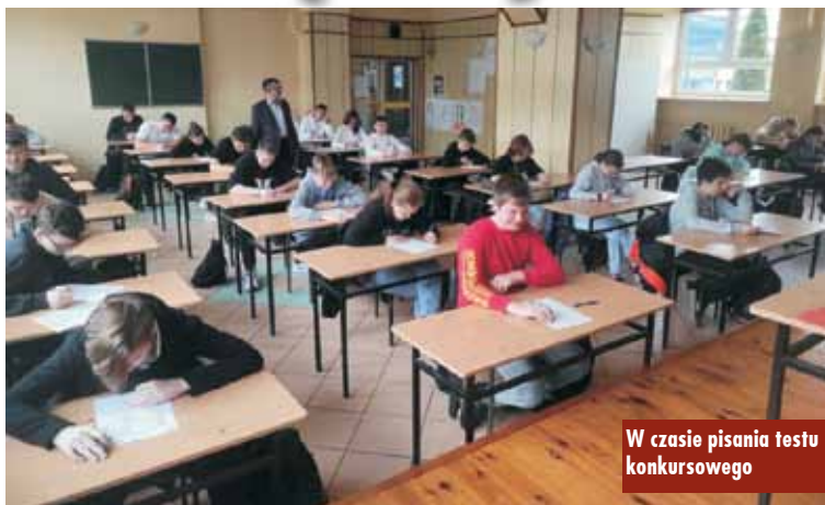
W czasie pisania testu konkursowego

W październiku 2022 r. w Zespole Szkół Ponadpodstawowych nr 2 w Kępnie odbyły się eliminacje szkolne XLVI edycji Olimpiady Wiedzy i Umiejętności Rolniczych w czterech blokach przedmiotowych: agrobiznes, mechanizacja rolnictwa, produkcja roślinna i produkcja zwierzęca. W eliminacjach udział wzięło ponad trzydziestu uczniów, uczących