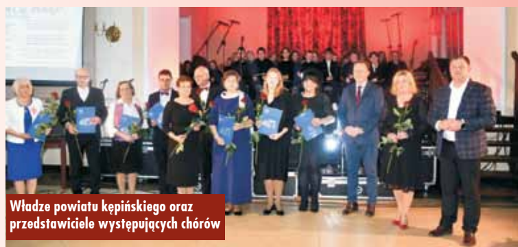
Władze powiatu kępińskiego oraz przedstawiciele występujących chórów