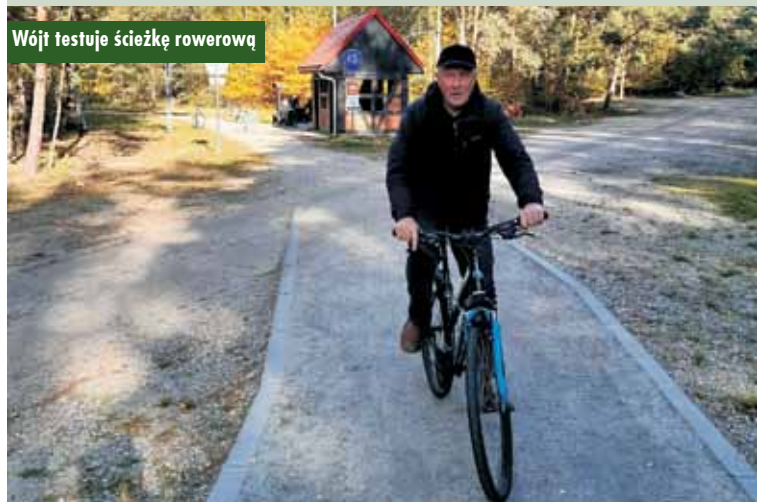
Wójt testuje ścieżkę rowerową