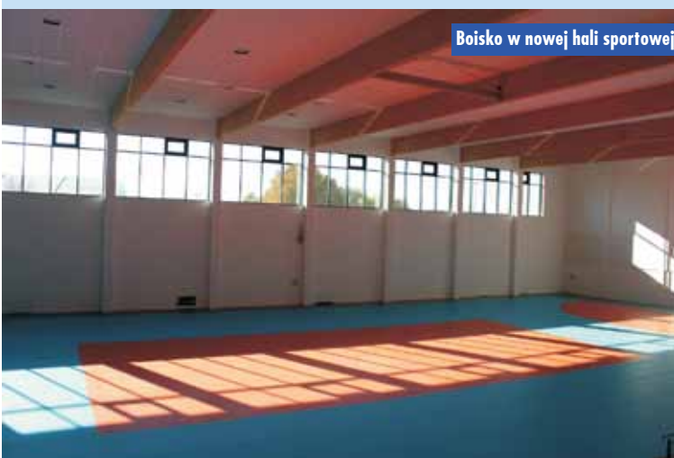
Boisko w nowej hali sportowej

Poprawa dostępności architektonicznej i komunikacyjno-informacyjnej budynku Urzędu Gminy Bralin dla osób ze szczególnymi potrzebami, w tym osób z niepełnosprawnościami