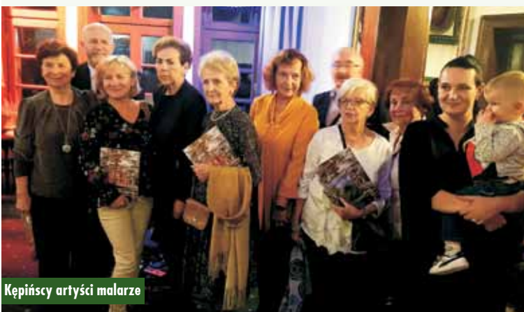
Kępińscy artyści malarze