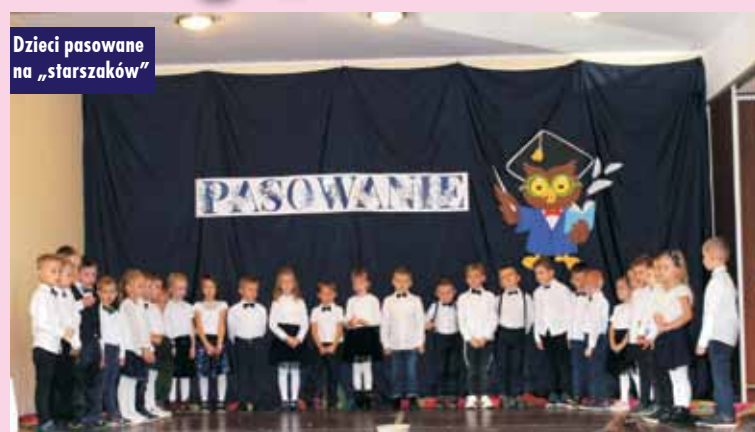
Dzieci pasowane na „starszaków”

Zajęcia w ramach projektu „Laboratoria przyszłości”