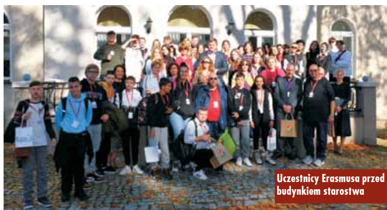
Uczestnicy Erasmus przed budynkiem starostwa

Łącznie w wymianie brało udział 41 uczniów z: Polski, Grecji, Turcji, Rumunii, Chorwacji i Portugalii. Towarzyszyło im 12 opiekunów. Oprac. m