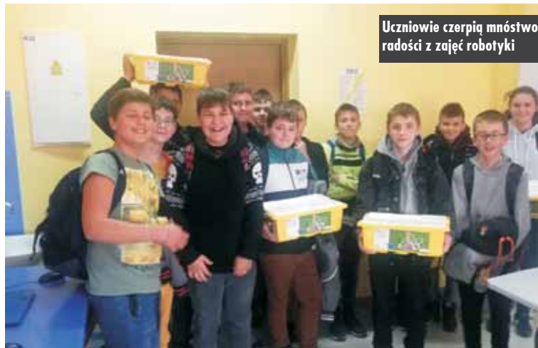
Uczniowie czerpią mnóstwo radości z zajęć robotyki