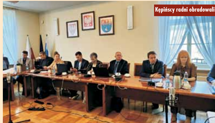
Kępińscy radni obradowali

odpowiadały samorządy, bo pojeździe transport, coś mu załadują i my mamy to sprzedawać. Ewentualny cały potencjalny hałas związany z jakością węgla ma spaść na lokalnych włodarzy. A my nie wiemy, skąd ten węgiel przyjedzie, a na skrzynce mailowej mam już kilka ofert firm, które chcą nam dostarczyć węgiel z Tadżykistanu, Kazachstanu, Indonezji,