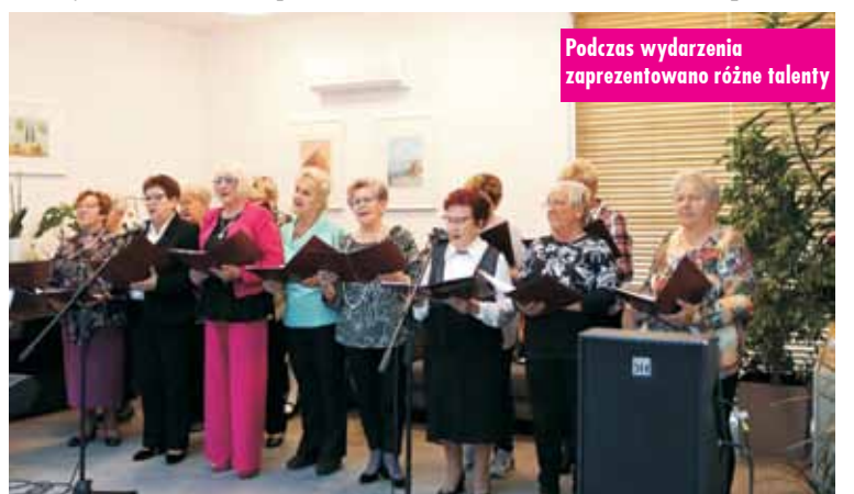
Podczas wydarzenia zaprezentowano różne talenty

Międzynarodowy Dzień Białej Laski i Dzień Seniora w Kępińskim Kole Polskiego Związku Niewidomych