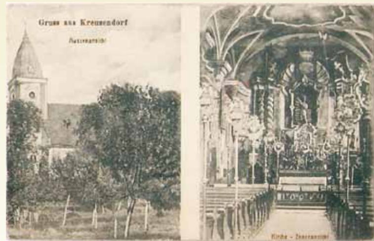
Pocztówka z kościołem w Krzyżownikach