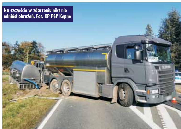
Na szczęście w zdarzeniu nikt nie odniósł obrażeń.