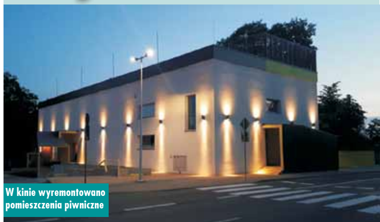
W kinie wyremontowano pomieszczenia piwniczne

Zakończony został remont pomieszczeń piwnicznych w budynku kina w Kępnie. Zadanie realizowane było w ramach programu „Kulisy kultury” z dofinansowaniem w kwocie 39.300 zł ze środków Samorządu Województwa Wielkopolskiego. Wykonawcą zadania było Przedsiębiorstwo Wielobranżowe UBBUD Urszula Sumisławska z Opola. Całkowita wartość zadania to 78.601,12 zł.