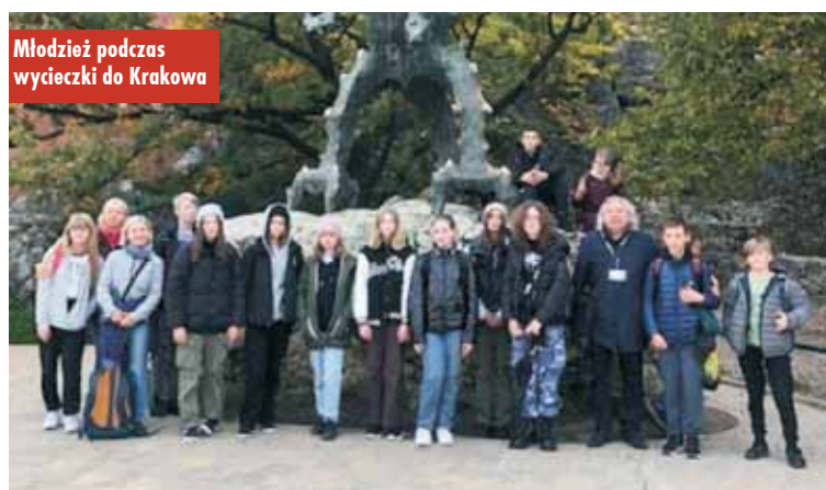
Młodzież podczas wycieczki do Krakowa

Wieczorem miłym przerwaniem po intensywnym zwiedzaniu Krakowa było wspólne czytanie krakowskich legend.