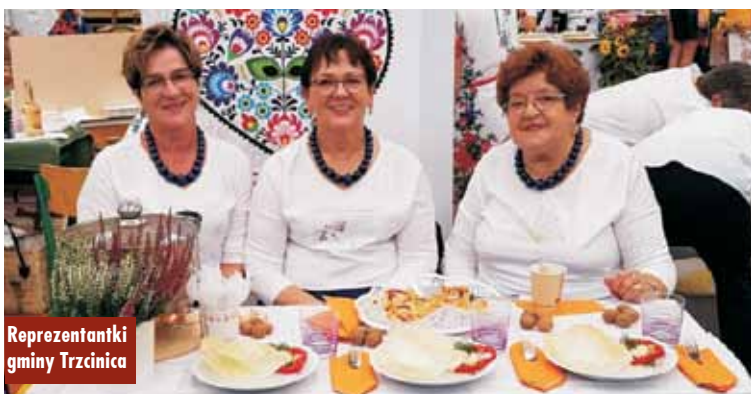
Reprezentantki gminy Trzcinińska