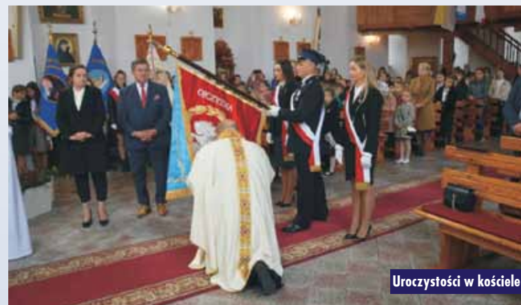
Uroczystości w kościele

wyбір patrona - Zadaniem szkoły jest nie tylko nauczanie, ale także wychowanie, pomaganie młodzieży w odnajdowaniu własnej tożsamości, określaniu swojego miejsca we współczesnym świecie i poszukiwaniu wzorców do naśladowania. Przy wyborze patrona grono pedagogiczne, rodzice i uczniowie naszej szkoły kierowali się właśnie tymi zasadami