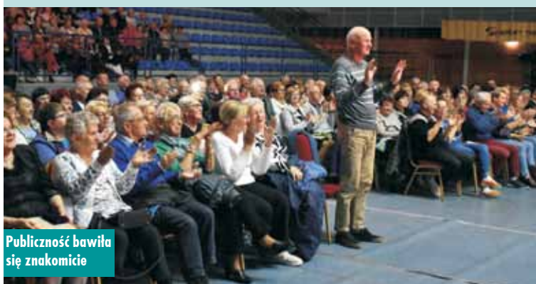
Publiczność bawiła się znakomicie

„Wyróżniony dyplomem z okazji 360-lecia nadania Kępnu praw miejskich”.