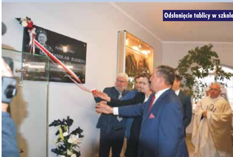
Odsłonięcie tablicy w szkole