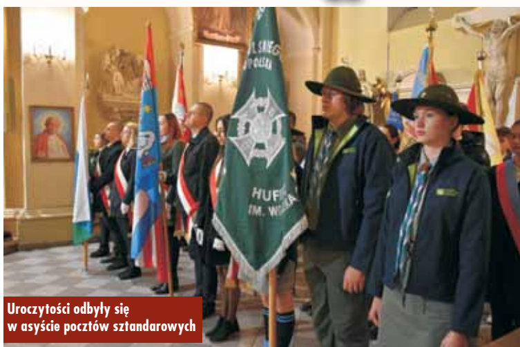
Uroczystości odbyły się w asyście pocztów sztandarowych