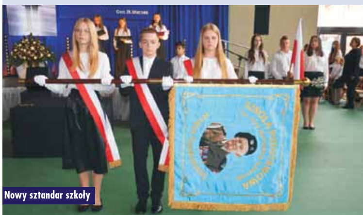
Nowy sztandar szkoły

Po zakończeniu eucharystii uformowano uroczysty pochód i wszyscy zgromadzeni przeszli do szkoły.