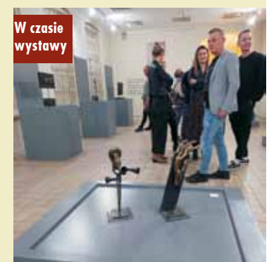
W czasie wystawy