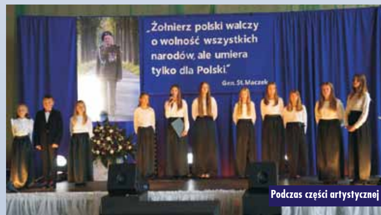
Podczas części artystycznej