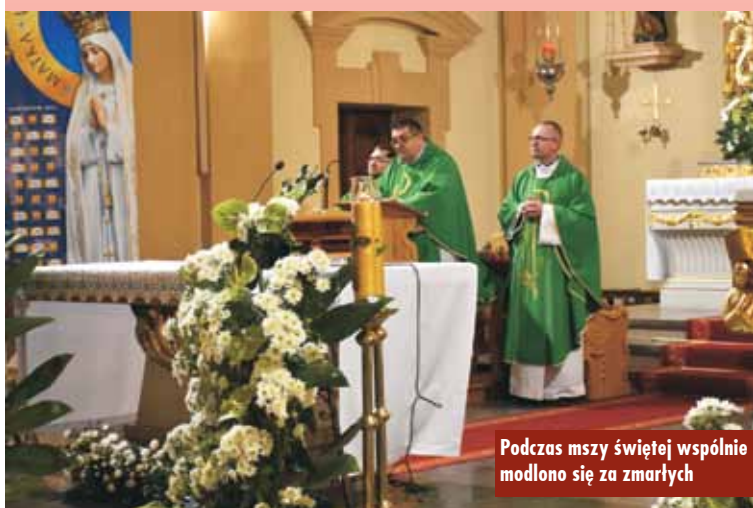
Podczas mszy świętej wspólnie modlono się za zmarłych

18 października 2022 r. Zarząd MUKS „Czarni” przy ZSP nr 1 w Kępnie zorganizował XXII Mistrzostwa Zespołu Szkół Ponadpodstawowych nr 1 w Siatkówce Plażowej Dziewcząt i Chłopców