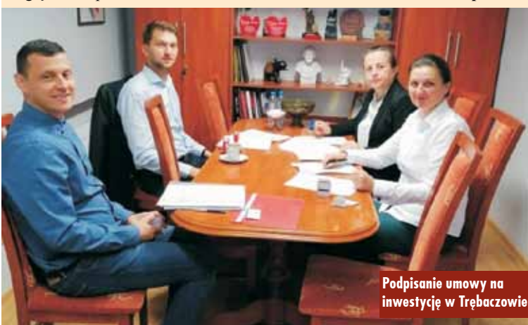
Podpisanie umowy na inwestycję w Trębaczowie