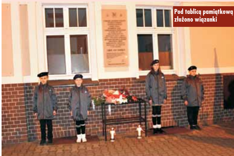
Pod tablicą pamiątkową złożono wianki