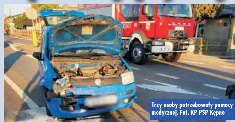
Trzy osoby potrzebowały pomocy medycznej.

Po dotarciu stwierdzono, że na drodze wojewódzkiej nr 482 doszło do zdarzenia z udziałem czterech samochodów osobowych. Trzy osoby podróżujące pojazdami wymagały pomocy medycznej. Na potrzeby działań zablokowano ruch na drodze. - Działania stra-