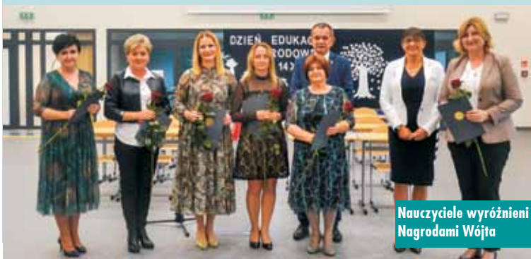
Nauczyciele wyróżnieni Nagrodami Wójta

Po części oficjalnej uczniowie kółka teatralnego „Głośna cisza” zaprezentowali program artystyczny. Zespół wokalo-instrumentalny wystąpił w utworach: „Pomaluj mój świat” i „Wędrownika”. Dodatkową atrakcją był pokaz tańca wykonany przez miejscowych uczniów. Na zaproszenie wójt, uroczystość dopełnił występ Stanisława Górki – aktora teatralnego i filmowego. Goście zostali obdarowani okolicznościowym upominkiem. spb