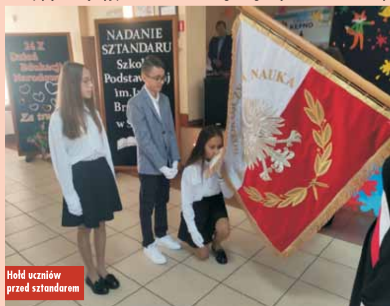
Hold uczniów przed sztandarem

bowiążując się do dbałości o niego i do godnego reprezentowania szkoły.