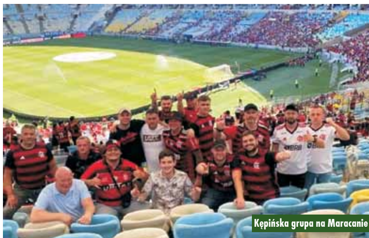
Kępińska grupa na Maracanie

piłkarskich. W tym spotkania Serie B [odpowiednik naszej I-Ligi], Vasco da Gama - Nautico, oraz dwóch spotkań Serie A, [odpowiednik naszej Ekstraklasy], Botafogo - Cortibia na stadionie olimpijskim w Rio, no... i na deser prawdziwy rarytas, którym są derby Ameryki Południowej - słynne FLA- FLU, czyli Flamengo- Fluminense na słynnej Maracanie. W Rio de Janeiro mieliśmy zaplanowany tydzień i z takim zamiarem rozpoczęliśmy swoją wyprawę. Najpierw wylecieliśmy samolotem z lotniska Chopina w Warszawie do Amsterdamu, następnie