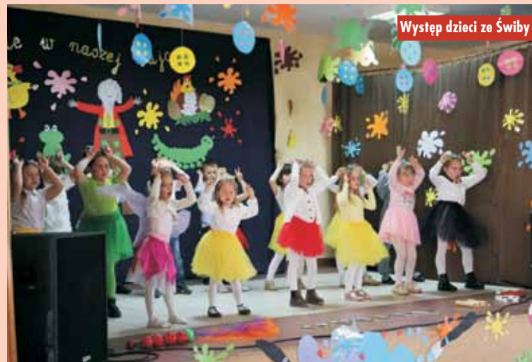
Występ dzieci ze Świby