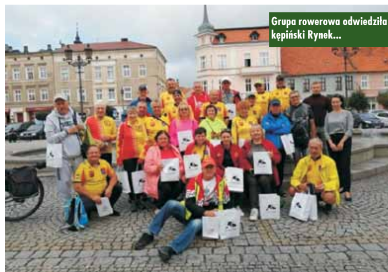
Grupa rowerowa odwiedziła kępiński Rynek...

Kolejnym miejscem, które czekało na grupę rowerzystów, było sanktuarium „Na Półku” pod Bralinem. - Miałem za zadanie bezpiecznie wyprowadzić całą grupę z Kępna