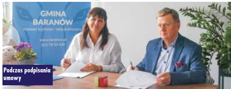
Podczas podpisania umowy

Przedmiotem umowy jest budowa przedszkola siedmiodziałowego wraz z niezbędną infrastrukturą techniczną oraz zagospodarowaniem terenu przy ul. Orlika. Przedszkole będzie usytuowane w pobliżu Kom-