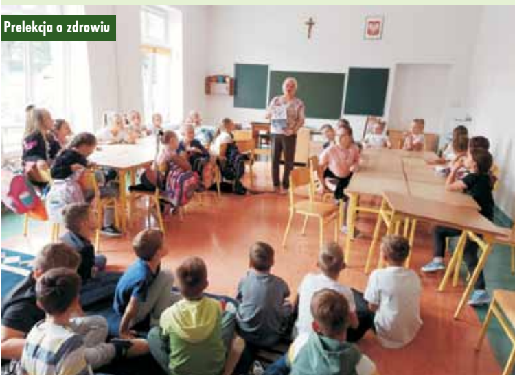
Prelekcja o zdrowiu