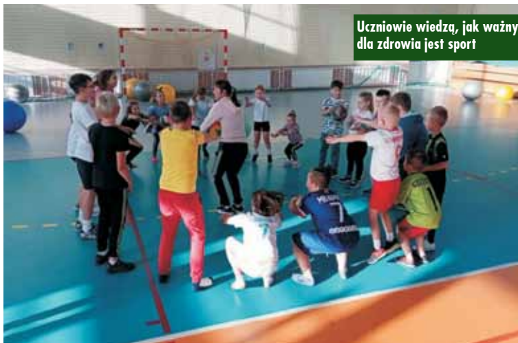
Uczniowie wiedzą, jak ważny dla zdrowia jest sport