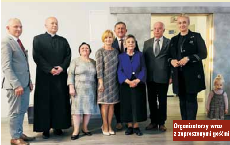
Organizatorzy wraz z zaproszonymi gośćmi