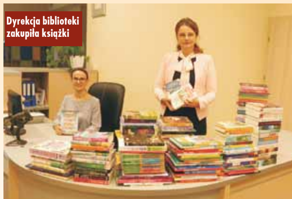
Dyrekcja biblioteki zakupiła książki

w finansowaniu zakupów nowości dla tych instytucji, a jednocześnie zmotywowania ich do systematycznego dbania o biblioteki samorządowe, ponoszenia kosztów związanych ze wzbogacaniem ich zasobów zgodnie