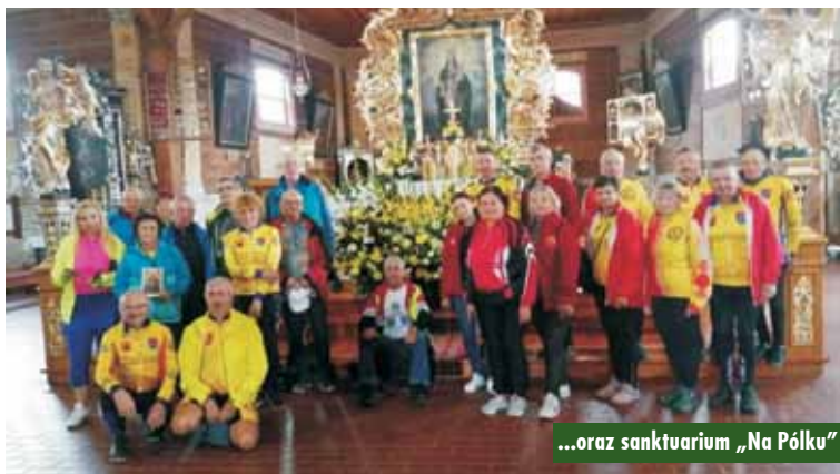
...oraz sanktuarium „Na Półku”