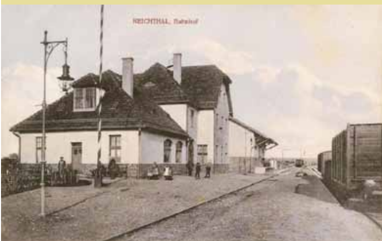
Dworzec kolejowy w Rychtalu w 1912 r.

ciniek tej linii kolejowej cieszył się sporym ruchem. Transport towarowy w latach 1913–1914 był tak intensywny, że kursowały dodatkowe składy pociągów towarowych z Rychtała do Wrocławia, którymi głównie przewożono drewno i opał węglowy. W Bukowie Śląskiej działały dwa magazyny pełne tarcicy i drobnicy. Dworzec w Rychtalu wystawiał w miesiącu od 1500 do 1700 listów przewozowych. Transport osobowy przynosił rów-