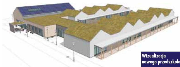
Wizualizacja nowego przedszkola

Światowy Dzień Kropki w Szkole Podstawowej im. Ojca Konrada Stolarka w Rychtalu