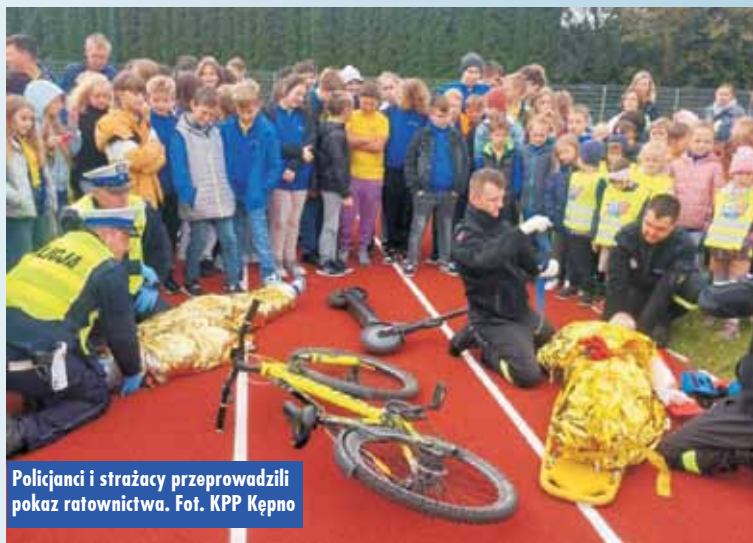
Policjanci i strażacy przeprowadzili pokaz ratownictwa.

W tym roku funkcjonariusze Komendy Powiatowej Policji w Kępnie oraz strażacy z Ochotniczej Straży Pożarnej w Baranowie w ramach akcji „Roadpol Safety Days” przeprowadzili pokaz i prelekcję dla najmłodszych uczestników ruchu drogowego, tj. uczniów Szkoły Podstawowej w Baranowie. Dla dzieci przeprowadzono prelekcję na temat prawidłowego korzystania z infrastruktury drogowej oraz rozstrzygnięto konkurs plastyczny na najładniejszą pracę, dotyczącą bezpieczeństwa w ruchu drogowym. Każda z prac została wyróżniona słodkim upominkiem, a trzy najlepsze zostały nagrodzone przez zastępcę naczelnika Wydziału Prewencji KPP Kępno oraz profilaktyka.