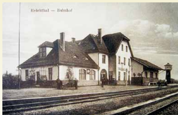
Dworzec kolejowy w Rychtalu w latach 1914-1917.

tury największymi stacjami stały się Rychtal i Kępno Zachodnie. Zwrotnice sterowane były ręcznie, a ruch pociągów odbywał się według zapowiadania telefonicznego. Wszystkie stacje wyposażone były w sygnalizację kształtową, nie posiadały semaforów wyjazdowych, więc sygnał