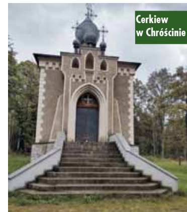
Cerkiew w Chróście

się znakomicie do samego końca biesiady, czyli do godziny 21.00. Po podziękowaniach za wspaniałe wydarzenie, wszyscy wrócili autokarem do Kępna. PZERiI Kępno