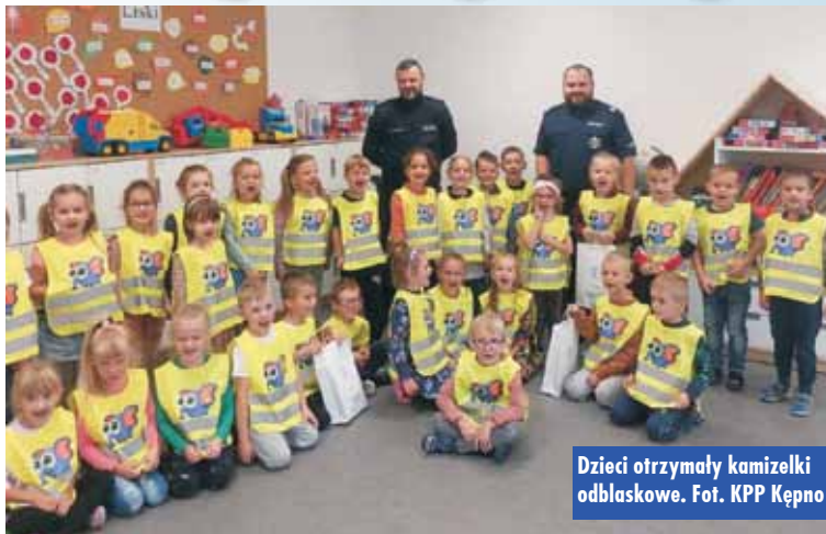
Dzieci otrzymały kamizelki odbłaskowe.

W tym roku funkcjonariusze Komendy Powiatowej Policji w Kępnie oraz strażacy z Ochotniczej Straży Pożarnej w Baranowie w ramach akcji „Roadpol Safety Days” przeprowadzili pokaz i prelekcję dla najmłodszych uczestników ruchu drogowego, tj. uczniów Szkoły Podstawowej w Baranowie. Dla dzieci przeprowadzono prelekcję na temat prawidłowego korzystania z infrastruktury drogowej oraz rozstrzygnięto konkurs plastyczny na najładniejszą pracę, dotyczącą bezpieczeństwa w ruchu drogowym. Każda z prac została wyróżniona słodkim upominkiem, a trzy najlepsze zostały nagrodzone przez zastępcę naczelnika Wydziału Prewencji KPP Kępno oraz profilaktyka.