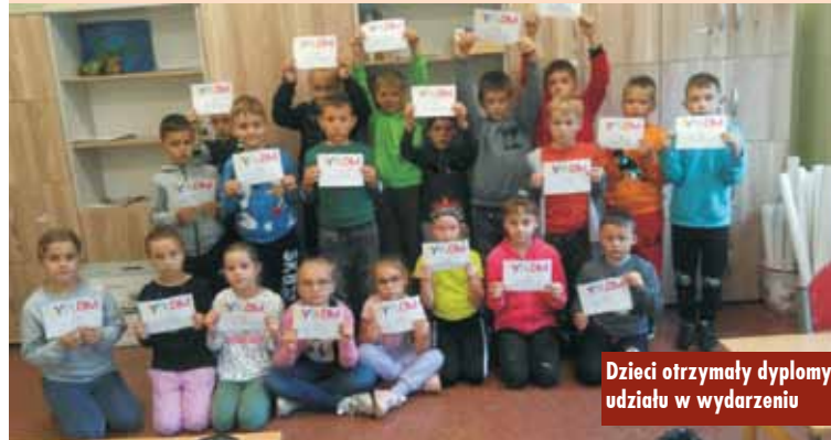
Dzieci otrzymały dyplomy udziału w wydarzeniu

od informacji i filmiku edukacyjnego na temat książki „The Dot” – „Kropka”, którą napisał Peter Reynolds (opowiada ona wzruszającą o kropce, która zmieniła świat małej Vashiti i dziewczynka uwierzyła w siebie). Uczniowie, dzięki różnym formom pracy i zabawy, utwierdzają się w