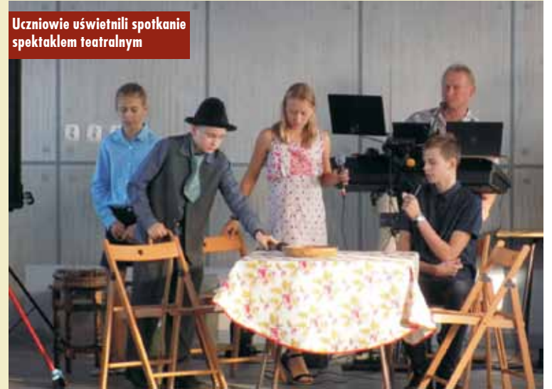
Uczniowie uświetnili spotkanie spektaklem teatralnym

świadczenie życiowe służą młodym pokoleniom, to seniorzy są bowiem, źródłem życiowej mądrości, której nabywa się z biegiem lat, niech każ-