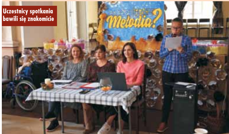
Uczestnicy spotkania bawili się znakomicie

Doskonała muzyka, rywalizacja drużynowa, a przede wszystkim świetna zabawa towarzyszyły uczestnikom spotkania, którzy wykazali się ogromną wiedzą, ale też wyczuciem rytmu i melodii. Oprac. KR