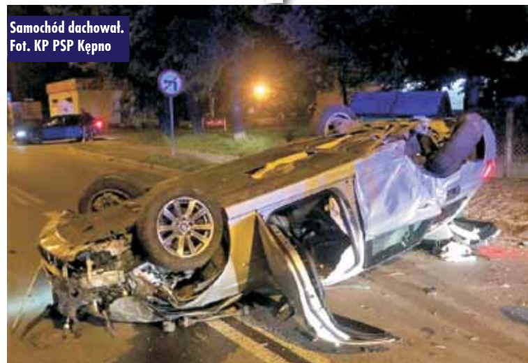
Samochód dachował.

22 września br., o godzinie 1.32, do Stanowiska Kierowania Komen-danta Powiatowej Państwowej Straży Pożarnej w Kępnie wpłynęło zgłoszenie o zdarzeniu na ul. Broniewskiego w Kępnie. Kierujący samochodem marki BMW stracił panowanie nad pojazdem, uderzył w przydrożne drzewo, po czym dachował. - Działania strażaków polegały na zabezpieczeniu miejsca zdarzenia i odłączeniu akumulatora w pojeździe. W akcji udział brały dwa zastępy z Jednostki Ratowniczo-Gaśniczej w Kępnie – relacjonuje mł. kpt. Jakub Sobczak z KP PSP w Kępnie. Na szczęście, w zdarzeniu nikt nie doznał poważnych obrażeń. Oprac. KR