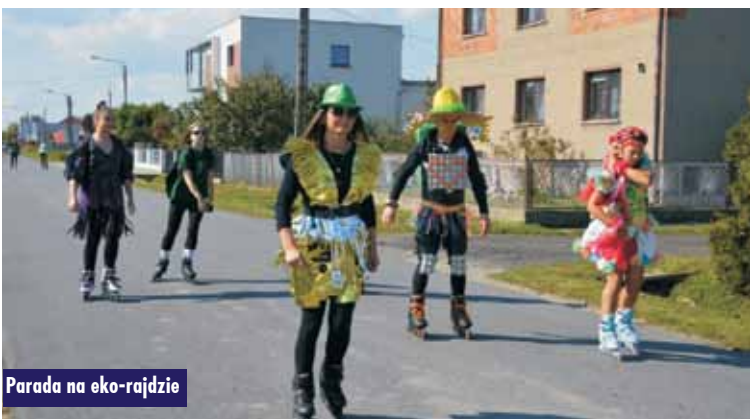
Parada na eko-rajdzie

W Szkole Podstawowej w Opatowie prowadzono akcję edukacyjną o zdrowiu