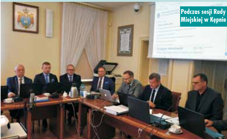
Podczas sesji Rady Miejskiej w Kępnie

Uchwała w sprawie podatków została przyjęta większością głosów. „Za” głosowało 14 radnych, a 3 wstrzymało się od głosu. 4 osoby były nieobecne. KR