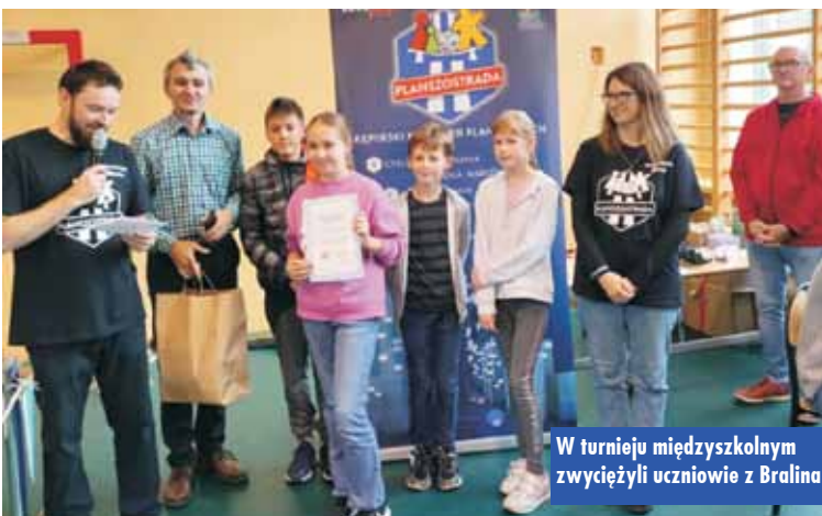
W turnieju międzyszkolnym zwyciężyli uczniowie z Braliną

Gry planszowe to zabawy łączące pokolenia. Dostarczają mnóstwa frajdy, integrują, uczą zdrowej rywalizacji, a przede wszystkim pozwalają oderwać się od telefonów, komputerów i telewizorów. Oprac. KR