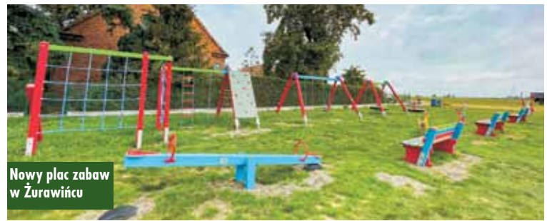
Nowy plac zabaw w Żurawincu