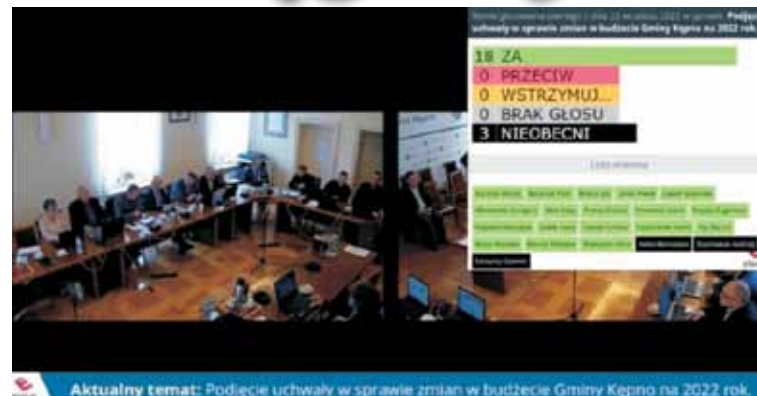
Aktualny temat: Podjęcie uchwały w sprawie zmian w budżecie Gminy Kępno na 2022 rok.

Radni jednogłośnie przegłosowali uchwałę o przyjęciu 5.202.000 zł z Wielkopolskiego Urzędu Wojewódzkiego i przekazaniu do realizacji przez Miejsko-Gminny Ośrodek Pomocy Społecznej. Oznacza to, że