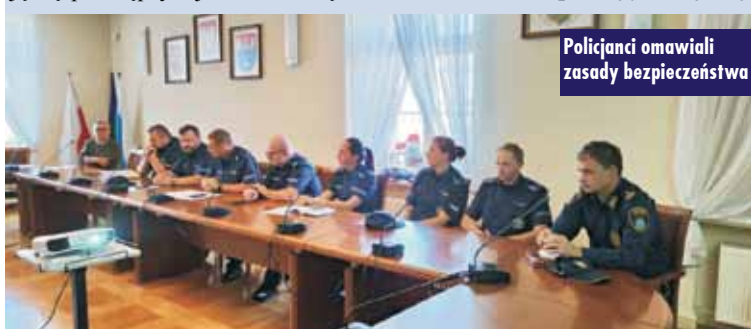
Policjanci omawiali zasady bezpieczeństwa

problemach. - Funkcjonariusze odpowiadali na liczne pytania, wyjaśniali wątpliwości, przypominali, jak najszybciej można nawiązać kontakt z dzielnicowym – np. poprzez aplikację „Moja komenda” czy poprzez strony internetowe Wielkopolskiej Policji. Szczegółowo omówiono również aplikację „Krajowej