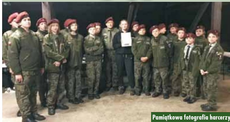
Pamiątkowa fotografia harcerzy

Również 111. WDH „Echo” otrzymała prezent – nowe koszulki od Powiatu Kępińskiego.