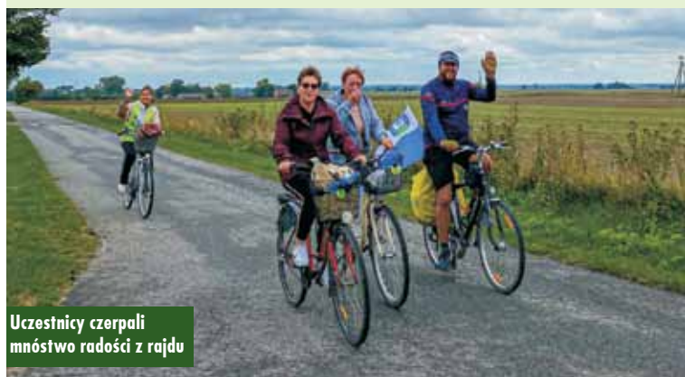
Uczestnicy czerpali mnóstwo radości z rajdu

gowego. Uczestnicy eskortowani byli przez patrol policji z posterunku w Trzcinicy z siedzibą w Laskach oraz Ochotniczą Straż Pożarną w Rychtalu.