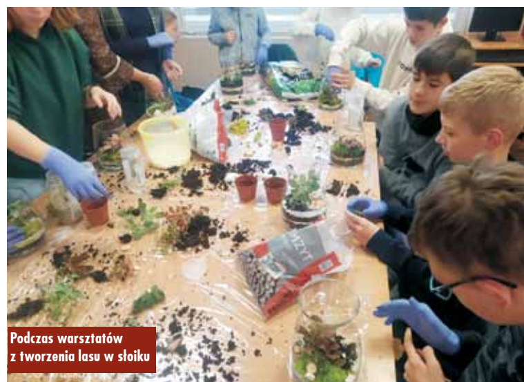
Podczas warsztatów z tworzenia lasu w słoiku

ze sobą i będą one piękną ozdobą w ich domach.