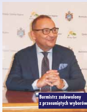
Burmistrz zadowolony z przesuniętych wyborów

utowanie do inwestycji to długi czas, może być liczony w latach. Sądzę, że u nas są idealne warunki do lokalizacji za plotem ZZO Olszowie takiej ciepłowni. Jest to ze wszelkich miar idealna lokalizacja, biorąc pod uwagę kierunek wiatrów, jakie tu występują. Mam nadzieję, że będziemy mogli procedować to przedsięwzięcie bardzo sprawnie – stwierdza burmistrz. - Przyjęliśmy sobie taki kalendarz, zakładając, że uwarunkowania zewnętrzne będą sprzyja-