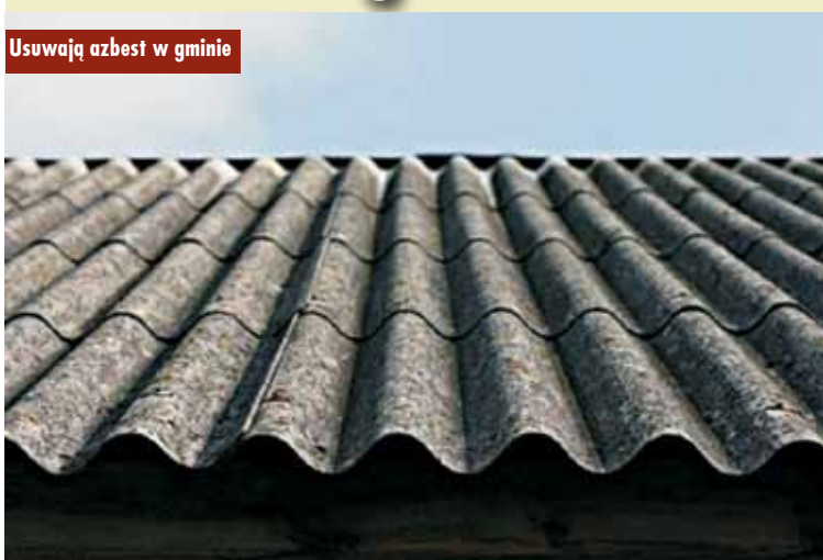
Usuwać azbest w gminie

Gmina Trzcinica uzyskała pomoc finansową ze środków Wojewódzkiego Funduszu Ochrony Środowiska i Gospodarki Wodnej w Poznaniu na zadanie „Usuwanie z terenu gminy Trzcinica wyrobów zawierających azbest” w formie dotacji w wysokości 45 000 zł.