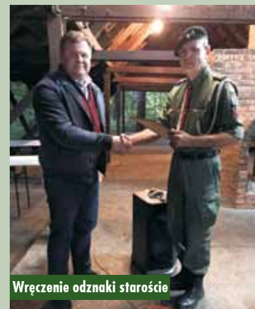
Wręczenie odznaki staroście

17 września br. odbywał się XXXX Rajd Alpinada, podczas którego świętowano 10. rocznicę działalności 111. Wielopoziomowej Drużyny Harcerskiej ECHO.