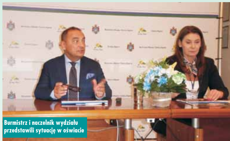
Burmistrz i naczelnik wydziału przedstawili sytuację w oświacie

- W ramach szukania oszczędności i apelu premiera o ograniczenie energii w urzędzie – wyłączyliśmy światła na korytarzach w urzędzie. Redukujemy do minimum zużycie energii w urzędzie. Szukamy oszczędności w wydatkach bieżących