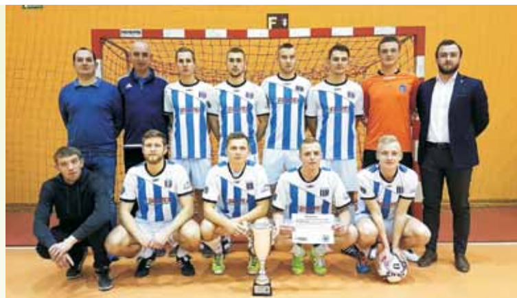
Polonia Kępno, po raz pierwszy w historii została halowym mistrzem okręgu kaliskiego. W finale rozgrywanego w Opatówku, Halowego Turnieju Seniorów im. Generała Edwarda Pastuszka gracze z Alei Marcinkowskiego pokonali trzeciroligowego Jarotę Jarocin