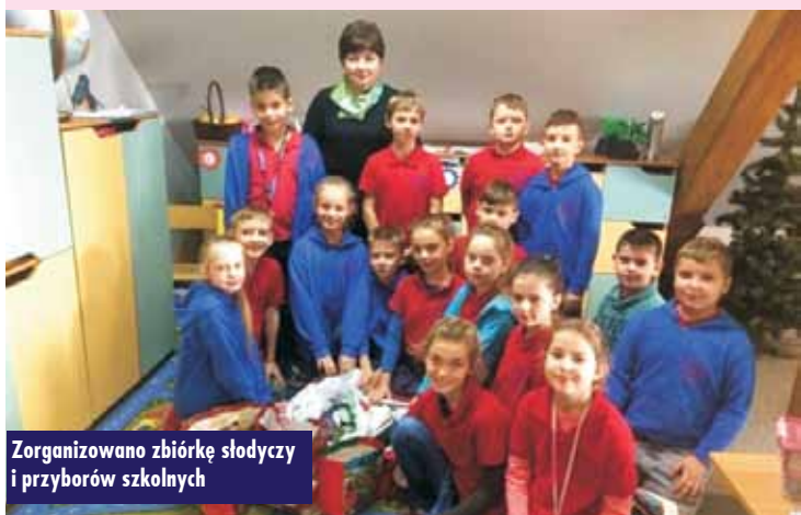
Zorganizowano zbiórkę słodyczy i przyborów szkolnych

22 grudnia 2017 r. w Szkole Podstawowej w Opatowie odbyło się spotkanie wigilijne pt. „Człowiek nie żyje tylko dla siebie”, podczas którego uczniowie opowiedzieli o swoich dobrych uczynkach z ostatniego miesiąca.