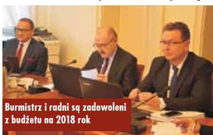
Burmistrz i radni są zadowoleni z budżetu na 2018 rok

na budowę krytej pływalni. Gmina chce również budować bloki przy ul. Obrońców Pokoju, aby docelowo powstało tam osiedle z 14 blokami. Projekt budżetu przewiduje też remonty dróg, rozbudowę infrastruktury sportowej i wiele innych inwestycji. - Chcemy sprostać wyzwaniom i nie zawieść zaufania, jakim obdarzyli nas mieszkańcy miasta i gminy Kępno. Chcemy zrealizować kolejne oczekiwania mieszkańców, którzy wybrali nas po to, abyśmy im służyli i realizowali zadania na ich rzecz, dla ich korzyści, starali się tak po-