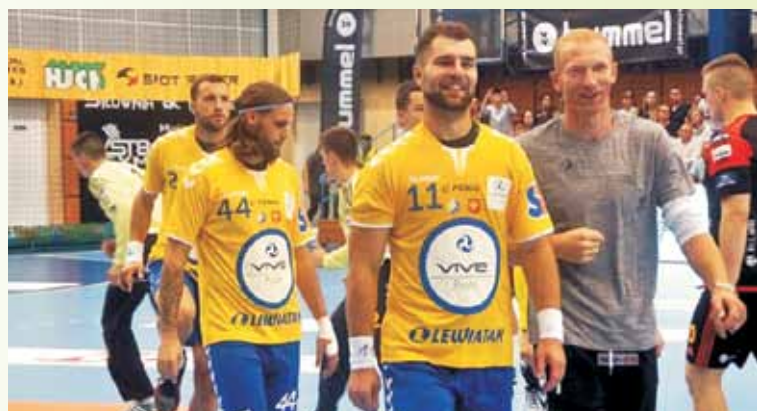
Zdobywca Pucharu Europy z 2016 roku – szczypiornistki Vive Kielce dali popis skuteczności już w pierwszym meczu kontrolnym podczas letnich przygotowań. W towarzyskim i zarazem charytatywnym meczu rozgrywanym w kępińskiej hali imienia Gwiazd Piłki Ręcznej kielczanieegrali Zagłębie Lubin 36:30