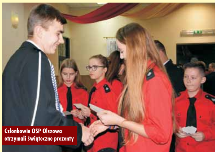
Członkowie OSP Olszowa otrzymali świąteczne prezenty

Podczas spotkania opłatkowego wspominano nie tylko mijający rok,