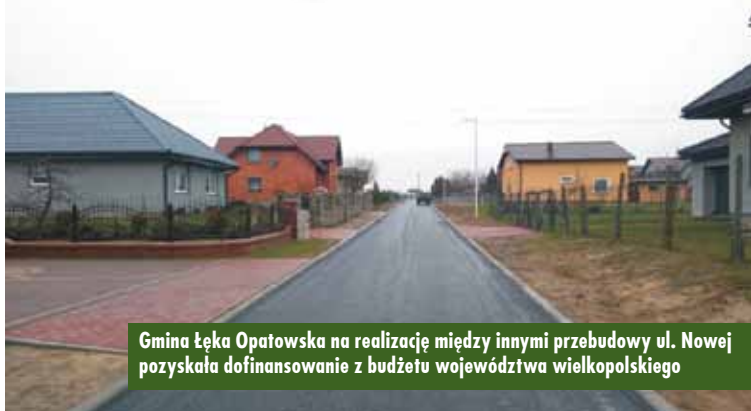
Gmina Łęka Opatowska na realizację między innymi przebudowy ul. Nowej pozyskała dofinansowanie z budżetu województwa wielkopolskiego

Zakończyły się prace związane z przebudową ul. Nowej w Łęce Opatowskiej wraz z wykonaniem kanalizacji deszczowej.