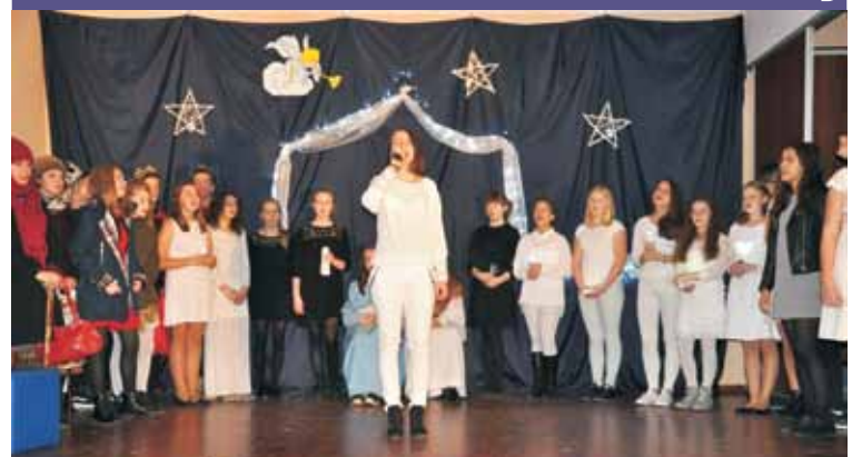
Prezentowanie było połączeniem współczesności z typową tematyką jasełek

Z doskonałym, współczesnym przedstawieniem dotyczącym tematyki bożonarodzeniowej wystąpili na deskach sceny bralińskiej „Tęczy” uczniowie miejscowej szkoły podstawowej.