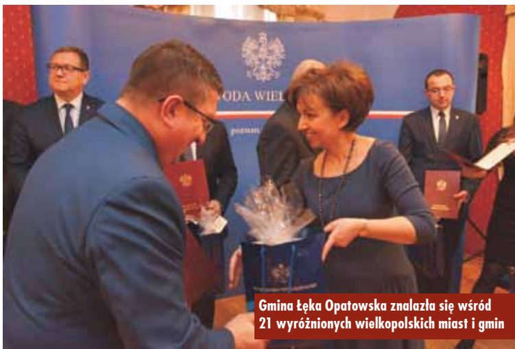
Gmina Łęka Opatowska znalazła się wśród 21 wyróżnionych wielkopolskich miast i gmin

Konkurs „Wielkopolska gmina przyjazna rodzinie” jest adresowany do wszystkich gmin i ma na celu wyróżnienie tych samorządów, które w sposób wyjątkowy realizują założenia polityki prorodzinnej. Konkurs promuje działania prorodzinne podejmowane przez gminy, prezentuje pozytywny obraz władz samorządowych oraz wskazuje liderów wśród wielkopolskich gmin, które mają na uwadze dobro rodzin. Oprac. bem