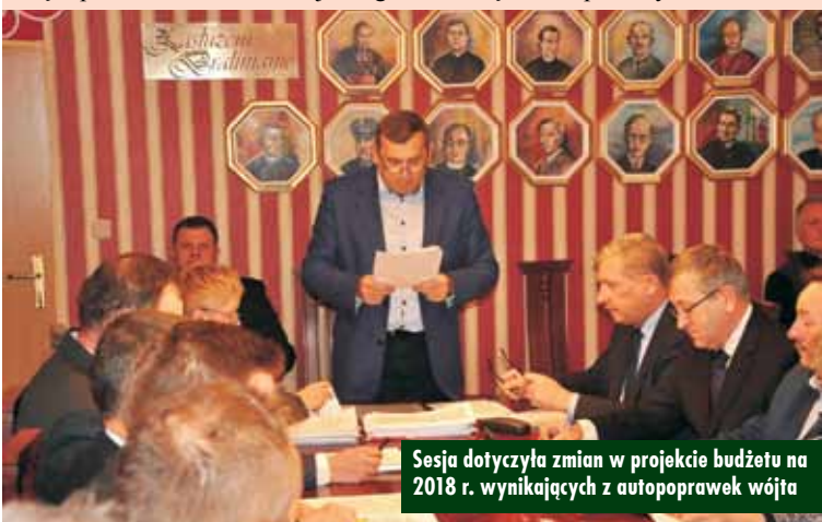
Sesja dotyczyła zmian w projekcie budżetu na 2018 r. wynikających z autopoprawek wójta

w Polsce. Następnie przyjęto kolejno wszystkie przygotowane pod głosowanie uchwały, czyli w sprawach: zmiany uchwały budżetowej na 2017