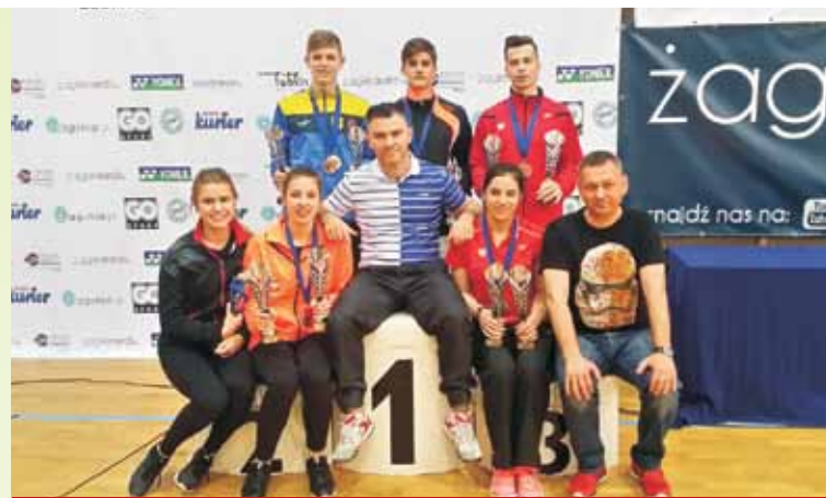
Miniony rok obfitował także w liczne sukcesy badmintonistów. Reprezentanci kępińskiego Vol-Tricka odnosili sukcesy zarówno na arenie krajowej jak i międzynarodowej