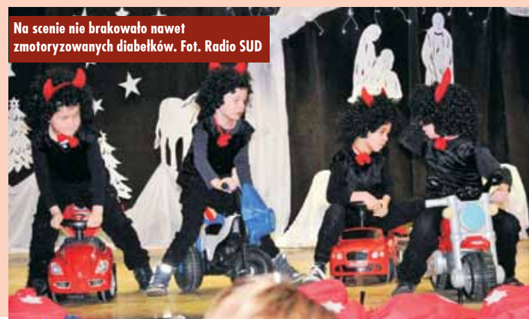
Na scenie nie brakowało nawet zmotoryzowanych diabełków.

Po życzeniach wszyscy zasiedli do wigilijnego stołu, aby wspólnie rozpocząć wieczerzę. Oprac. KR