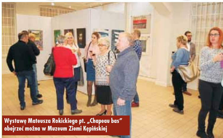
Wystawę Mateusza Rokickiego pt. „Chapeau bas” obejrzyć można w Muzeum Ziemi Kępińskiej