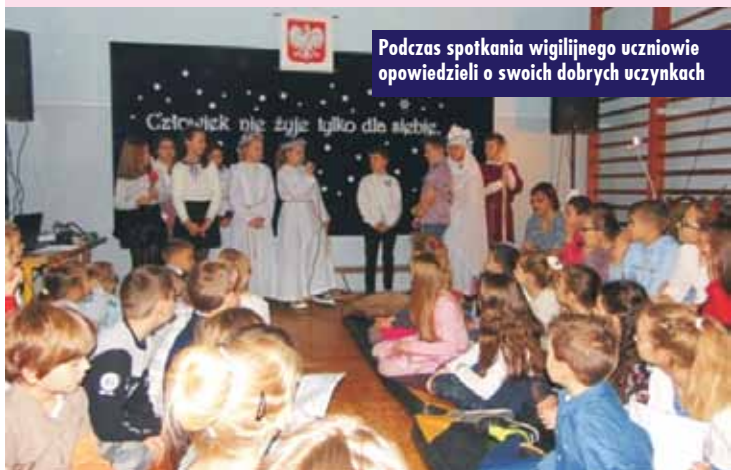
Podczas spotkania wigilijnego uczniowie opowiedzieli o swoich dobrych uczynkach