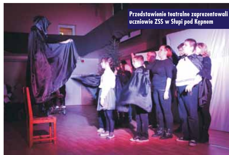
Przedstawienie teatralne zaprezentowali uczniowie ZSS w Słupi pod Kępnem

Obecne polityczne „przepychanki” o wolne od handlu niedziele i święta nie są niczym nowym. To przejaw odwiecznej walki między kapitałem a związkami zawodowymi. Przed 110 laty ówczesny związkowy projekt tak relacjonował „Kurier Poznański” z 22 grudnia: