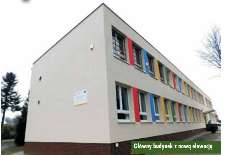
Główny budynek z nową elewacją

Modernizacja wykonana została w ramach zadania „Kompleksowa modernizacja energetyczna wraz z zastosowaniem inteligentnego zarządzania energią i wykorzystaniem odnawialnych źródeł energii w Zespole Szkół w Laskach”. Wykonano nowy izolowany dach, ściany ocieplono i nałożono nowe tynki, wymieniono część stolarki okiennej i drzwiowej zewnętrznej. Zmodernizowano oświetlenie, instalację wodociągową i kanalizację. Wymieniona została instalacja centralnego ogrzewania. Zamontowano instalację solarną, podobnie jak wiele innych elementów. Pomalowano też wszystkie pomieszczenia oraz korytarze. Największe zmiany dotyczą jednak nowej kotłowni zasilanej gazem ziemnym oraz