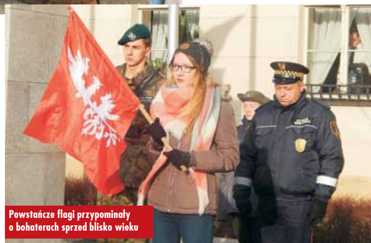
Powstańcze flagi przypominały o bohaterach sprzed blisko wieku

Powstanie Wielkopolskie rozpoczęło się 27 grudnia 1918 roku w Poznaniu i było największym, a co najważniejsze zakończonym sukcesem, zrywem niepodległościowym na terenie zaborów. Dzięki zwycięstwu