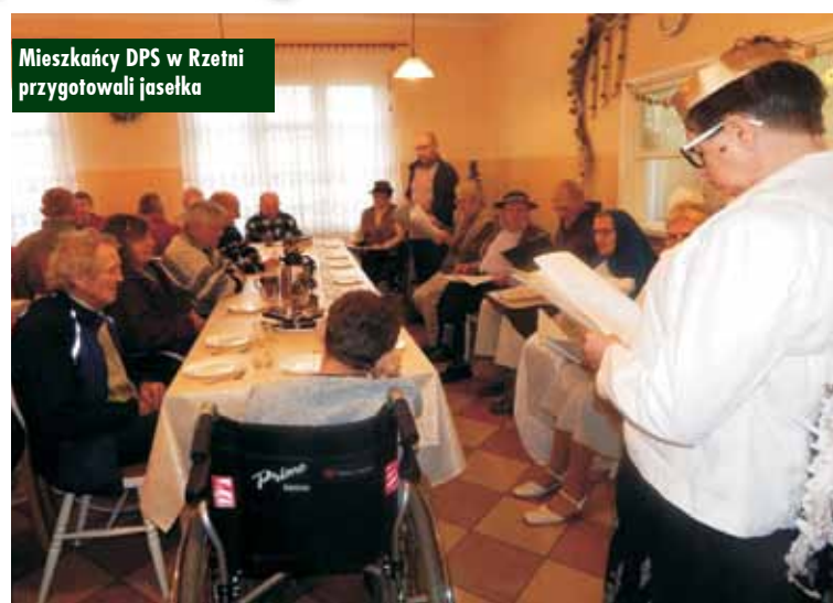
Mieszkańcy DPS w Rzetni przygotowali jasełka