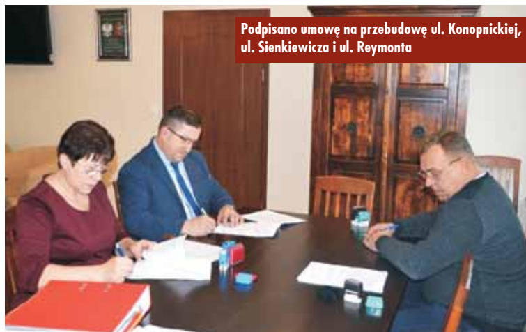
Podpisano umowę na przebudowę ul. Konopnickiej, ul. Sienkiewicza i ul. Reymonta