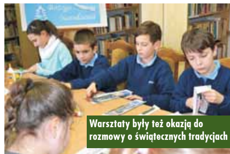
Warsztaty były też okazją do rozmowy o świątecznych tradycjach