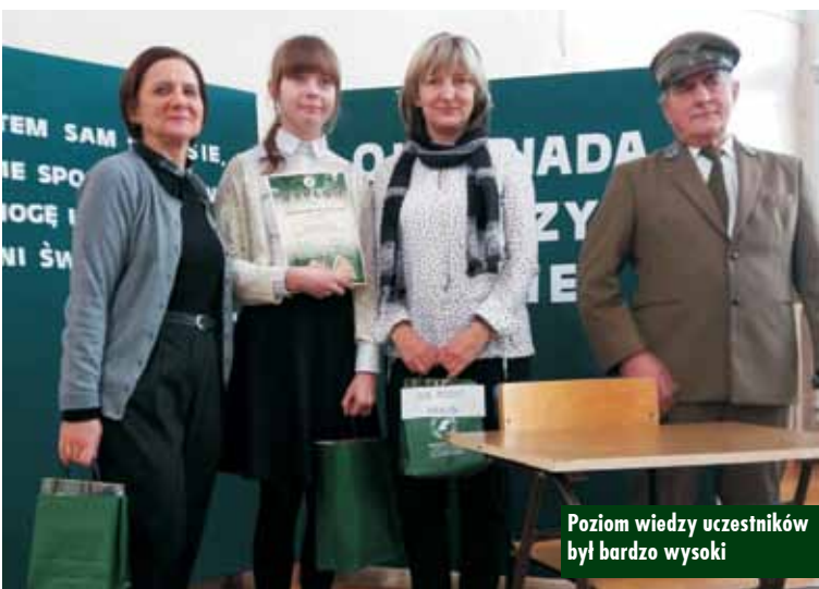
Poziom wiedzy uczestników był bardzo wysoki

Stowarzyszenie Sołtysów Powiatu Kępińskiego podsumowało mijający 2017 rok