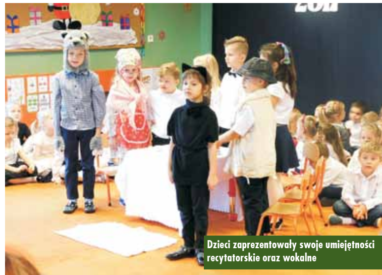
Dzieci zaprezentowały swoje umiejętności recytatorskie oraz wokalne

Wójt podziękował za zorganizowane spotkanie, pochwalił umiejętności wokalne dzieci, życząc im wymarzonych prezentów oraz przekazał przedszkolakom upominki. Dużą niespodzianką dla dzieci okazały się nowe zabawki, które otrzymał każdy oddział przedszkolny. Oprac. bem