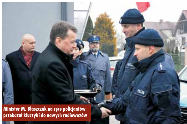
Minister M. Błaszczak na ręce policjantów przekazał kluczyki do nowych radiowozów