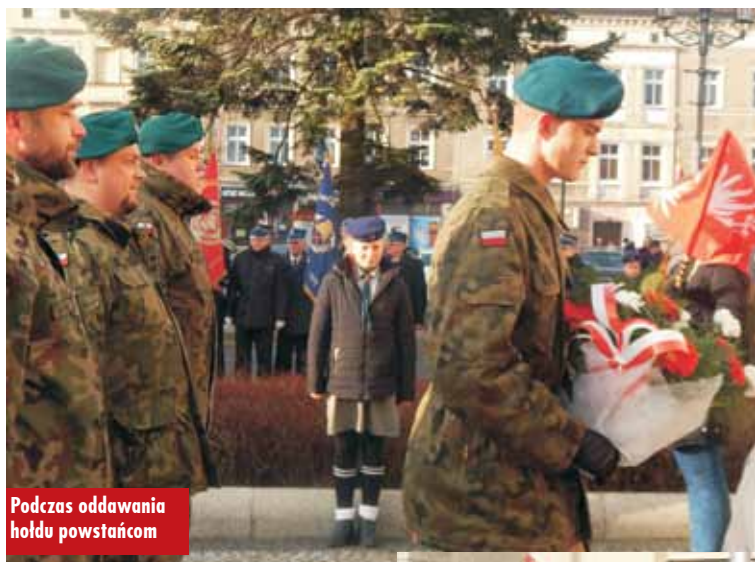
Podczas oddawania hołdu powstańcom