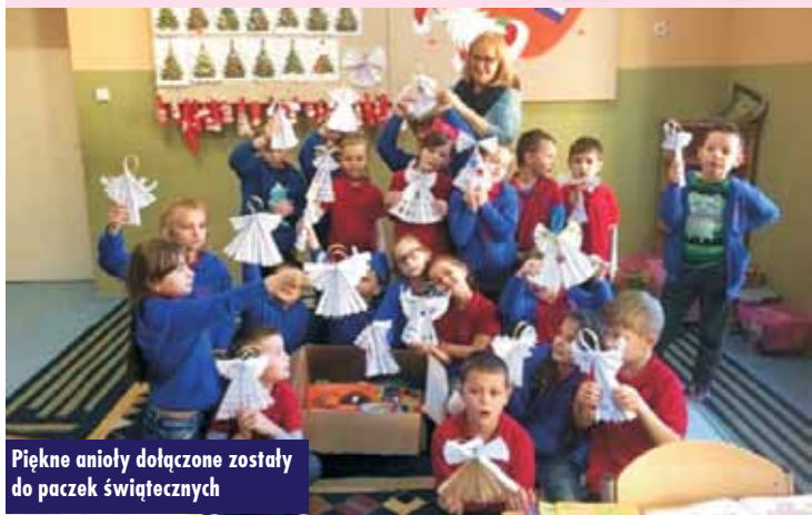
Piękne anioły dołączone zostały do paczek świątecznych