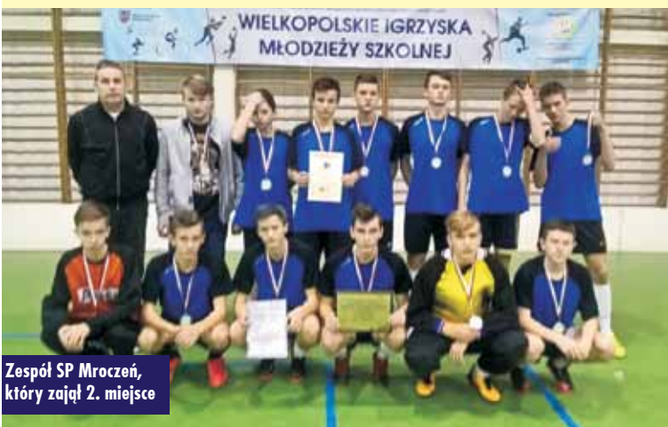
Zespół SP Mroczeń, który zajął 2. miejsce