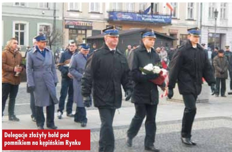
Delegacje złożyły hołd pod pomnikiem na kępińskim Rynku